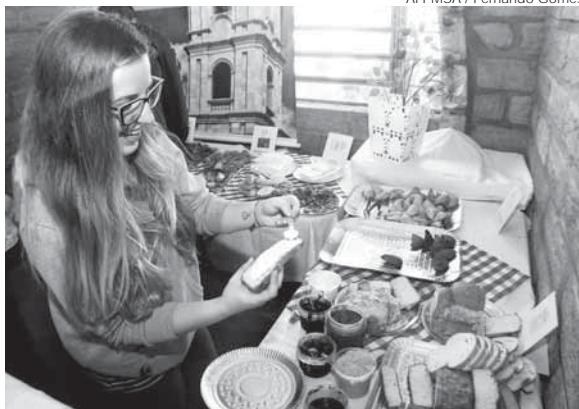
A primeira edição do Café Colonial Missioneiro, foi realizado no Pavilhão de Hortifrutigranjeiros da Avenida Venâncio Aires

A segunda edição do Café Colonial Missioneiro está confirmada para o dia 9 de dezembro, o segundo sábado do mês, acertado como data permanente para a sua realização. Formenton informou que ainda nesta