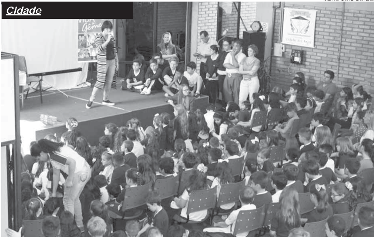
Mais de 50 escolas de Santo Ângelo passaram pela Feira em 2017