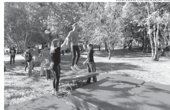
Atividades realizadas em 2016

A 4ª edição do Domingo na URI será no dia 19 de novembro, a partir das 14h. O evento abre as portas do campus Santo Ângelo para proporcionar momentos de lazer e integração. "A comunidade local e regional está convidada para participar das atividades. Buscamos consolidar a aproximação com a comunidade", afirma o diretor-acadêmico da