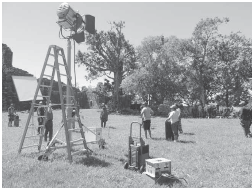
Gravações aconteceram na última segunda-feira, dia 13, em São Miguel das Missões