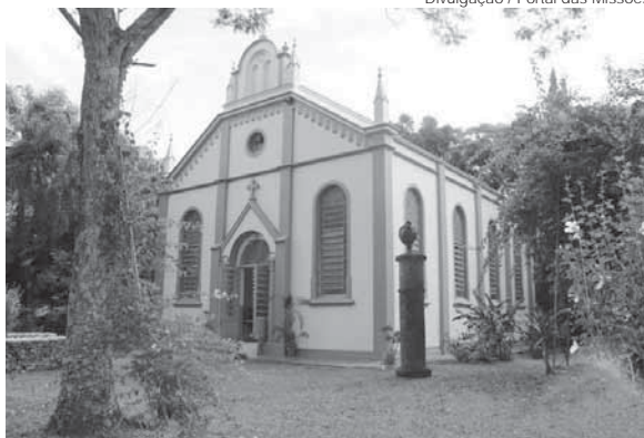
Santuário do Caaró, em Caibaté