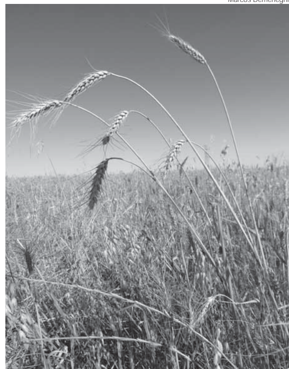
Trigo que ainda não foi colhido em Santo Ângelo

O chefe da EMATER lembra que a cultura do milho está com expectativa de obtenção de boa produtividade, pois as condições climáticas durante o ciclo foram favoráveis e também, se alia a este fato, o bom nível de tecnologia utilizada pelos produtores.