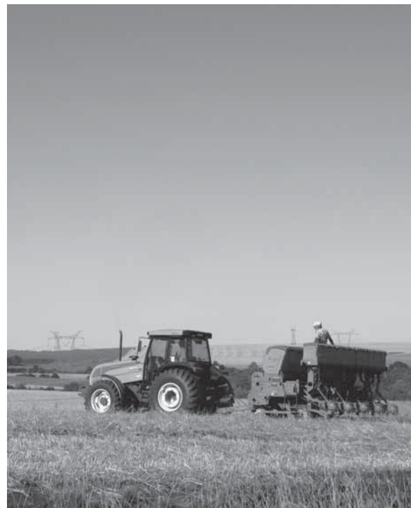
Produtor planta às margens da estrada de acesso a Buriti