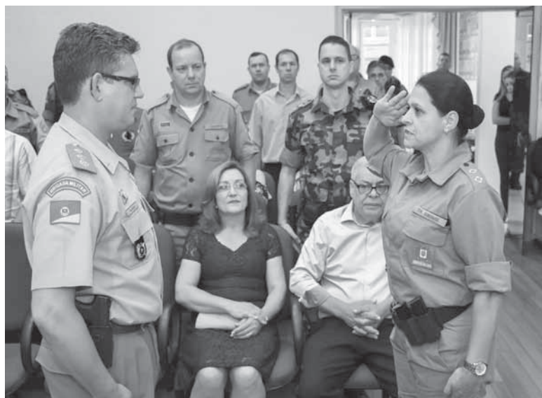
Policiais da reserva e ativa foram homenageados pelo trabalho de destaque na BM