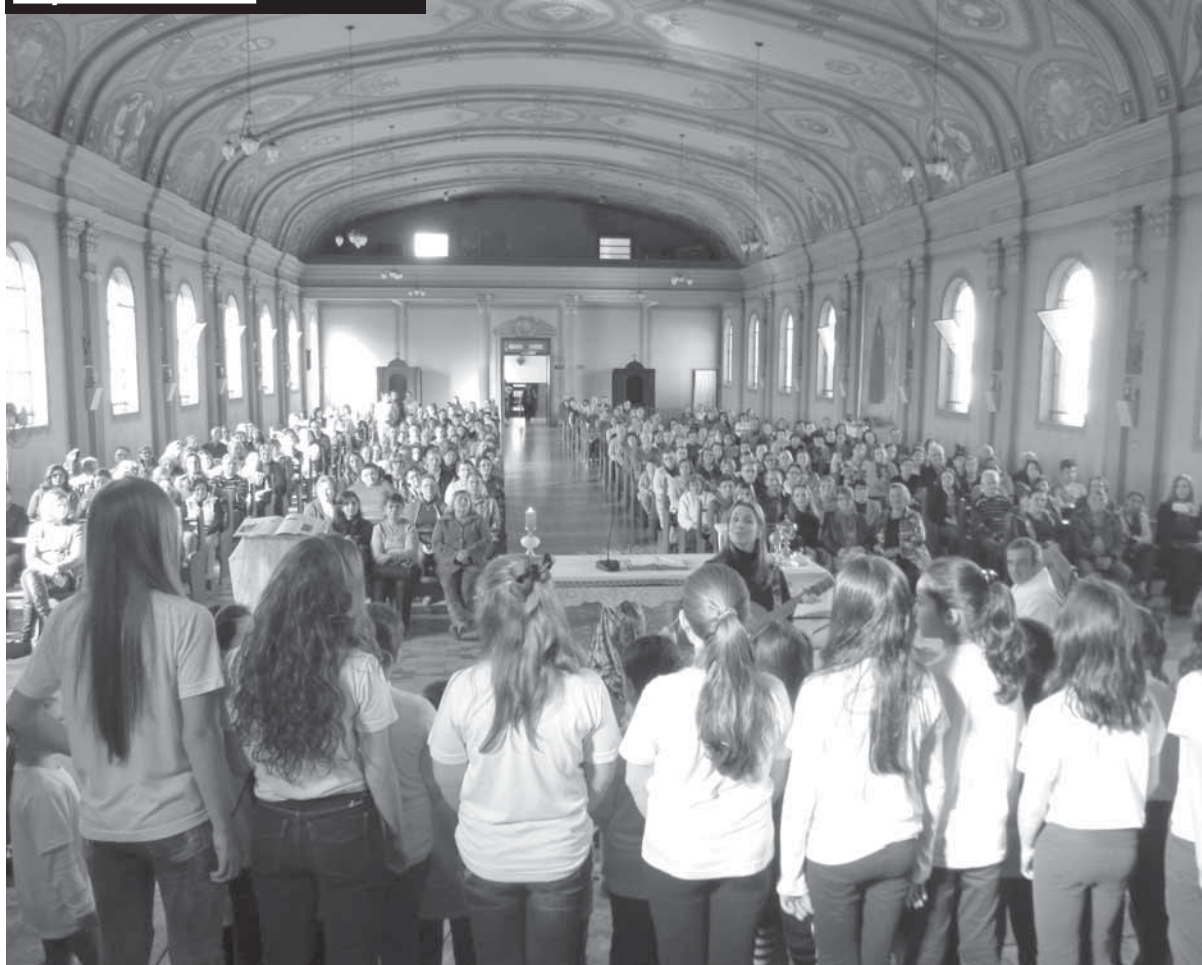
Alunos cantam na capela do Colégio Verzeri (Foto Ilustrativa)