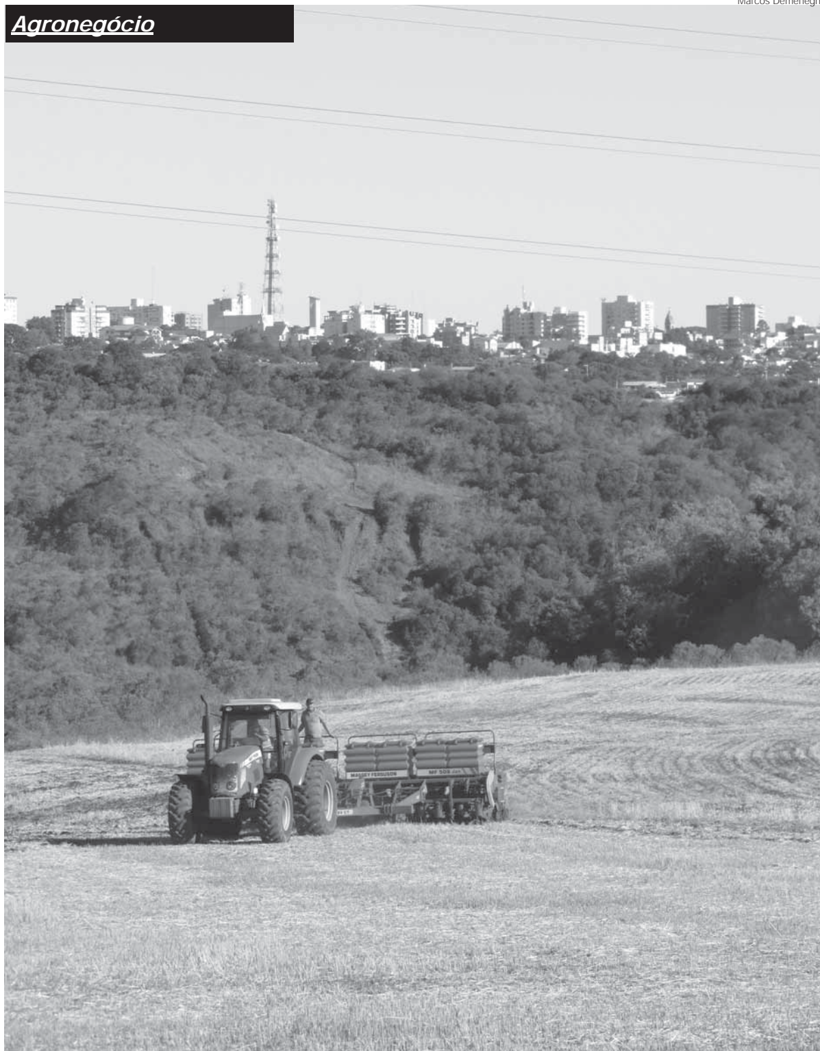
Semeadura da safra de soja em 2017/2018 em terras próximas da zona urbana de Santo Ângelo