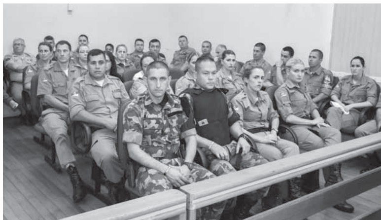
Policiais lotaram o Plenário Juarez Lemos para acompanhar a sessão