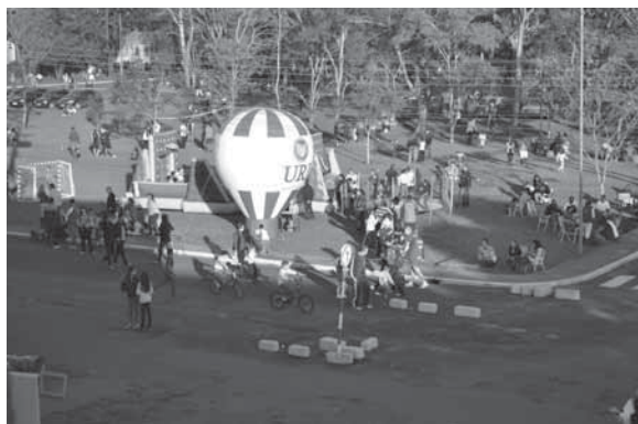
Domingo da URI no ano de 2015