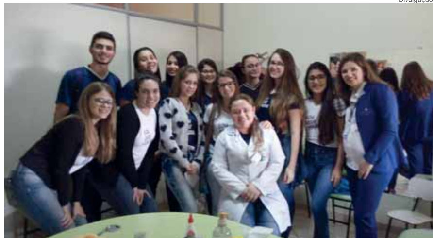
Grupo de alunos com psicóloga

No dia 10 de novembro, alunos do 3º Ano do Ensino Médio interessados em atuar na área da saúde, realizaram uma atividade de Imersão no Hospital e Centro de Reabilitação São José, da Rede Verzeri, no município de Giruá/RS.