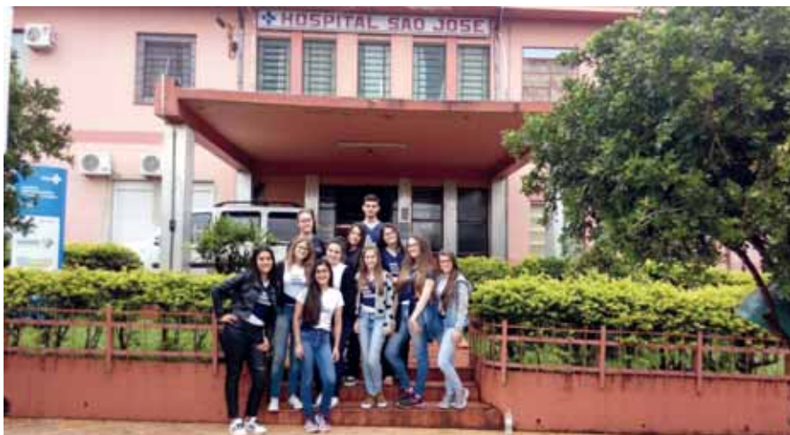
Grupo de alunos participantes