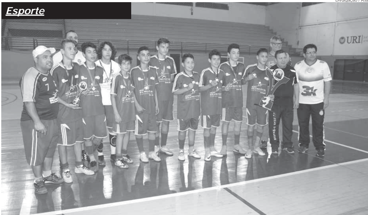
Bola pro Futuro, de Santiago, foi a campeã na categoria sub-13