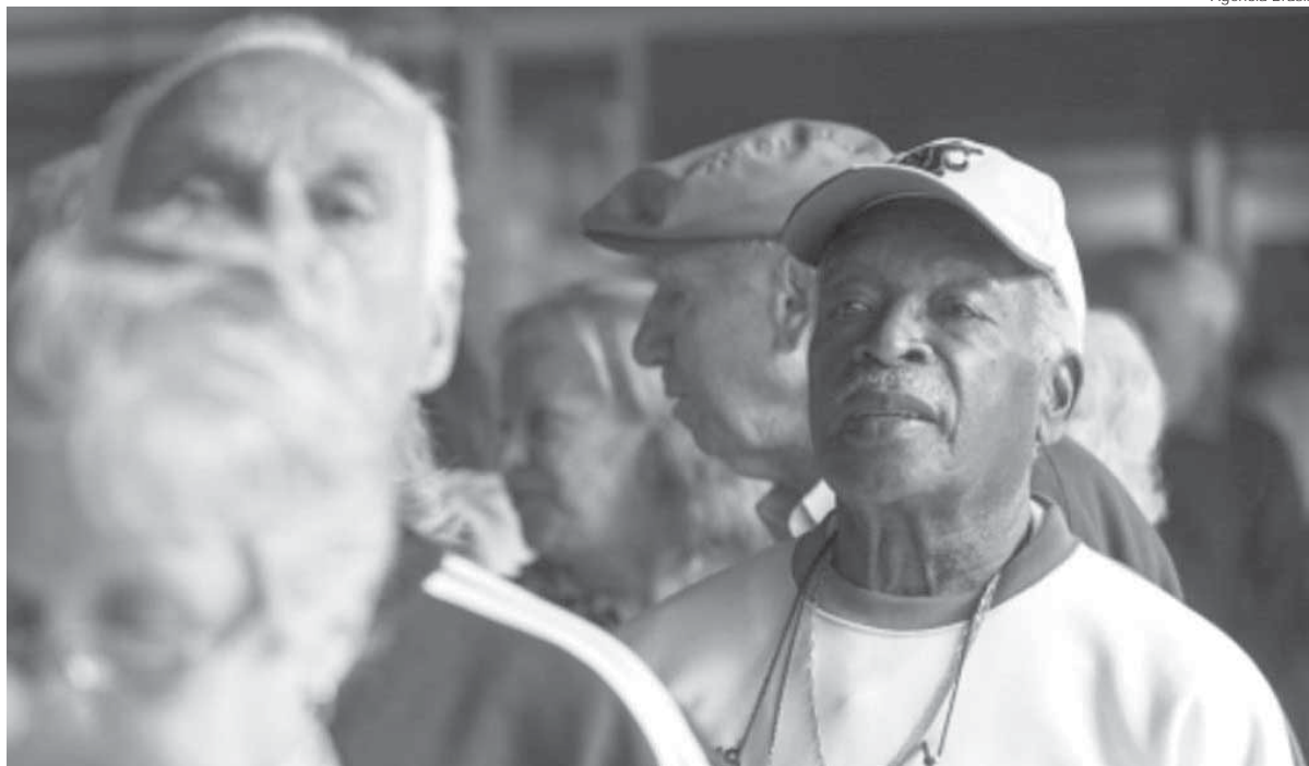
Idosos acima de 70 anos podem fazer o saque do PIS/Pasep a partir da quinta-feira, dia 19

O calendário de saque de recursos das contas do PIS/Pasep para os idosos começa nesta quinta-feira, dia 19. A partir desta data poderão sacar os cotistas com mais de 70 anos.