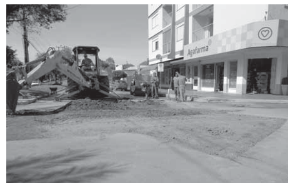
Recuperação do asfalto na Avenida Getúlio Vargas