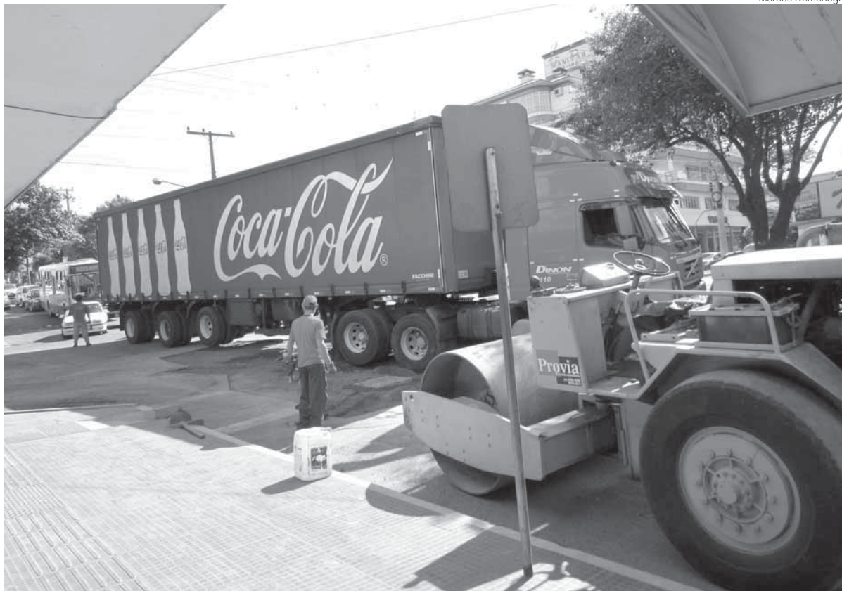
Sem espaço para manobras, caminhão é liberado passar antes do término da operação de conserto

Moradores e comerciantes são afetados por uma sequência de transtornos ocorrida depois do rompimento de uma adutora de água potável localizada na Av. Getúlio Vargas e Rua Sete de Setembro. O primeiro deles foi a falta de água potável no Centro e Zona Sul da cidade, depois a lama no passeio público no amanhecer de sábado, durante todo o dia a poeira e, por fim, o trânsito interrompido para recuperação do asfalto na segunda-feira, dia 16. Além disso, mais um cano se rompeu alguns metros da adutora na Rua Sete de Setembro.