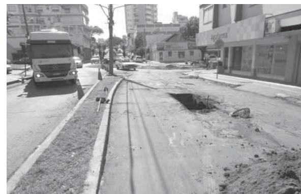
Rompimento na Rua Sete de Setembro