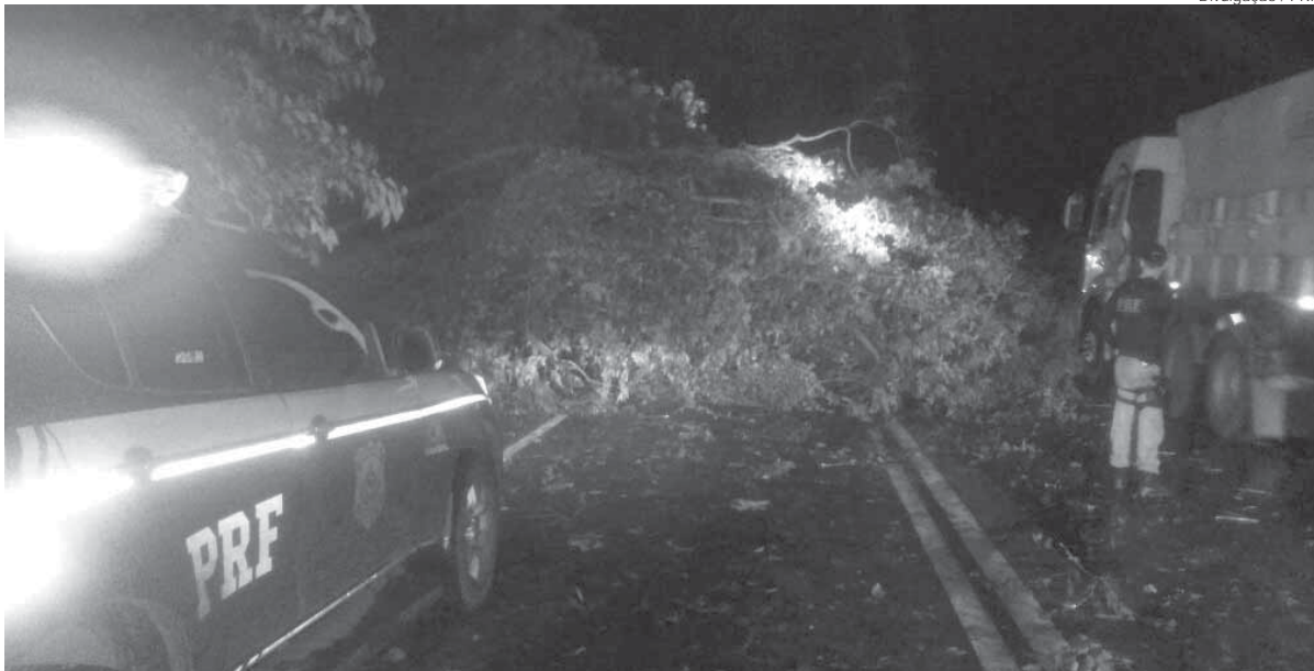
O acidente mais grave ocorreu em Santa Rosa, na quinta-feira, dia 11, na BR 472, quando uma motociclista colidiu em uma árvore que estava sobre a pista em razão do temporal

A Polícia Rodoviária Federal divulgou um balanço das ocorrências atendidas entre os dias 11 e 15 de outubro, durante a Operação 12 de Outubro, referente ao feriado de Nossa Senhora Aparecida. Neste período, a PRF atendeu sete acidentes de trânsito, sendo um com danos materiais e seis com lesões corporais. Além disso, um motorista foi preso por dirigir embriagado e fugir da abordagem em Panambi.