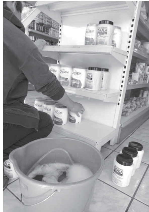
Comerciantes limpam a poeira dos produtos

Enquanto o asfalto era recuperado na segunda-feira, motoristas exercitavam a paciência para contornar o rompimento do fluxo de veículos que naquele ponto já é crítico, mesmo em condições normais. Caminhões maiores não conseguiam realizar conversão para a Rua Sete de Setembro, tendo em vista o pouco espaço para a manobra.