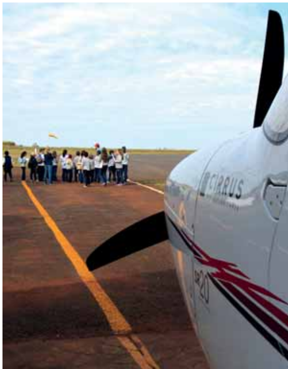
Alunos do Sepé são recebidos no Aero clube de Santo Ângelo

O Aero clube de Santo Ângelo possui sete aeronaves e desde 2011 está homologado para ministrar os cursos teóricos e práticos de voo por instrumento. Possui hangar próprio onde os aviões ficam abrigados e recebe a visitação da comunidade, além de realizar voos panorâmicos.