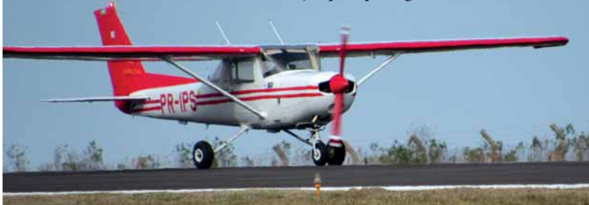
Avião particular pousa na pista do Aeroporto Sepé Tiarajú

Neste domingo o Aero clube de Santo Ângelo está recebendo a comunidade com erva mate, voos panorâmicos e prestando esclarecimentos sobre os cursos de habilitação para pilotagem