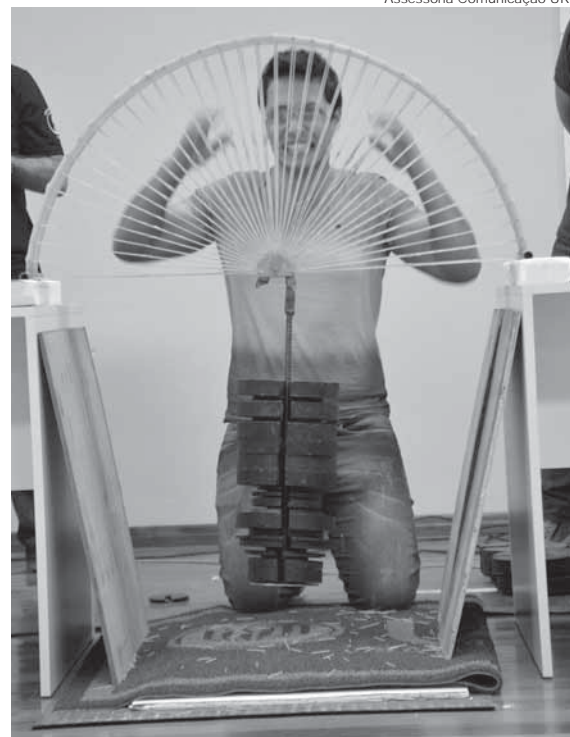
Um total de 11 equipes participaram do desafio "Pontes de Espaguete",