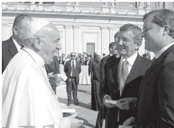
Ministro do Turismo, Marx Beltrão e o deputado Darcísio Perondi encontraram o papa na manhã da última quarta-feira, dia 4