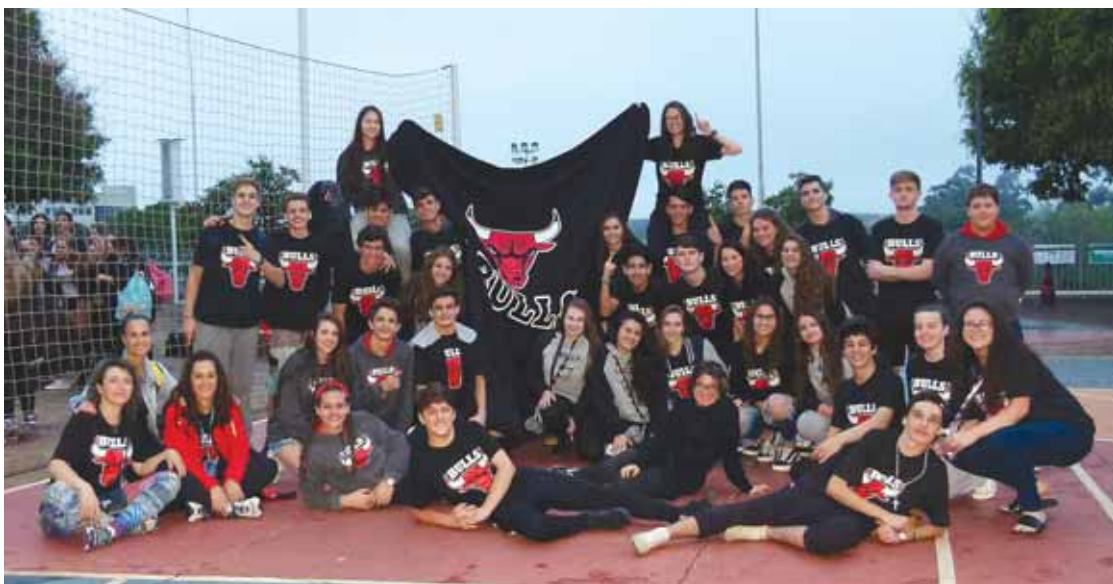
Entre o 9º ano EF e Ensino Médio, a turma 211 foi a campeã