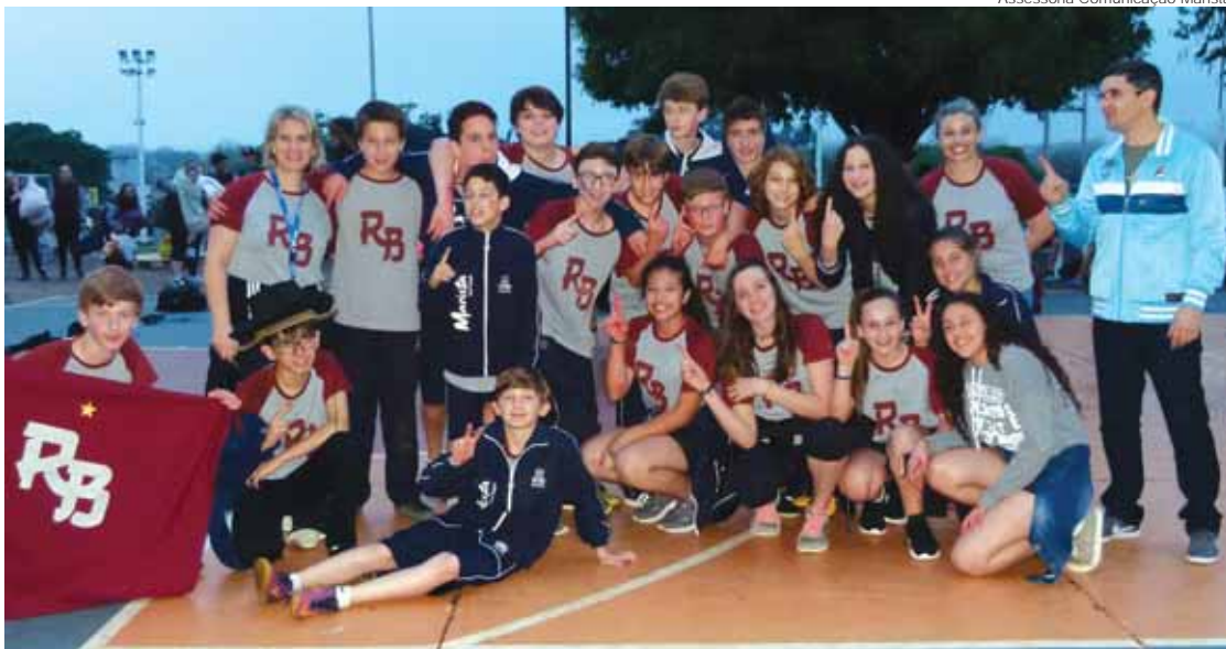
Na categoria 6º a 8º ano EF, o 1º lugar ficou para a turma 72

O evento realizado anualmente pelo Marista Santo Ângelo vai ao encontro da proposta que assegura a formação integral do estudante. Na gincana, são trabalhados os conhecimentos, habilidades, espírito de equipe, protagonismo e liderança por parte dos jovens.