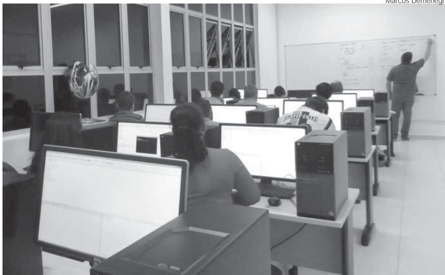
Laboratório de informática no IF Farroupilha

Para realizar a inscrição, o candidato deverá obrigatoriamente ter o número de seu Cadastro de Pessoas Físicas (CPF) e o número da Carteira de Identidade (Registro Geral – RG). Para ter acesso ao curso o candidato faz uma prova que será realizada em 19 de novembro de 2017 das 14h às 18h.