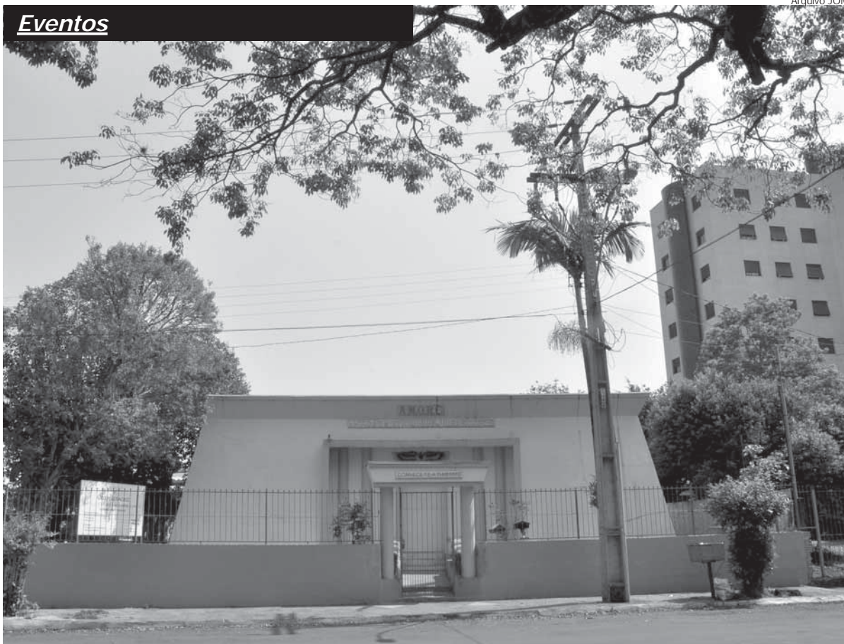
A sede da AMORC está localizada na Rua Florêncio de Abreu 1266, Centro, próximo ao FÓRUM