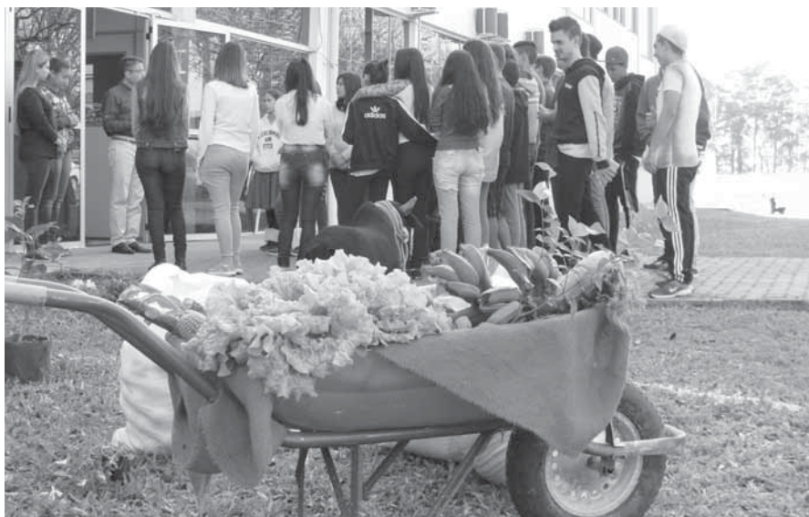
Alunos conhecem a estrutura do IF Farroupilha durante a Carijada