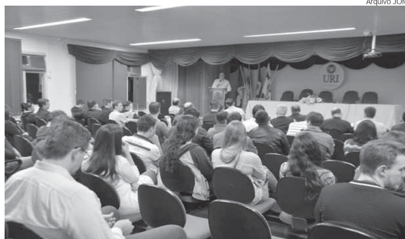
O evento reuniu empresários, professores e acadêmicos da URI Santo Ângelo