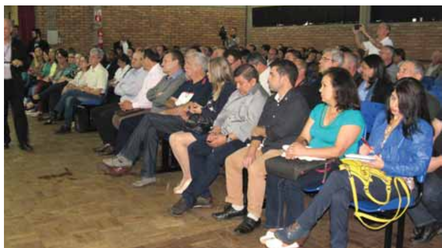
Audiência reuniu prefeitos, empresários e comunidade em geral