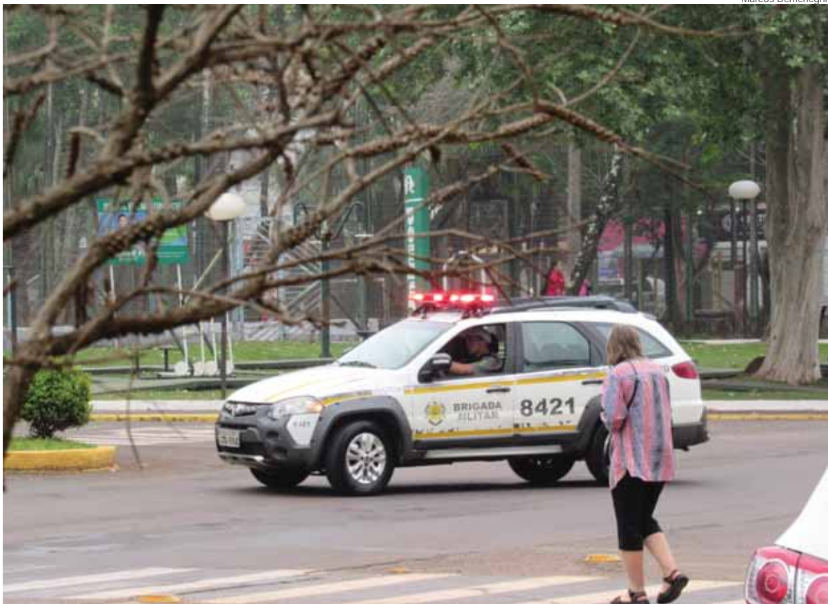
Brigada Militar realizando trabalho de patrulhamento ostensivo