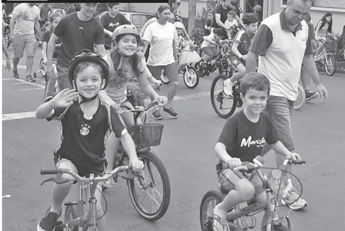
Em 2016, o passeio contou com a participação de 400 ciclistas