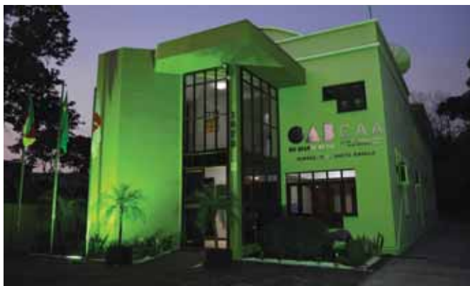
A sede da OAB que está localizada na Av. Brasil e foi inaugurada em 06 de julho de 1998