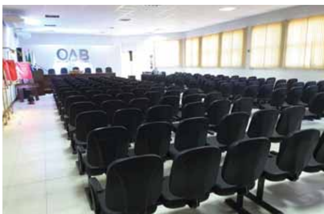
Novo auditório da OAB subseção de Santo Ângelo com capacidade para 186 lugares

A ampliação da sede da Ordem dos Advogados do Brasil, subseção de Santo Ângelo foi concluída. Uma solenidade realizada na última quarta-feira, dia 6, formalizou a entrega do projeto de revitalização que agora conta com oito novos ambientes. A sessão solene foi no novo auditório e reuniu a cúpula da OAB da esfera local, estadual e federal, inclusive o presidente nacional da OAB, Claudio Lamachia prestigiou a conquista dos advogados de Santo Ângelo.