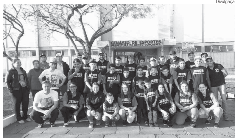
2º Bento Open Kids de Jiu Jitsu aconteceu na cidade de Bento Gonçalves no último dia 3