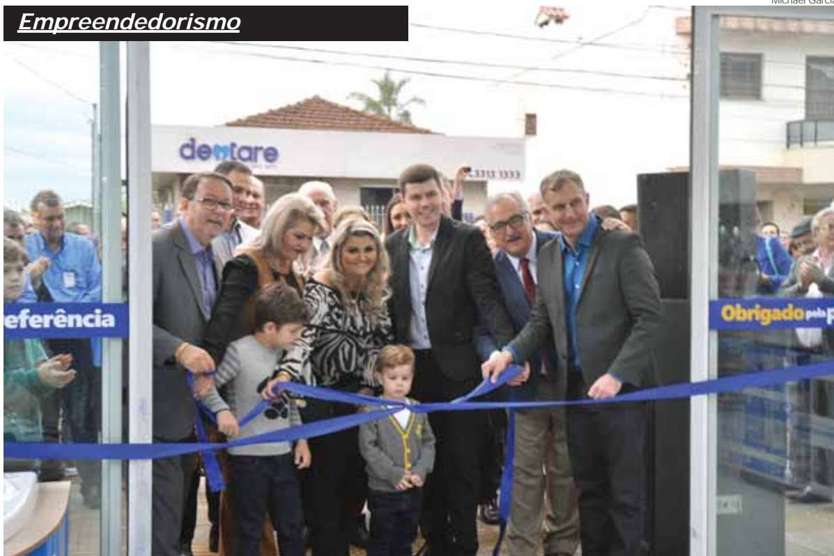
Desenlace da fita inaugural marcou a abertura oficial da nova loja que fica na Rua Marechal Floriano, 1896