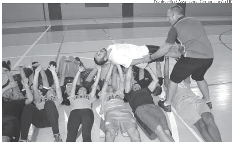
Semana Acadêmica contou com oficinas e atividades que mobilizaram acadêmicos, professores e convidados

Na terça-feira dia 29, aconteceram as apresentações de trabalhos na Mostra de Pesquisa, Ensino e Extensão do curso de