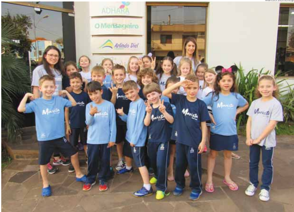
Alunos da turma 11 em frente ao prédio do Jornal O Mensageiro e da Gráfica Adhara