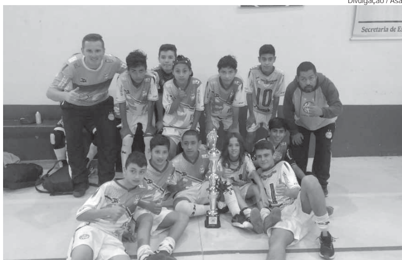
Equipe Sub-13 recebeu a premiação de Campeã do torneio