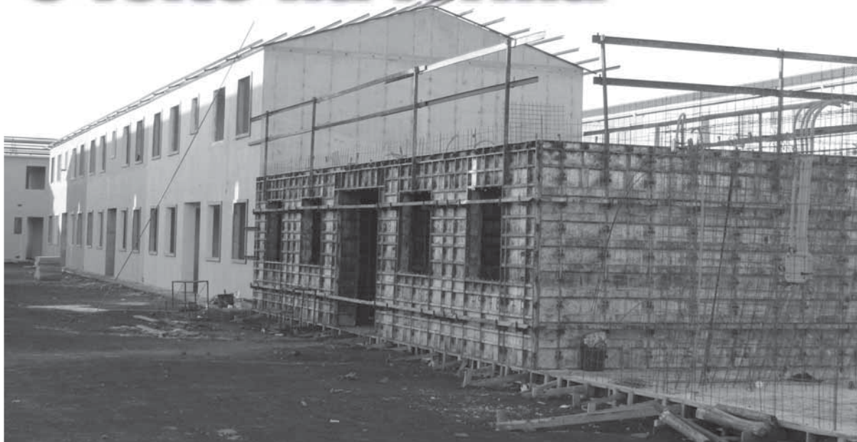
Formas prontas para receber o concreto. Antes disso, uma estrutura de barras de ferro é montada com a tubulação de água e energia

Empresa santo-angelense utiliza um método construtivo que usa concreto auto adensável diretamente em formas metálicas pré-moldadas. As paredes dos apartamentos são concretados com um dia de trabalho de 25 operários