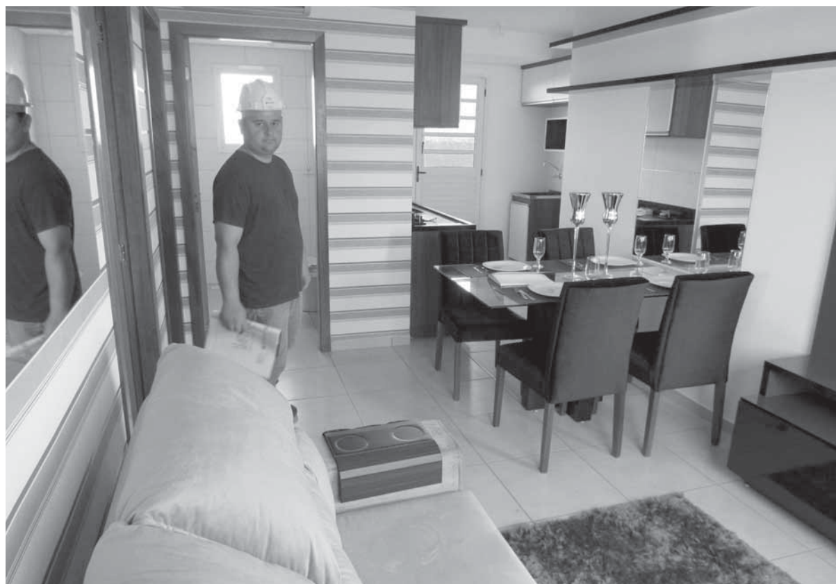
Unidade mobiliada, cada apartamento é composto de sala, cozinha e lavanderia conjugadas, dois quartos e banheiro, são 46m 2

Um dos apartamentos, já está com o acabamento pronto e mobiliado, o projeto de interior desta unidade foi planejado em parceria com uma empresa do ramo de Santo Ângelo e colabora com as vendas do condomínio, pois o cliente já tem a noção de como é possível otimizar o espaço conforme as necessidades de uma família.