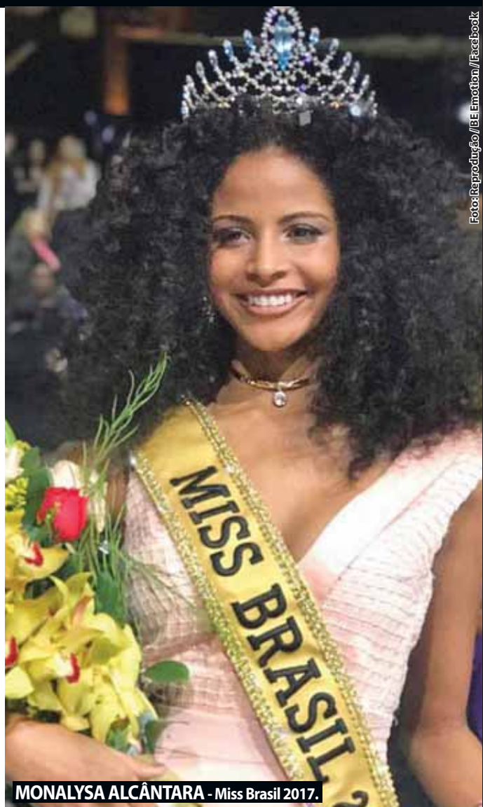
MONALYSA ALCÂNTARA - Miss Brasil 2017.

Já no início do seu reinado, Monalysa deixou seu recado: "Quero dar voz para as mulheres e não vou aceitar ver nenhuma delas dizendo que não é capaz. Me chamavam de feia e hoje eu represento a beleza brasileira", finalizou.