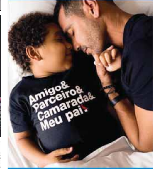
Rua Marquês do Herval, 1315 - (55) 3312.4106 | 3312-3070 Rua Marquês do Herval, 1340 - (55) 3312-3714 - Santo Ângelo/RS