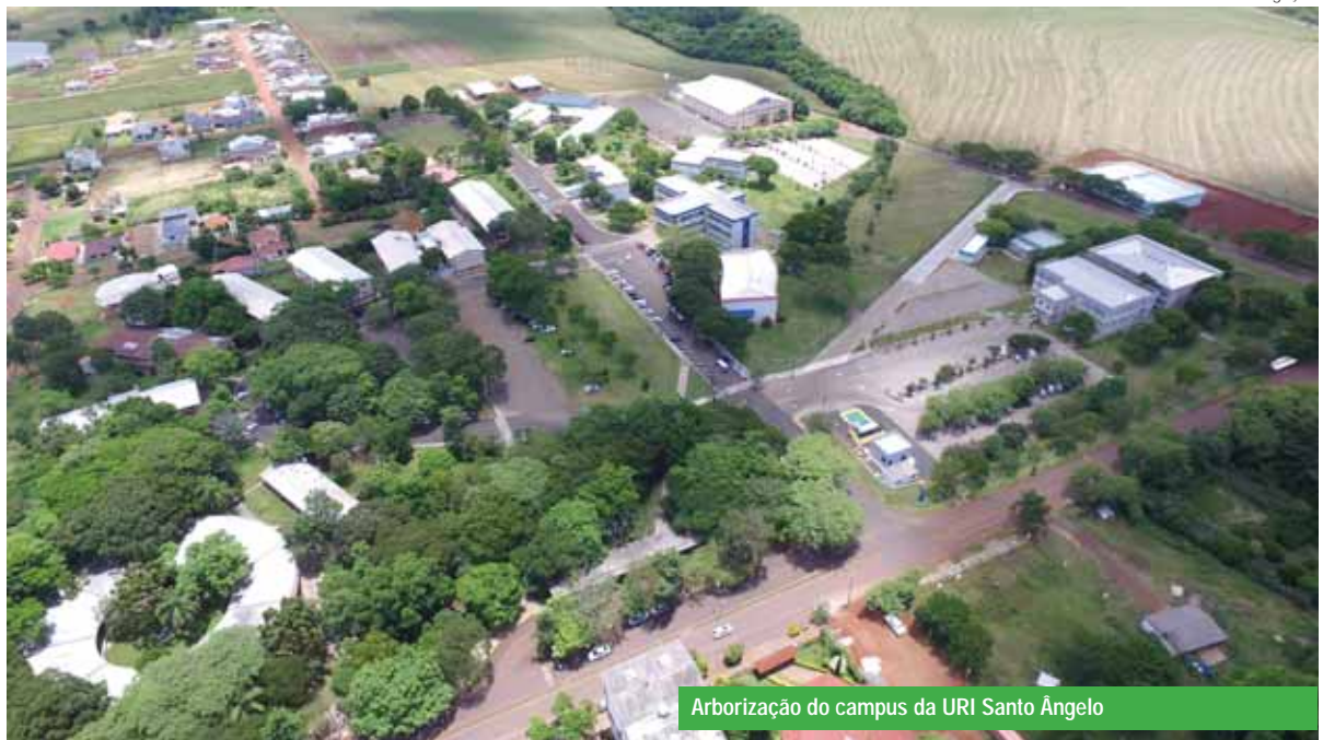
Arborização do campus da URI Santo Ângelo