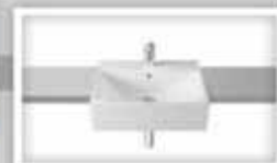
Cuba de semiencaixe - Roca DIVERTA Medidas: 50x45x16,5cm R$ 599,90