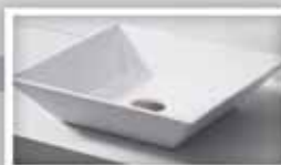
Cuba de apoio - Petra PELLA Medidas: 41,5X41,5X13cm R$ 349,90