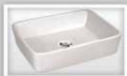
Cuba de apoio - Petra ATHENAS Medidas: 48X38X13cm R$ 349,90

f Piattra Acabamentos www.piattra.com.br