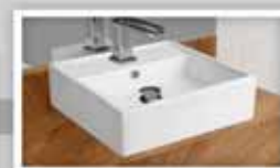
Cuba de apoio - Petra ROMA Medidas: 47X47X16,5cm R$ 449,90