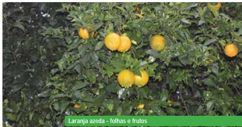
Laranja azeda - folhas e frutos

interessante como alternativa para promover a saúde e a qualidade de vida daquela comunidade. Por outro lado, nos deparamos com diversos problemas na infraestrutura do local: calçadas defeituosas, lixo espalhado no interior da praça, falta de lixeiras, guarita de posto policial desativado, parquinho em más condições de uso, quadra de esportes com pouca areia e ausência de banheiros. Após caracterizar este local, desafiamos os leitores para que desfrutem deste espaço que a praça oferece onde também poderá saborear os inúmeros frutos das várias espécies de plantas aqui relatadas e auxiliar de modo a preservar e até revitalizar tal ambiente.