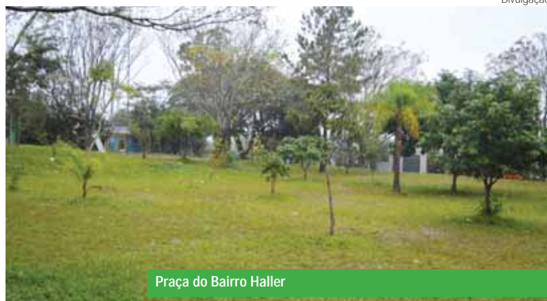
Praça do Bairro Haller