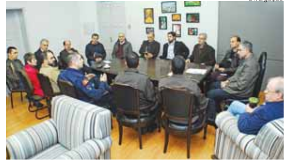
Reunião do Gabinete de Gestão Integrada Municipal de Segurança Pública

Foram retomados os encontros do Gabinete de Gestão Integrada Municipal de Segurança Pública (GGI-M). A reunião que marcou o reinício das atividades foi realizada na sexta-feira, dia 2, conduzida pelo prefeito Jacques Barbosa e pelo vice-prefeito Bruno Hesse, com a presença de um colegiado de autoridades representado os órgãos da segurança pública de Santo Ângelo.