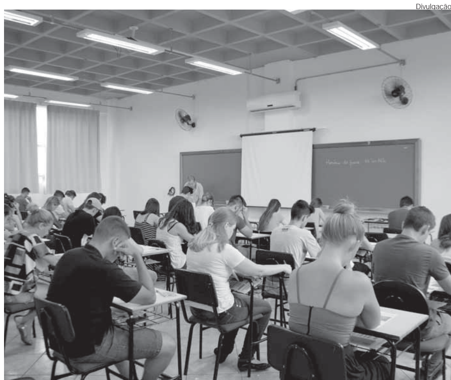
Prova será aplicada no próximo dia 11, um domingo, das 14h às 18h