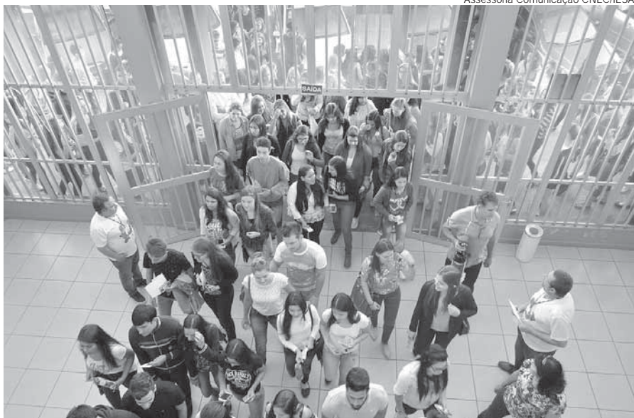
A prova está agendada para o dia 2 de julho

As inscrições para o Vestibular da CNEC/IESA podem ser feitas até o dia 30 de junho, no site www.cnecsan.cnec.br , no valor de R$ 30,00. Nesta edição, serão oferecidas 375 vagas para oito cursos de graduação. Além dos já tradicionais cursos de Administração, Biomedicina, Ciências Contábeis, Direito, Fisioterapia e Pedagogia, foram disponibilizadas vagas para os novos cursos de Tecnologia em Análise e Desenvolvimento de Sistemas e Sistemas para Internet. Neste processo seletivo, 20% das vagas são reservadas para o ENEM.