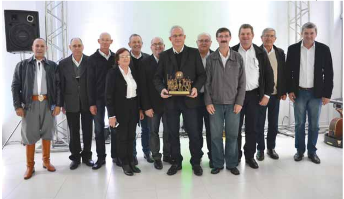
Conselho de Administração da Sicredi União RS homenageou Dall'Agnese

A área de atuação da Sicredi União RS abrange 39 municípios da região Noroeste/Missões do estado. São mais de 140 mil associados e 600 colaboradores trabalhando diariamente para o de-