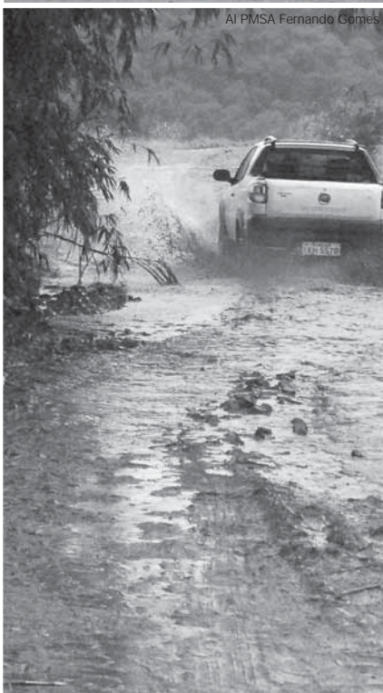
Chuvarrada causou estragos em ruas da cidade e estradas da zona rural