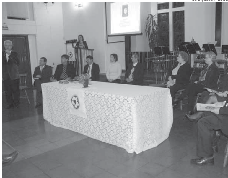
Lançamento aconteceu na última quinta-feira, dia 18, na Igreja do Relógio