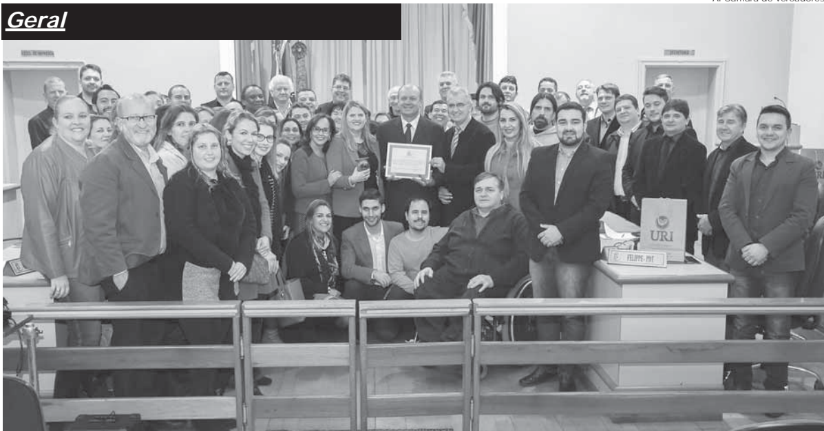
Sessão Solene aconteceu na última segunda-feira, dia 23, na Câmara de Vereadores