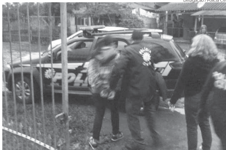
Operação cumpriu mandados de prisão em cidades da região