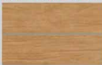
Porcelanato Ecofloor Carvalho 24,5 x 100cm Retificado Acetinado 4 faces R$ 69,90 m²