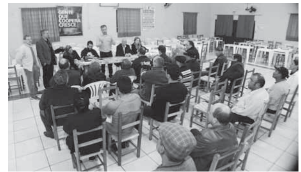
Participaram da reunião lideranças de doze bairros