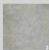
1 Porcelanato Tivoli Acetinado Retificado 2 faces R$ 39,90 m²