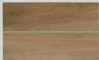
Porcelanato Vivenda 24,5 x 100cm Retificado Acetinado 10 faces R$ 64,90 m²