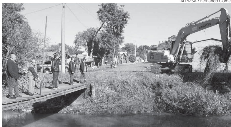
Dragagem vem sendo feita gradativamente pela prefeitura municipal em rios, córregos e canais para evitar alagamentos em bairros da cidade