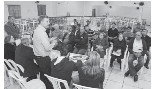
A audiência pública foi realizada no Clube da Terceira Idade Roda de Chimarrão do Bairro Pippi

O prefeito também falou sobre a abertura da Unidade de Pronto Atendimento (UPA) do Bairro Pippi, reafirmou o compromisso de colocá-la em funcionamento e anunciou o processo de licitação, orçado em R$ 60 mil, para a reforma do prédio, enquanto técnicos da Secretaria Municipal da Saúde avaliam os equipamentos. “É um compromisso de governo e vamos honrá-lo. Porém, precisamos seguir todos os trâmites legais”, assinalou Jacques.