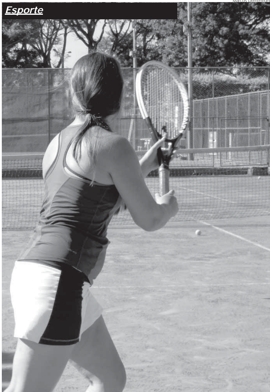
Tenista treina nas quadras do Clube 28 de Maio