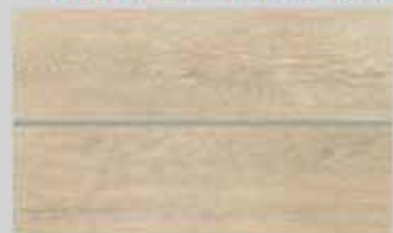
Porcelanato Laminata Amêndola 24,5 x 100cm Retificado Acetinado 8 faces R$ 59,90 m²

Não deixe de aproveitar a última semana de promoções do mês do trabalhador. Porcelanatos Villagres com descontos imperdíveis para você cliente Piattr.