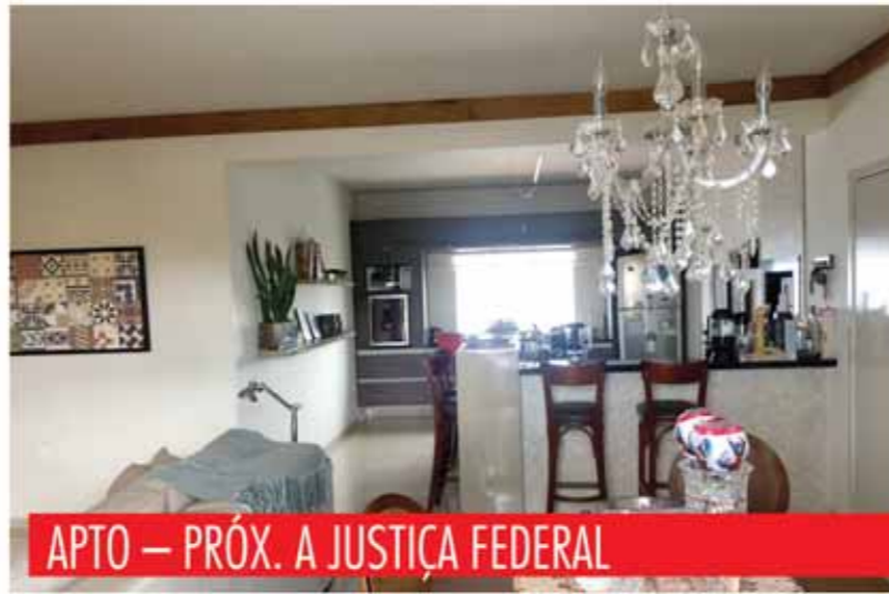
APTO — PRÓX. A JUSTIÇA FEDERAL

2 dormitórios, 1 suíte, 3 banheiros, área de serviço, cozinha, dep. empregada, sacada, sala de estar com lareira, sala de visita, churrasqueira. R$ 580.000,00