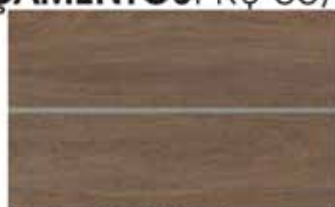
Porcelanato Porto 24,5 x 100cm Retificado Acetinado