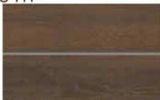
Porcelanato Brown Oak 24,5 x 100cm Retificado Acetinado