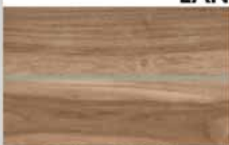
Porcelanato Nogueira 24,5 x 100cm Retificado Acetinado com relevo