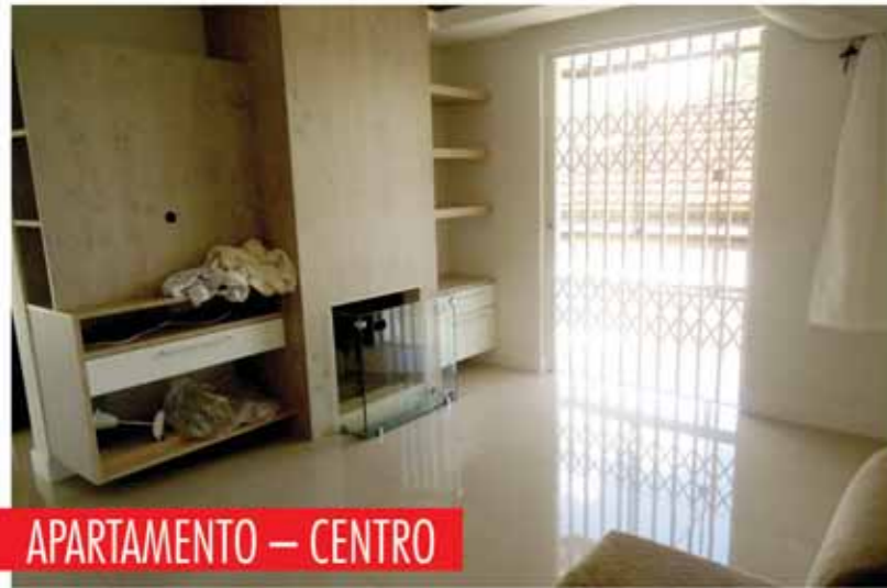
APARTAMENTO — CENTRO

2 dormitórios, 1 suíte, 3 banheiros, área de serviço, cozinha, dep. empregada, sacada, sala de estar com lareira, sala de visita, churrasqueira. R$ 580.000,00