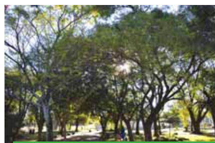
Interior da praça, observa-se um ambiente bem sombreado com diversos angicos e araçás