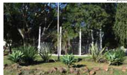
Jardim da entrada da praça e quadra esportiva