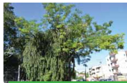
Cinamomo ( Melia azedarach ) com hemiparasita do gênero Tripodanthus sp. (Erva-de-passarinho) que se liga através das raízes ao hospedeiro assim extraíndo minerais e água do mesmo - faz fotossíntese e por isso não depende totalmente do hospedeiro