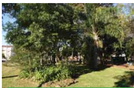
Entrada da praça, observa-se 3 estratos, o arbóreo, o arbustivo e o herbáceo