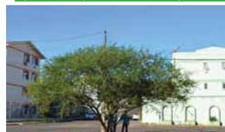
Espinillo ( Vachellia caven )