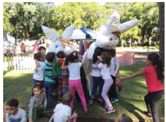
Vila do Coelho estará aberta para visitação neste sábado, das 15h30min às 18h30min

A visitação estará aberta às escolas e à população no sábado, das 15h30min às 18h30min.