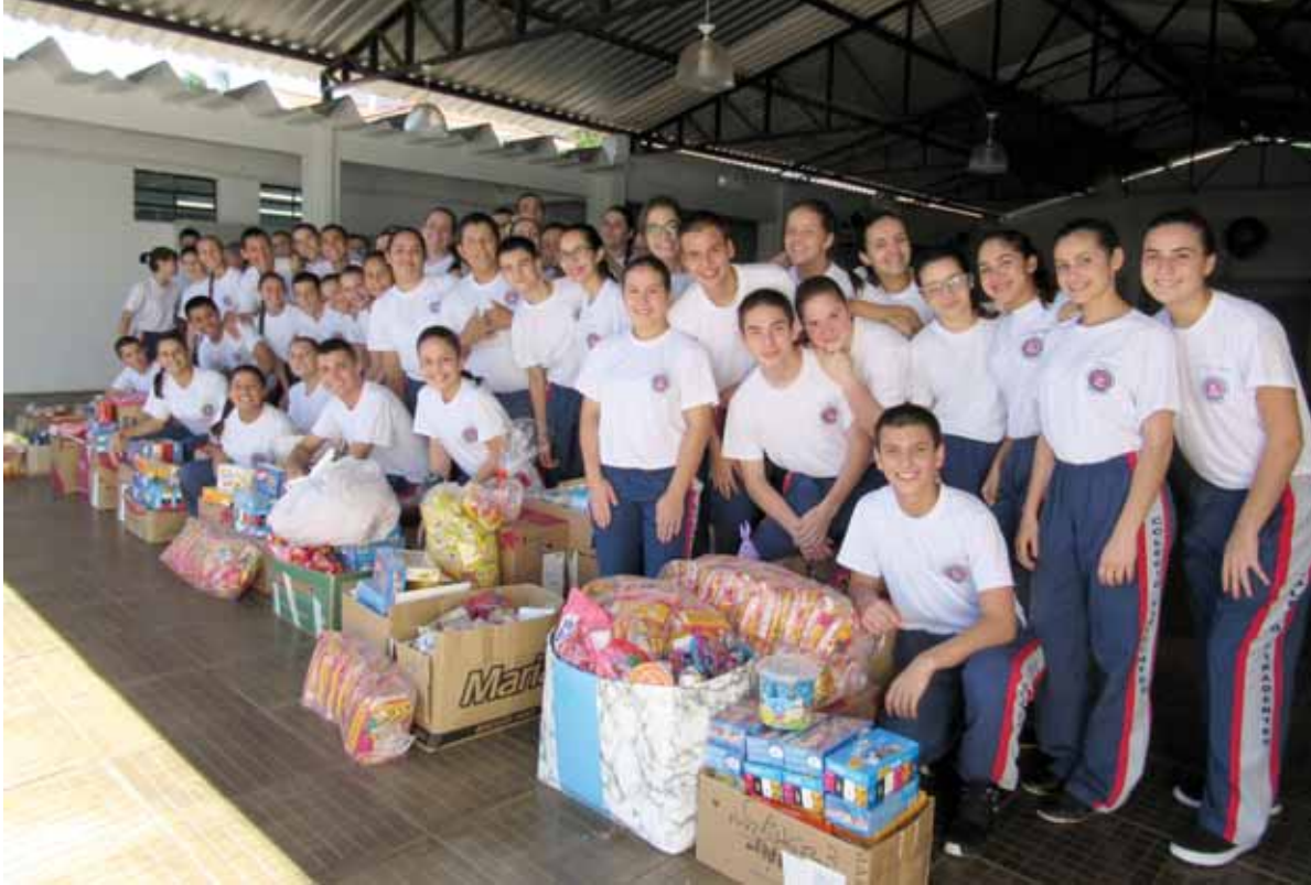
Alunos dos primeiros anos do Colégio Tiradentes arrecadaram 4300 unidades de doces

Alunos dos primeiros anos do Tiradentes lideraram uma ação que resultou na arrecadação de 4300 doces que foram doados à alunos de sete escolas de educação infantil em Santo Ângelo