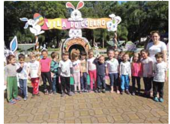
Na tarde da terça-feira, dia 11, escolas visitaram a Vila do Coelho na Praça da Catedral

A tarde de terça-feira, dia 11, foi agitada na “Vila do Coelho”. A estrutura foi montada junto ao Centro Histórico de Santo Ângelo em homenagem à Páscoa. O local recebeu a visita de mais de uma centena de crianças de escolas de educação infantil públicas e privadas, além de integrantes dos projetos sociais desenvolvidos pela Secretaria Municipal de Assistência Social, Trabalho e Cidadania.