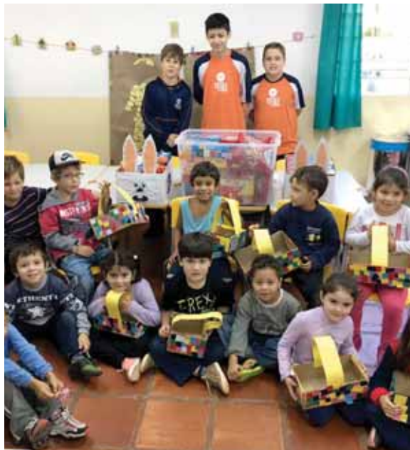
Crianças da rede pública de ensino recebem representantes dos alunos da Escola da URI

As escolas beneficiadas foram: Escola Estadual de Ensino Fundamental Dr. Sparta de Souza; Escola Municipal Gildo Castelarim; Escola Municipal Ensino Fundamental Miguel Bosniak; Escola Estadual de 1º Grau Abílio Lautert; Escola Municipal Educacional Inf Professora Venir Terezinha Damiao; Creche Munic Dr Theodomiro Luciano de Souza.