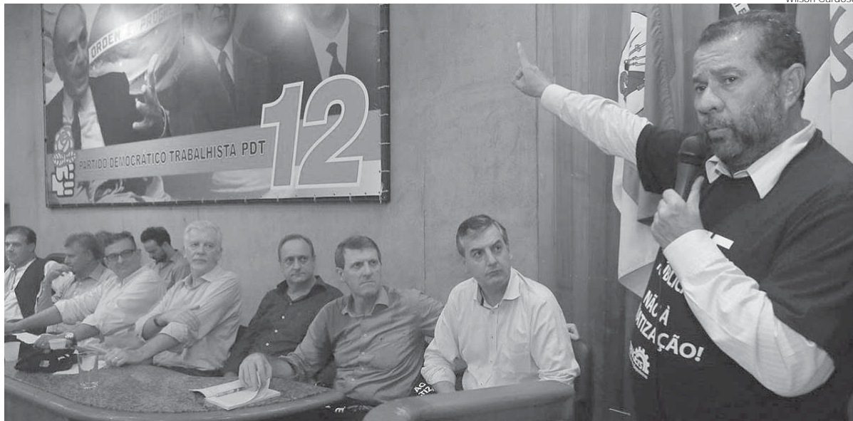
Lupi veio ao Rio Grande do Sul, participa de saída pedetista do Governo do Estado e evoca independência para levar o partido em sua essência às urnas

O presidente nacional do PDT, Carlos Lupi, participou de várias reuniões partidárias em Porto Alegre. O principal tema em pauta foi a saída do partido da base do governo Sartori (PMDB). O dia contou também com um ato de filiação realizado na sede do PDT do Rio Grande do Sul. A maioria dos novos pedetistas chegou à legenda inspirados por Jairo Jorge, recém-filiado ao partido e já bem cotado para a corrida ao Palácio do Piratini.