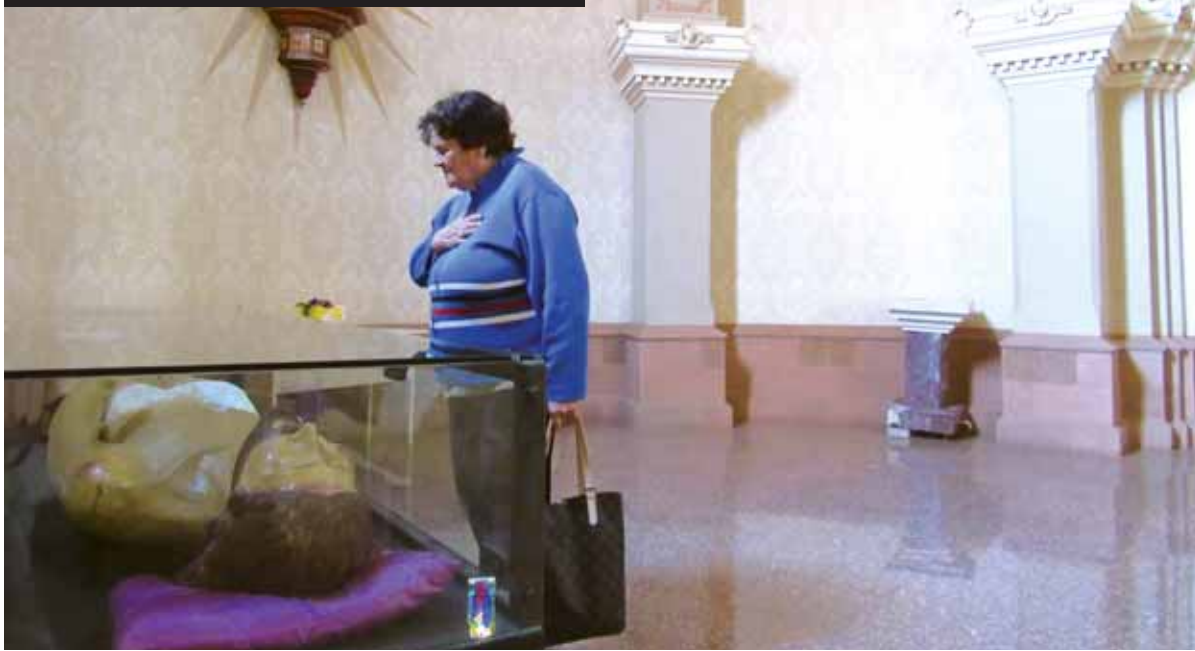
Escultura do Cristo Morto será carregada por fiéis católicos durante a procissão, um tradicional ato fé no município