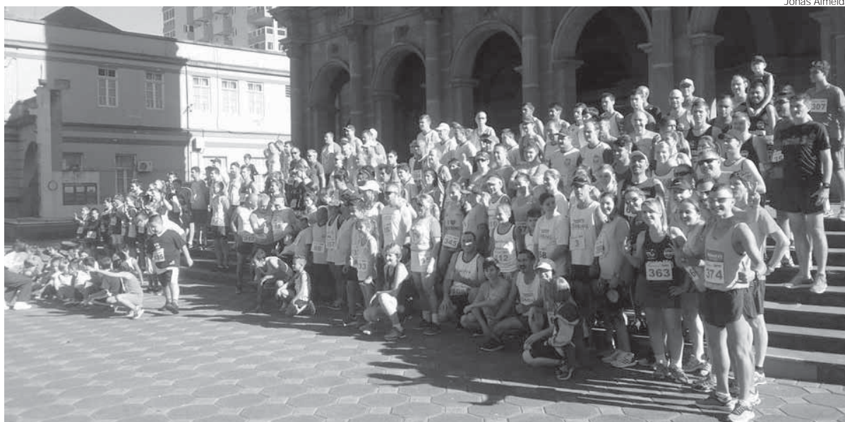
Evento aconteceu no último domingo, dia 2, mesmo dia em que foi comemorado o Dia Mundial da Conscientização do Autismo

No último domingo, dia 2, foi comemorado o Dia Mundial da Conscientização do Autismo e Santo Ângelo tornou-se pioneira na realização de uma competição envolvendo atletas com o distúrbio, familiares e corredores.