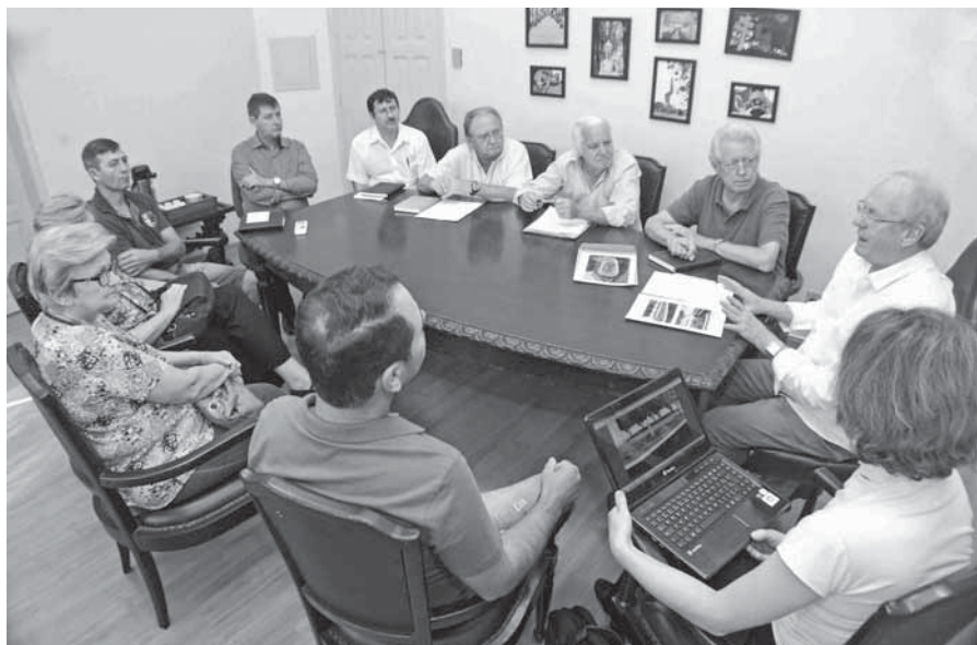
Membros das igrejas de Confissão Luterana no Brasil foram recebidos pela Administração