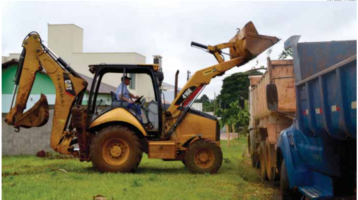
Equipes da Prefeitura Municipal estarão nos bairros Santo Antônio, Rosenthal e São João realizando ações

Na quinta-feira, dia 06, o prefeito acompanhará os secretários municipais na execução dos serviços e, logo em seguida, retoma a sua agenda no gabinete. Na reunião com a equipe