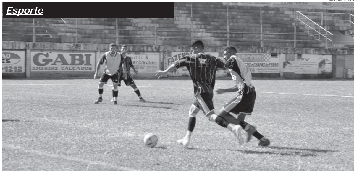
Durante as últimas semanas jogadores treinaram no Estádio da Zona Sul, visando a preparação para o início da competição