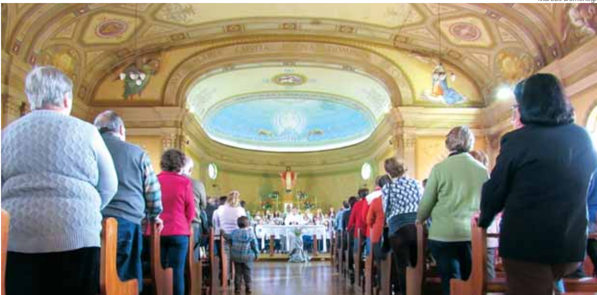
Capela Teresa Verzeri em celebração realizada no dia dos avós. Crianças e famílias presentes em julho de 2016