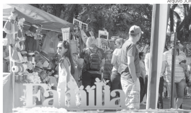
Brique da Praça reúne famílias e a comunidade em geral todos os domingos na Praça Leônidas Ribas

Além da presença do músico, o Brique contará com os tradicionais expositores e proporcionará a integração da comunidade santo-angelense na manhã de domingo.