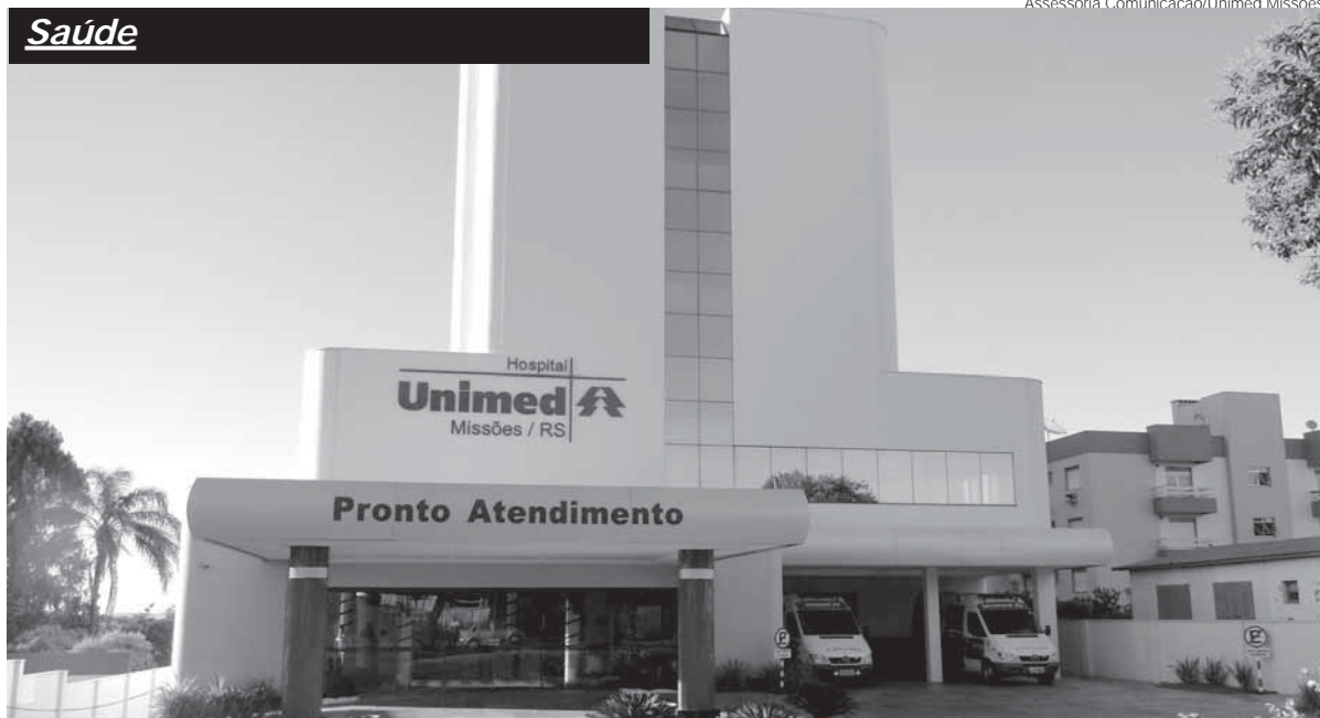
Hospital Regional da Unimed Missões na Zona Sul de Santo Ângelo