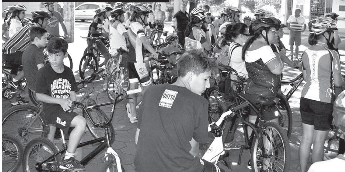
Passeio ciclístico teve a largada no Centro Histórico Municipal