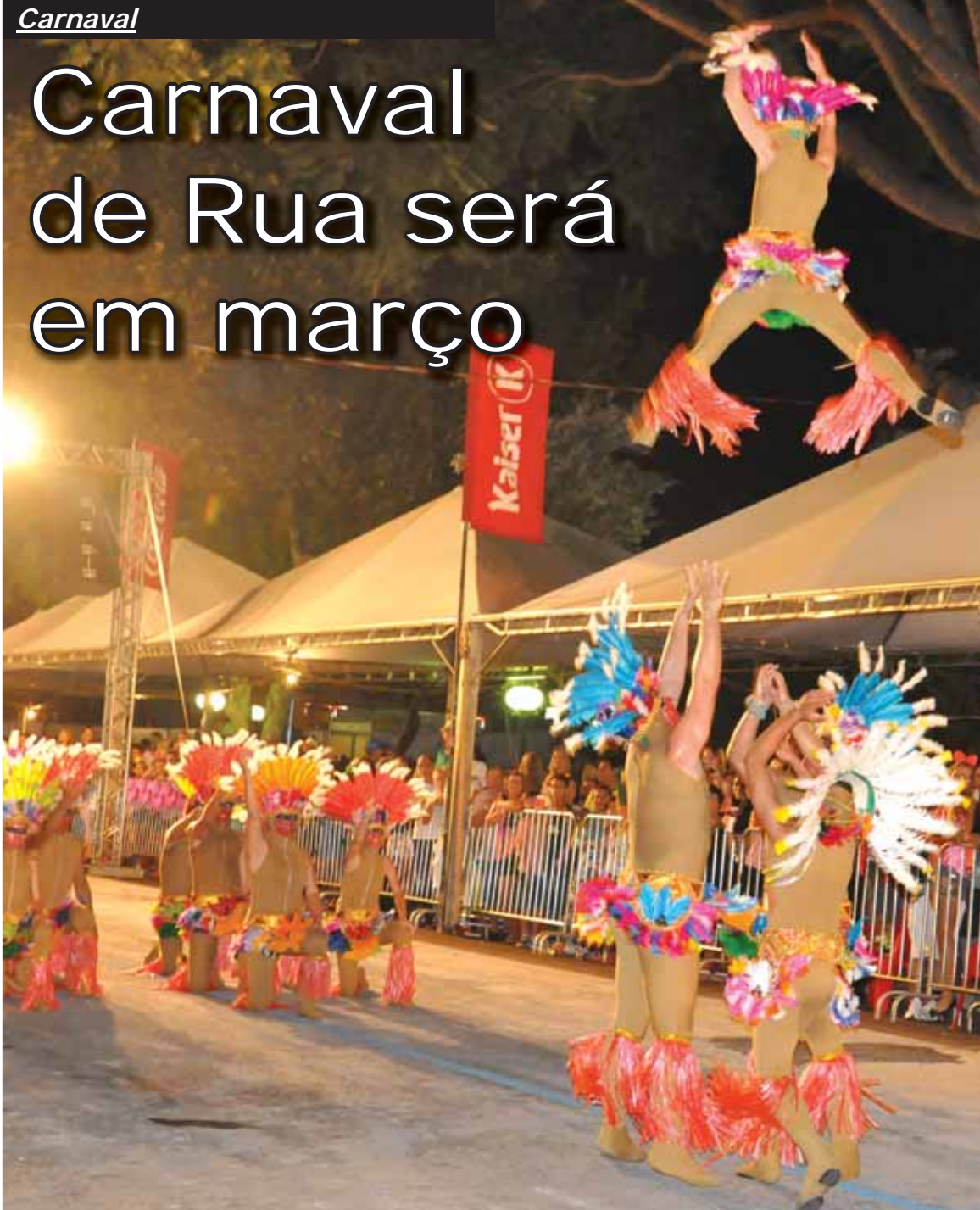
Escolas de samba desfilam na Av. Venâncio Aires em Santo Ângelo

Depois de um ano sem carnaval de rua em Santo Ângelo a Administração Municipal e a Liga das Escolas de Samba farão um carnaval de retomada no dia 25 de março. Os detalhes do evento serão anunciados na próxima quarta-feira, dia 1º