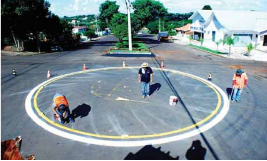
Rotatória foi instalada no local com o objetivo de melhorar o tráfego de veículos em ambas as vias