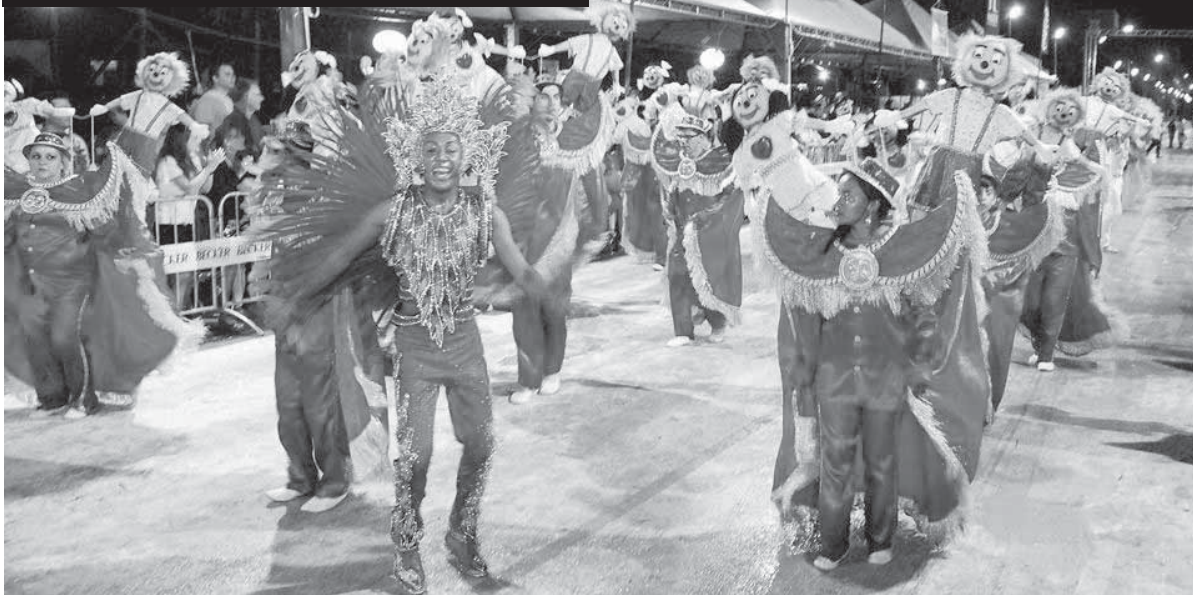
Festa momesca mais uma vez é cancelada em Santo Ângelo