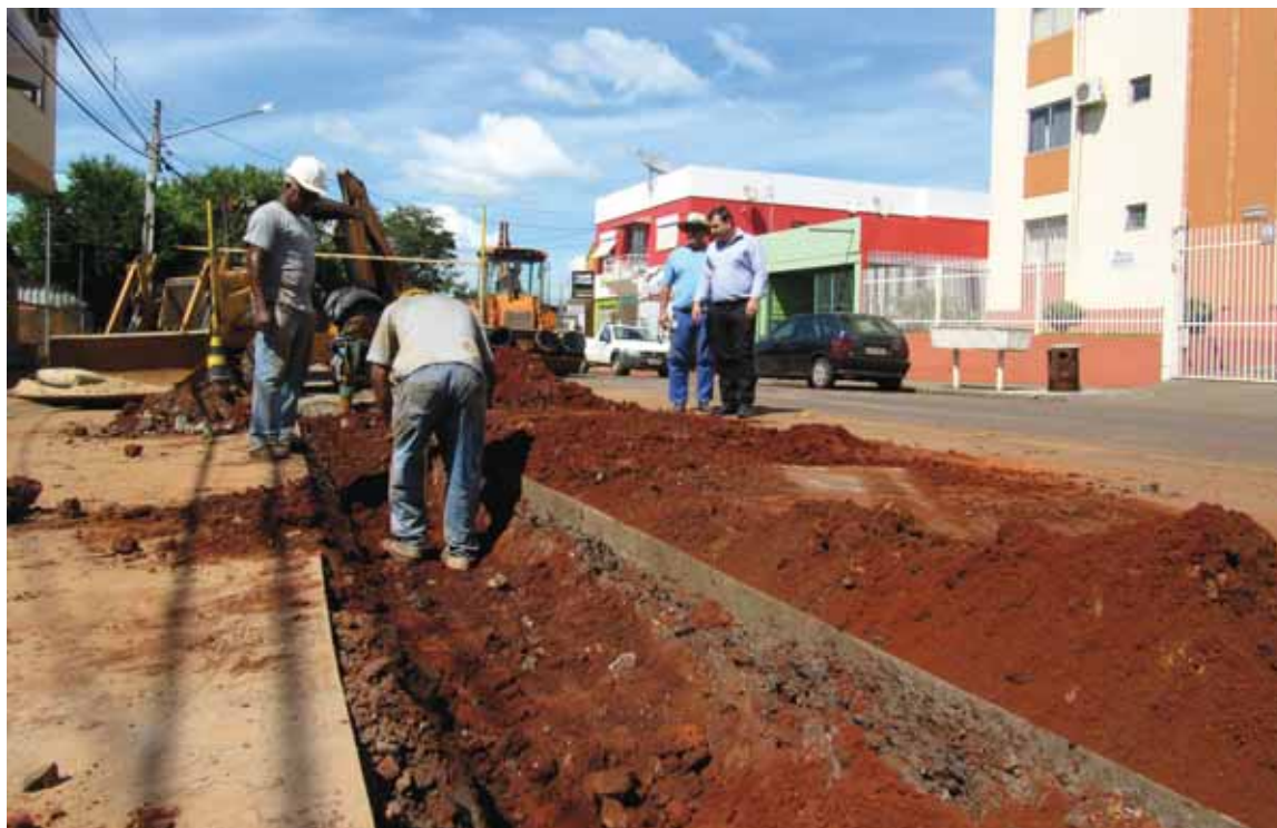
Ampliação da rede de esgoto na Rua 15 de Novembro, previsão de reposição do asfalto em 20 dias

Foram iniciadas nesta semana as novas redes de esgoto sanitário do PAC – Programa de Aceleração do Crescimento no Bairro Menges. A Corsan pretende levar rede de esgoto sanitário a famílias que não possuíam o serviço em Santo Ângelo. A primeira licitação está orçada em aproximadamente R$ 2,8 milhões e faz parte de um conjunto total de obras que pretende implantar rede de esgoto capaz de alcançar 51% de toda a população desassistida deste serviço no município. No contexto geral do projeto aprovado serão investidos R$ 31 milhões.