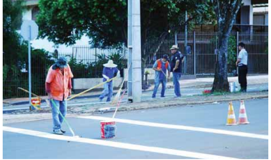
Além da rotatória foi feita a colocações de redutores de velocidade, pinturas e sinalizações

Nesta semana, teve início as obras de ordenamento do tráfego no cruzamento das avenidas Venâncio Aires e Rio Grande do Sul, com a instalação de uma rotatória, redutores de velocidade, sinalização viária e estreitamento de pista. Segundo a prefeitura municipal, as obras devem ficar prontas no início da próxima semana e buscam dar mais segurança para motoristas e pedestres em virtude do tráfego intenso, principalmente em horários de pico.