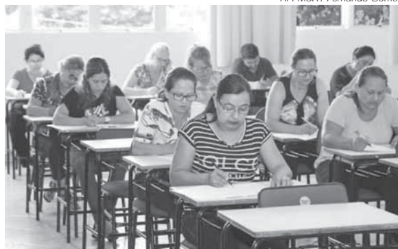
Publicação do resultado preliminar está marcada para o dia 17 e o prazo para recursos nos dias 20 e 21 deste mês

Com o novo edital, a publicação do resultado preliminar está marcada para o dia 17 e o prazo para recursos nos dias 20 e 21 deste mês, e a publicação do resultado final prevista para o próximo dia 24.