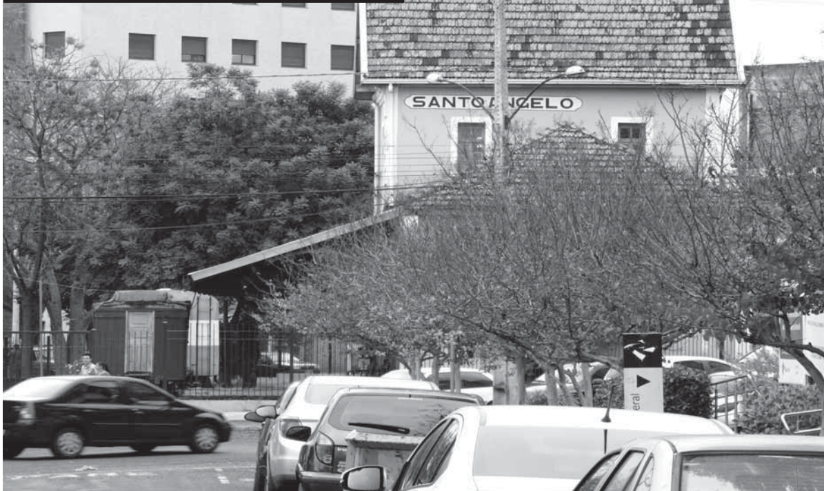
Turismo comercial local e regional será debatido durante a 3ª edição do Café &amp; Negócios