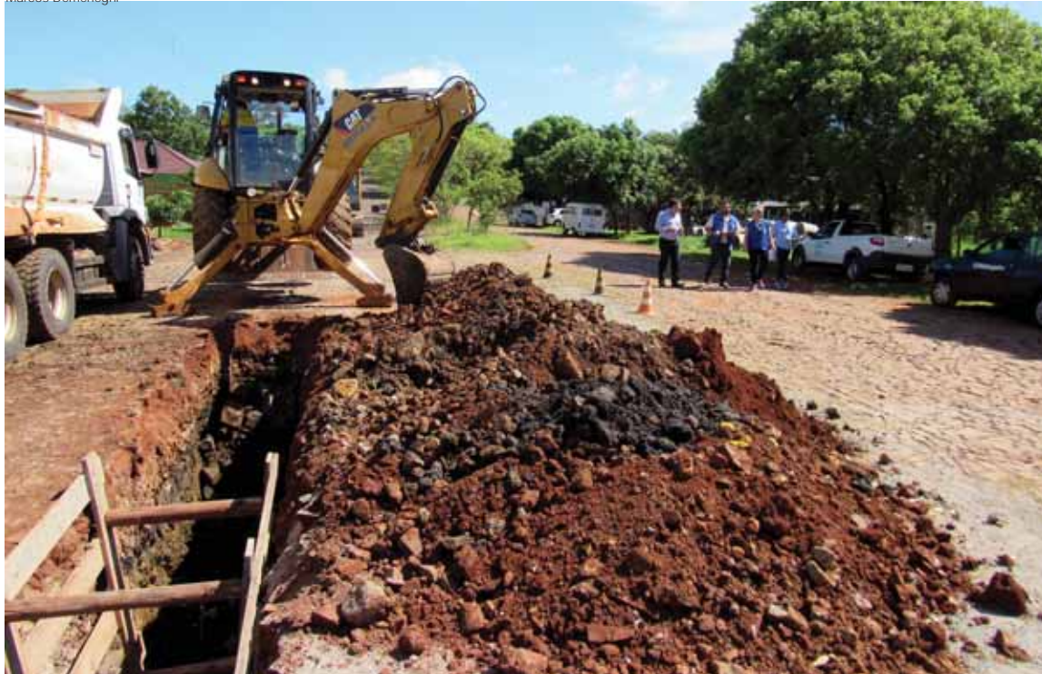
Na Rua Gen Carlos de Campos Gay uma equipe de obras abre a vala em solo rochoso para implantação da rede coletora no Bairro Menges. Assistentes sociais realizaram visita aos moradores para falar sobre a obra