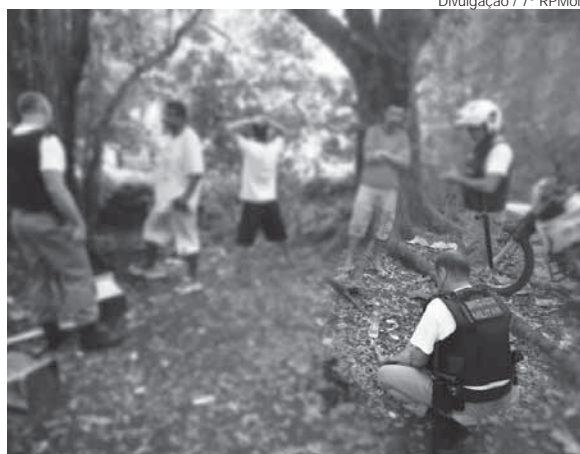
Durante a Operação, a Brigada Militar abordou e identificou mais de 90 pessoas

A Operação Avante é uma ação da Brigada Militar que visa através da saturação de área e de emprego do efetivo de forma sistematizada coibir e prevenir delitos.