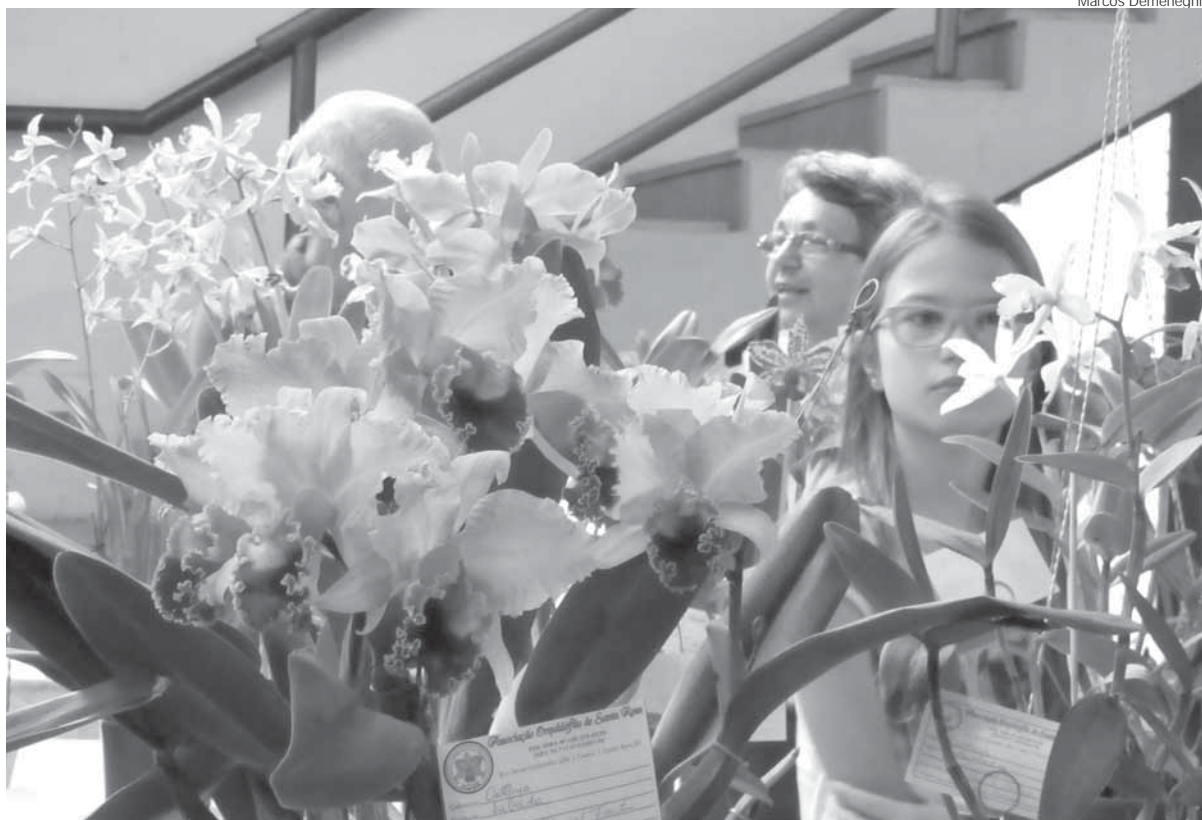
Durante o evento haverá o tradicional concurso de orquídeas

O evento será aberto oficialmente no dia 18 de março, às 10 horas, porém a visitação estará libera-