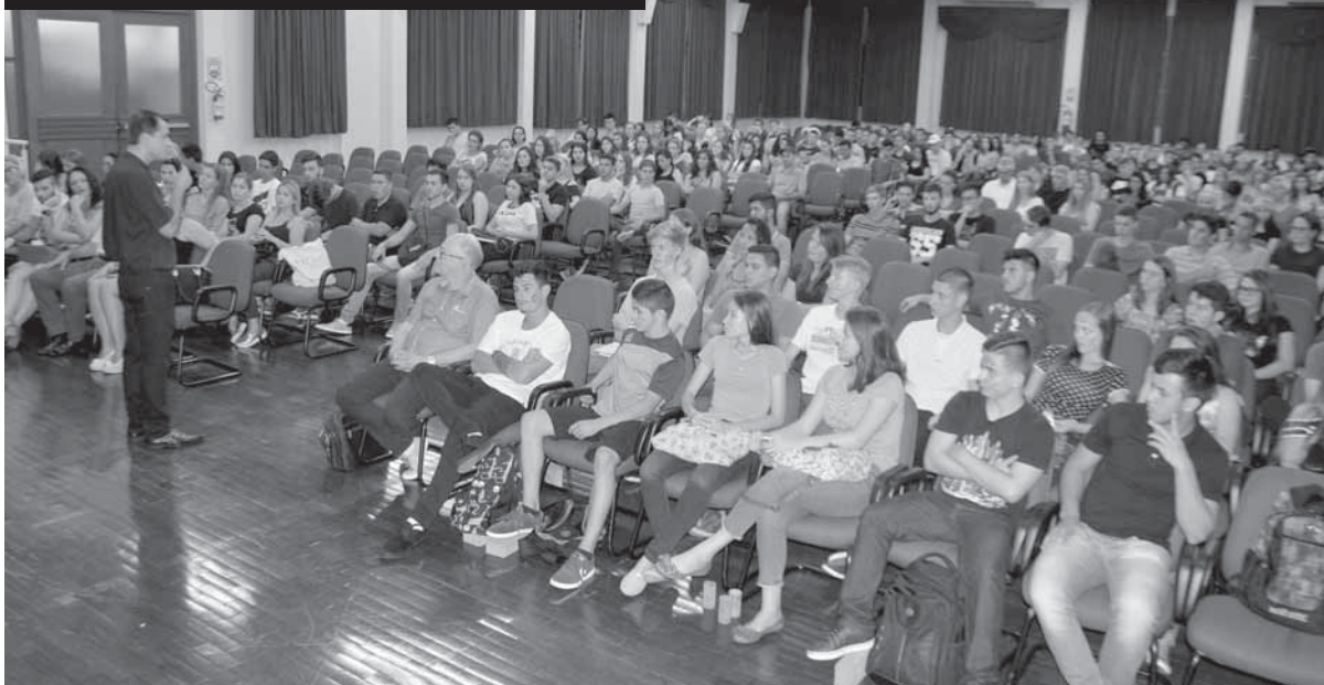
Calouros receberam as boas vindas no auditório do prédio 13 e em seguida assistiram uma encenação teatral