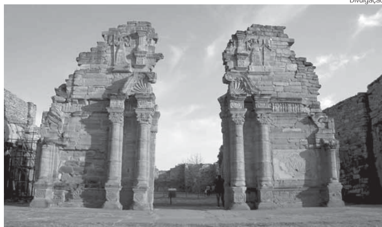
San Ignacio Mini - Ruínas das Missões Jesuíticas Guarani em Misiones

O Setor de Promoção Comercial (SECOM) da Embaixada do Brasil em Assunção informou ainda que irá apresentar para a Embaixada do Brasil no Vaticano