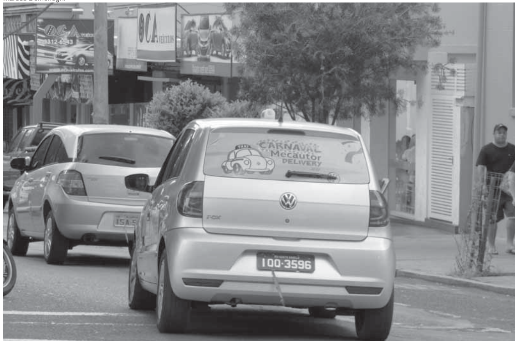
Cinco taxistas foram sorteados para prestarem o serviço e estão identificados com o cartaz da campanha

Os foliões do carnaval do Clube Gaúcho terão vale-taxis patrocinados por uma revenda de automóvel de Santo Ângelo. A 2ª Edição do “Carnaval Mecautor Delivery – 2017” disponibilizará cinco taxis que prestarão o serviço no dia 25 de fevereiro. Serão distribuídos gratuitamente 100 vales, limitados ao valor de R$ 15,00 a corrida no perímetro urbano de Santo Ângelo. Os taxistas que participarão foram escolhidos por sorteio.