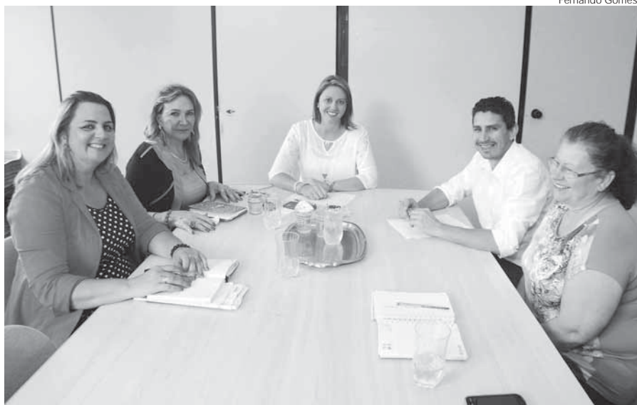
Durante reunião, administração municipal confirmou parceria para o evento que está na vigésima edição e acontece no dia 23 de abril

A administração municipal confirmou na manhã da terça-feira, dia 14, o apoio à vigésima segunda edição do evento que acontece no dia 23 de abril envolvendo nas atividades uma parceria significativa da comunidade santangelense.