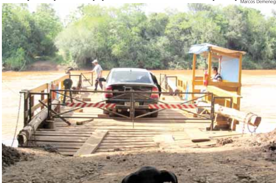
Diariamente mais de 10 veículos precisam usar a Barca entre o rincões: dos Gabriel e dos Peirotos

O caminho mais curto entre os rincões pode ser feito pela manhã das 7h30min até às 11h30min e à tarde das 13h30min até às 17h30min. A secretaria dos transportes de Santo Ângelo mantém a estrutura do equipamento que é vistoriado e regulamentado pela Marinha do Brasil.