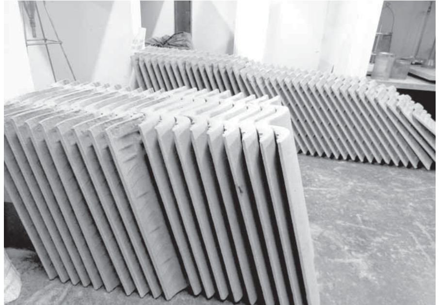
Telhas de cimento produzidas com percentual de areia de fundição

Uma pesquisa realizada na URI analisou mais de 6250 tijolos feitos com proporções diferentes de areia de fundição e agora busca parcerias para utilizar o potencial deste material na construção civil e em obras públicas