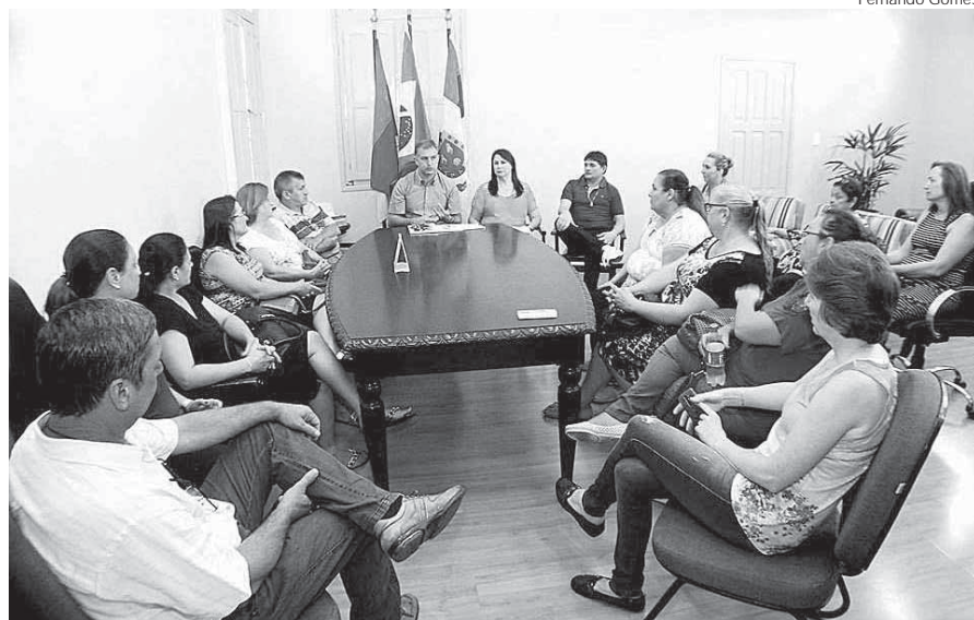
Reunião aconteceu nesta semana a Proposta do Executivo é manter o diálogo e construir soluções em conjunto com magistério