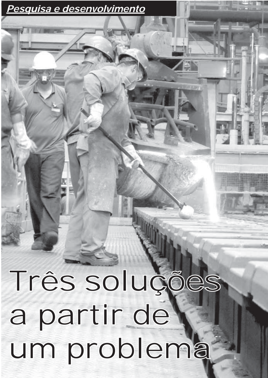
Fabricação de peças de ferro fundido na Fundimisa