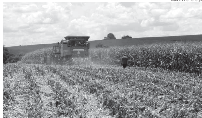
Diferente do técnico agrícola, que trabalha focado na produção, o técnico em agronegócio é voltado à gestão das empresas agrícolas

Quem já atua ou pretende atuar no setor agropecuário e está em busca de atualização ou formação profissional na área deve ficar atento. O Serviço Nacional de Aprendizagem Rural (SENAR) anuncia para os próximos dias um novo processo seletivo para seu Curso Técnico em Agronegócio. O curso exige do candidato o Ensino Médio completo e tem a vantagem de ser semipresencial e totalmente gratuito. Seus alunos, porém, apontam uma terceira como principal: a qualidade do ensino. Haverá turma no Sindicato Rural de Cruz Alta.