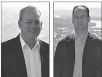
Vilmar Kaiser Prefeito (PP)