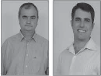
Amauri Pires da Silva Prefeito (PP)