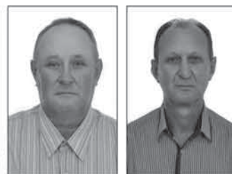
Ildo Leske Prefeito (PDT)