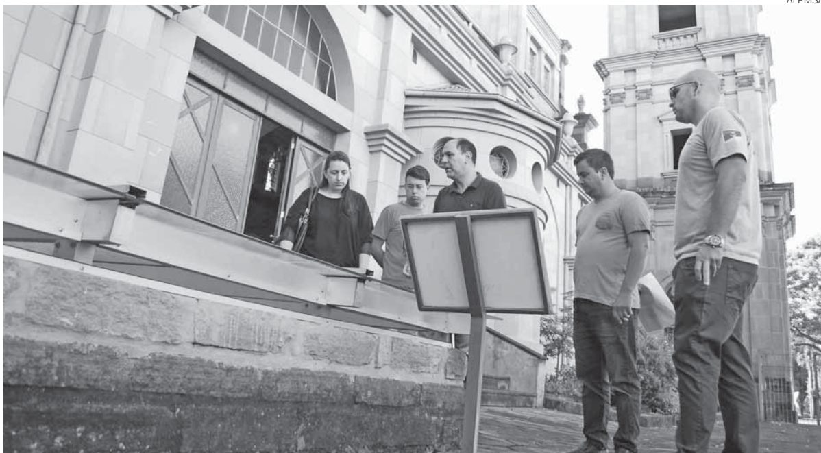
Janelas arqueológicas estão localizadas no Centro Histórico Municipal

As janelas arqueológicas mostram os vestígios arquitetônicos da antiga redução de Santo Ângelo Custódio, um Museu a Céu Aberto no Centro Histórico do município. Elas foram construídas em 2007, na gestão do ex-prefeito Eduardo Loureiro, para fortalecer o turismo e preservar a história da Capital das Missões.