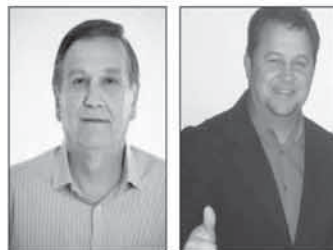
Sidney Luiz Brondani Prefeito (PP)