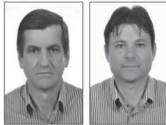
Jeronino Jaskulski Prefeito (PMDB)