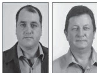
Márcio Politowski Prefeito (PT)