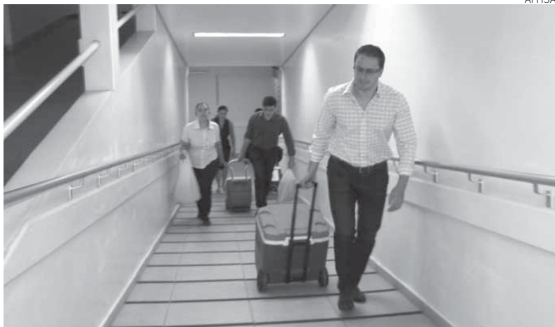
Equipe da Central de Transplantes fez captação de órgãos no Hospital Santo Ângelo no último sábado, dia 14

O paciente estava internado desde a madrugada da sexta-feira, 13, no Hospital Santo Ângelo. A enfermeira coordenadora da