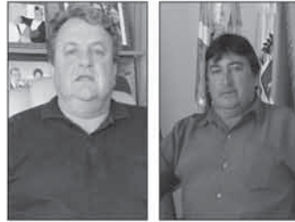
Ademir José Andrioli Gonzato Prefeito (PP)