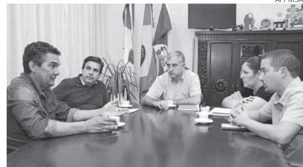
Reunião debateu sobre as condições da estrutura de equipamentos médicos e física do prédio da UPA