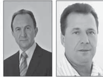
Brasil Antônio Sartori Prefeito (PP)