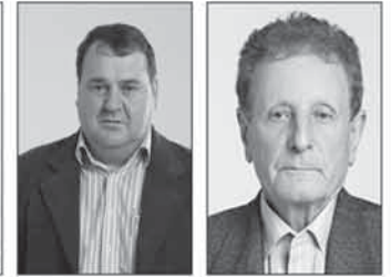
Jaime Dionir Zweigle Prefeito (PP)