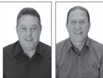
Paulo Rogério de Menezes Peixoto Prefeito (PMDB)