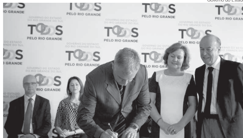
Governo do Estado

Além das redes coletoras em concreto e ferro fundido, serão instalados 740 metros de redes