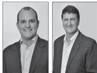
Eduardo Bonotto Prefeito (PP)