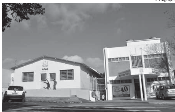
APAE promove no próximo dia 6 o Festival de Natal, “Quando as luzes se apagam a magia acontece”. Evento será realizado em frente ao educandário a partir das 20h