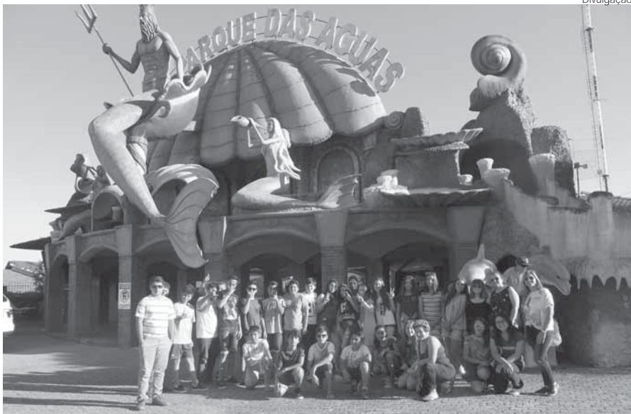
Alunos das sétimas séries do Colégio Estadual Onofre Pires visitaram locais de Porto Alegre e Viamão visando complementar projetos interdisciplinares desenvolvidos na escola

Os alunos das 7 as séries do Colégio Estadual Onofre Pires realizaram uma viagem de estudo, nos dias 23 e 24 de novembro para Porto Alegre e Viamão. Os alunos conheceram o Aeroporto Internacional Salgado Filho, a Arena do Grêmio, interagiram no Museu de Ciências e Tecnologia PUCRS- (MCT), o maior museu interativo da América Latina, além disso, os estudantes tiveram momentos de lazer e harmonia no Parque das Águas, em Viamão e finali-