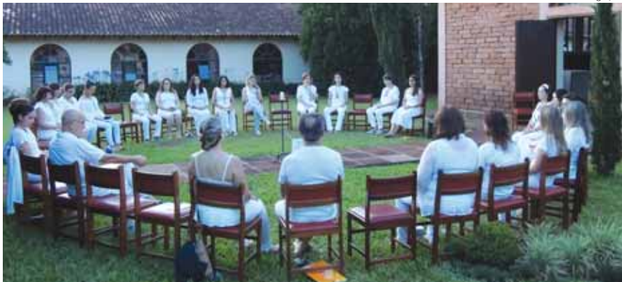
Jornadas reuniram cursistas de todo o estado, além de Santa Catarina e Paraná

O Instituto Surya Ananda recebeu cursistas de vários municípios do estado bem como de Santa Catarina e do Paraná durante as duas Jornadas de Autoconhecimento e Gerenciamento do estresse.