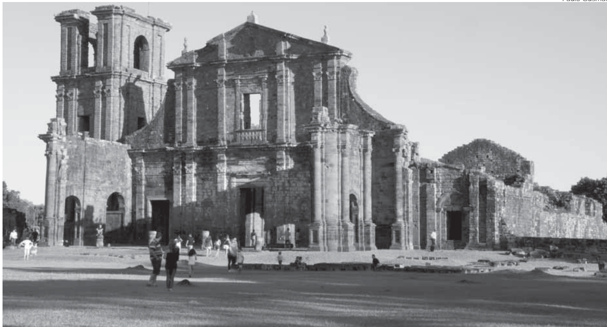
Seminário tem como público alvo gestores de Parques Históricos e Culturais e sítios protegidos pelo IPHAN como as Ruínas de São Miguel das Missões

Dono de uma paisagem cultural de altos valores patrimoniais e ambientais, o território das Missões Jesuíticas dos Guarani, no Brasil, foi escolhido para sediar o primeiro Seminário Internacional de Boas Práticas em Gestão de Paisagens, Parques Históricos e Culturais, entre os dias 5 e 9 de dezembro, na Universidade Regional Integrada do Alto Uruguai e das Missões (URI) - Campus Santo Ângelo.