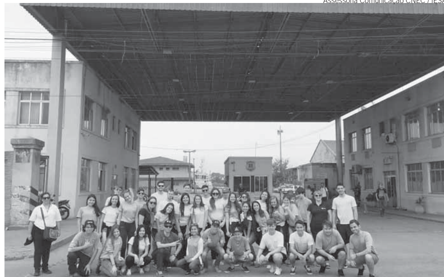
Alunos do 2º e 3º Ano do Ensino Médio visitaram as cidades de Pelotas, Rio Grande, São José do Norte e Santa Vitória do Palmar