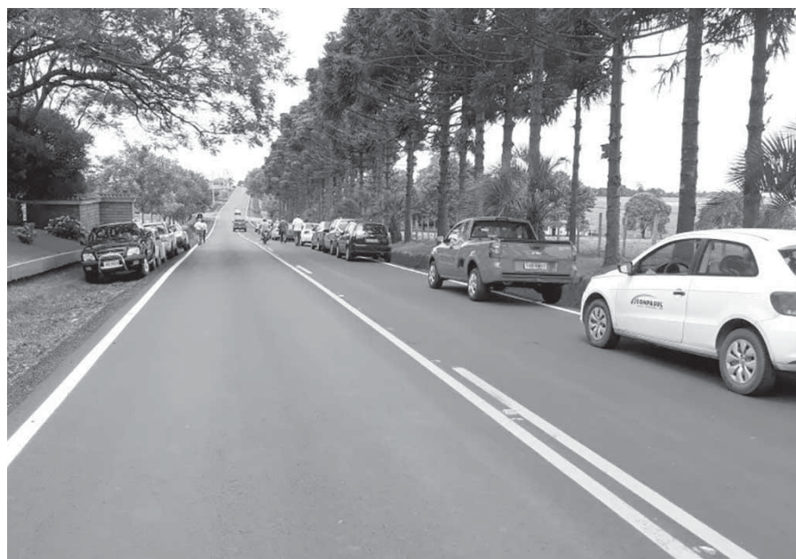
Trecho de 10,6 quilômetros liga cidade ao distrito de Buriti