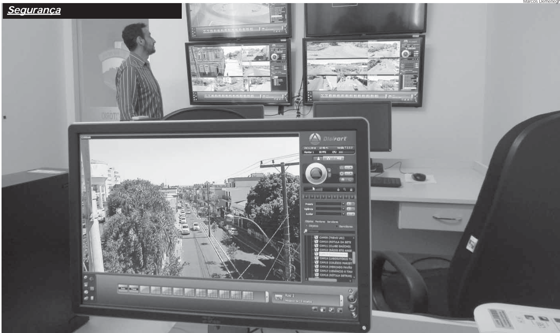
Sala de videomonitoramento montada no quartel do 7º Regimento de Polícia Montada. Deste local, os policiais realizam aproximação e os enquadramentos das 24 câmeras