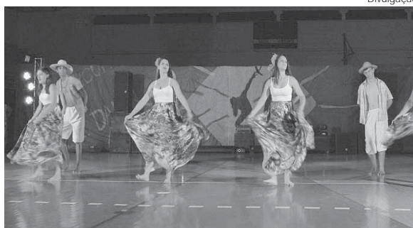
Evento acontece dia 2, às 19h30min, no Ginásio de Esportes da URI

"A dança une todas as pessoas. Buscamos mostrar esse ponto tão importante que é a inclusão causada pela dança", destaca.