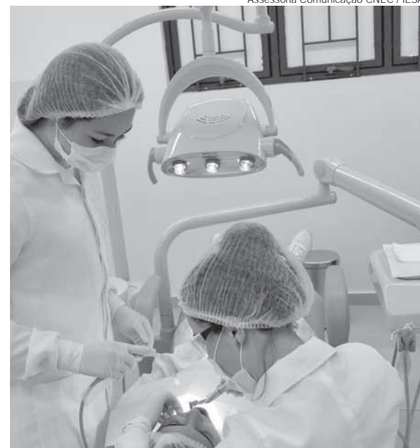
O projeto consiste no recebimento, tratamento e distribuição de órgãos dentários extraídos

O procedimento para doação é muito simples. Interessados devem entrar em contato com o curso de Odontologia do IESA para maiores esclarecimentos, pelo telefone (55) 3313-1922 ou pelo e-mail iesa.bancodentes@gmail.com