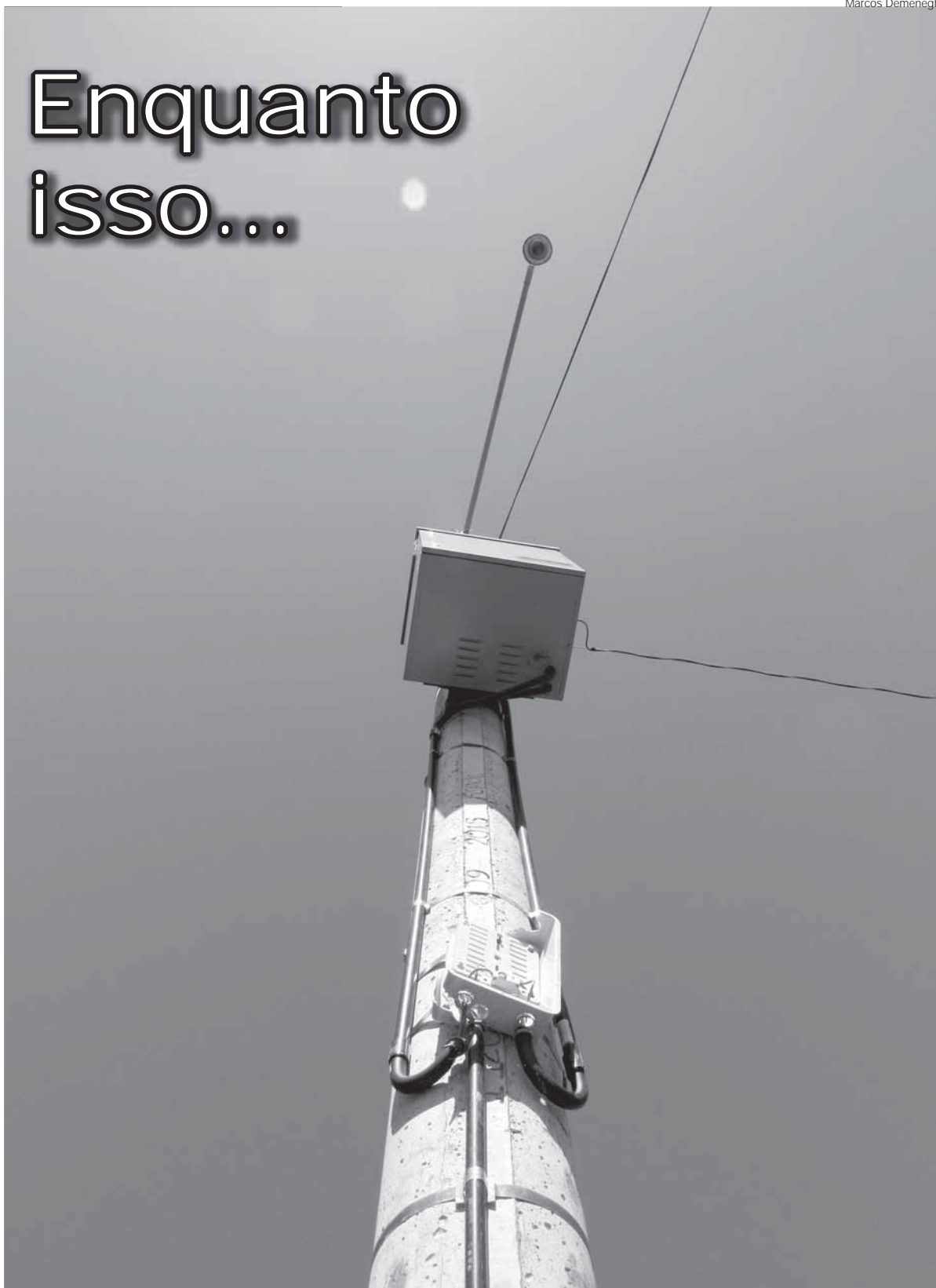
Sistema de alimentação de energia elétrica foi destruído pela possível ação de vândalos. Cada câmera possui um nobreak

Enquanto o sistema de videomonitoramento não é oficialmente inaugurado o equipamento é danificado pela possível ação de vândalos. Acidentes provocam o rompimento dos fios de fibra óptica e estratégias de manutenção estão entre as prioridades políticas para manter a integridade do sistema e evitar o sucateamento da rede.