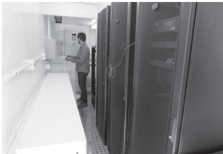
Processadores e servidores tem dispositivos de segurança de energia como gerador a diesel, refrigeração e foram montados de modo que podem ser realocados em caso de necessidade