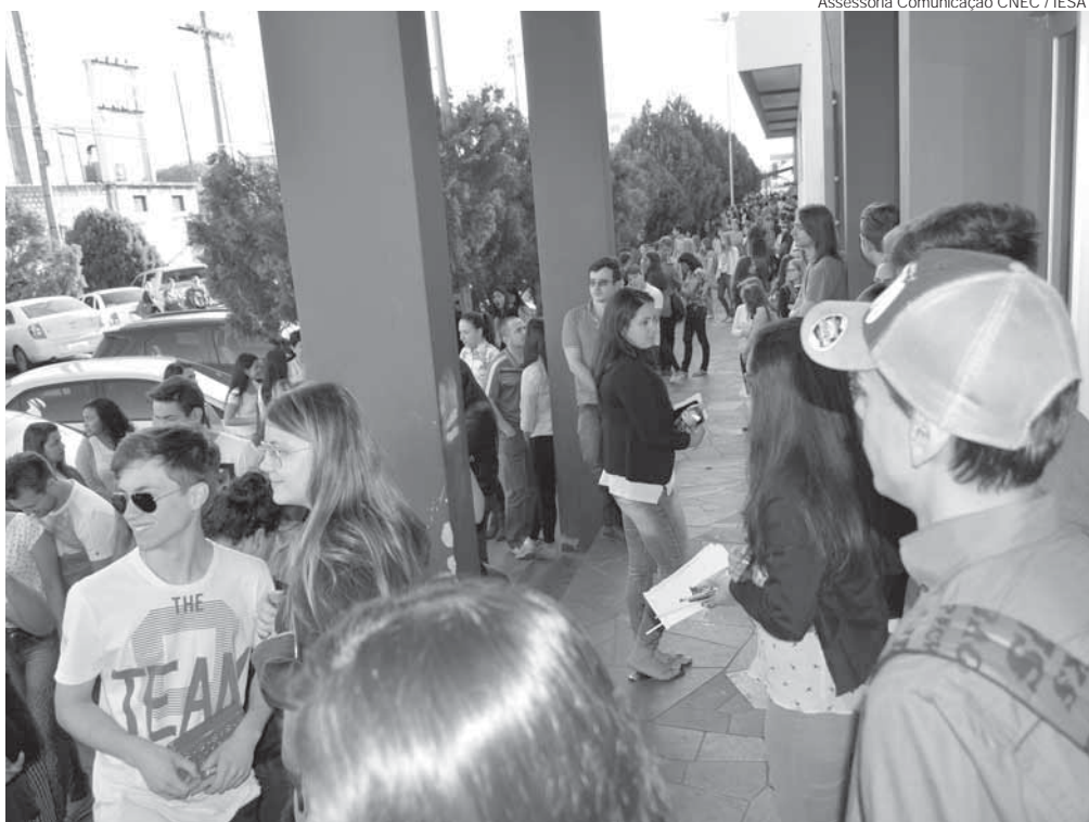
Assessoria Comunicação CNEC / IESA

mento ou Casamento; Título de Eleitor acompanhado de comprovante de votação ou de justificativa de não votação na última eleição, de ambos os turnos, se for o caso; Prova de Quitação com o Serviço Militar (para candidatos do sexo masculino maiores de 18 anos); Foto 3x4 recente; Comprovante de Residência; Histórico Escolar do Ensino Médio; Certificado de Conclusão do Ensino Médio ou Certidão de Conclusão da Educação de Jovens e Adultos (EJA); Diploma de Conclusão de Graduação (para o caso de diplomados); Documento de Identidade, CPF e Comprovante de Residência do responsável financeiro que ratificará o Termo de Adesão ao Contrato de Prestação de Serviços Educacionais (para candidatos menores de 18 anos). Mais informações podem ser obtidas pelo telefone (55) 3313-1922 ou pelo site www.cnecsan.cnec.br.