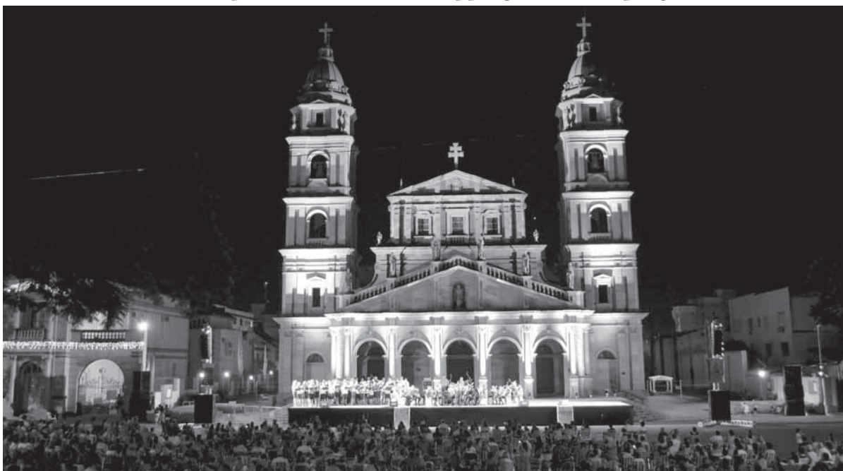
Programação inicia em 9 de dezembro e prossegue até 31 de dezembro

Além de variadas atrações culturais, também está confirmada a exibição de um novo espetáculo em vídeo mapping durante a programação