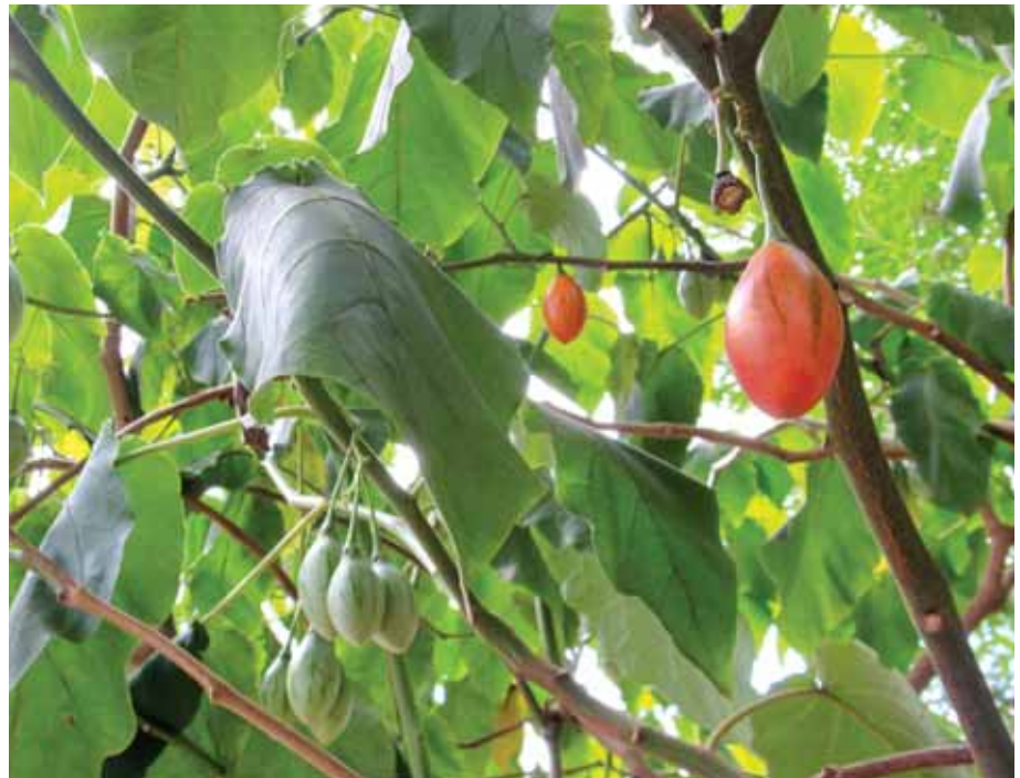
Tamarillo ou tomate japonês foram plantados no local

O tamarillo (pronuncia-se “tamarijo”), de nome científico Ciphomandra betacea (Cav.) Sendt., é também popularmente conhecido como tomate japonês, cigomandra, tomate francês ou tomate de árvore. Originária dos Andes. Pertencente à família das solanáceas – a mesma do tomate, da batata e da berinjela –, o tomate de árvore era cultivado pelos incas em hortas acima de mil metros de altitude, desde antes da chegada dos europeus à América. Atualmente, ainda é bastante apreciado no Peru e no Equador, porém o seu cultivo disseminou-se para outros países, como a Nova Zelândia, Estados Unidos, Indonésia e sul da Índia. No Brasil, o tamarillo disponível à venda é quase totalmente vindo de importações. Esta fruta possui propriedades muito benéficas à saúde.