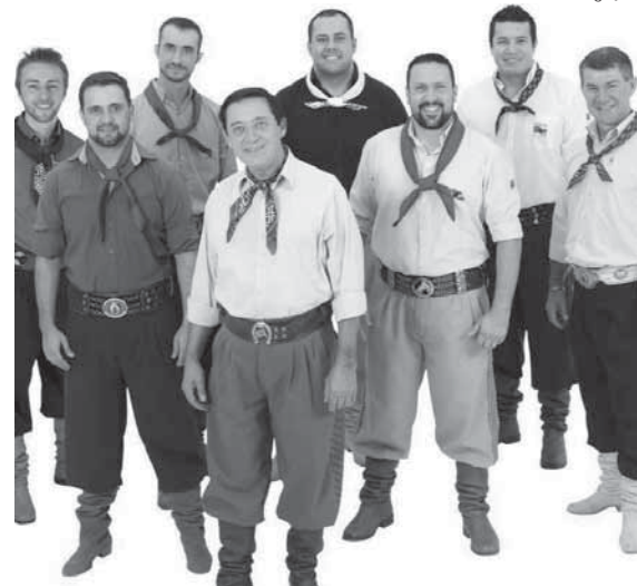
Baile acontece no próximo dia 25, às 23h30min

O CTG 20 de Setembro promove uma grande festa alusiva ao aniversário de 63 anos da entidade. No próximo dia 25 de novembro, a partir das 23h30min o Grupo Chiquito & Bordoneio animará o baile de aniversário de um dos mais tradicionais centros de tradição Gaúcha da nossa cidade.