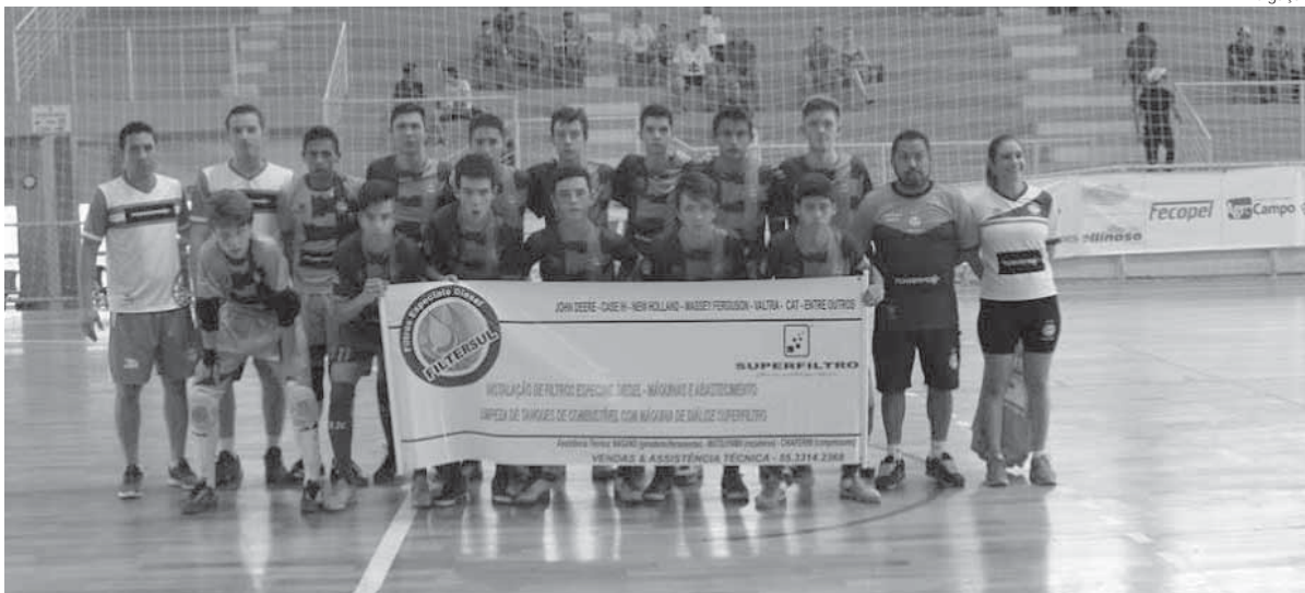
Equipe missioneira precisa vencer no tempo normal e pelo menos empatar na prorrogação

A categoria de base Sub-15 da Associação Santo Ângelo de Futsal irá decidir neste sábado, dia 19, em casa, o título de Campeão Estadual de Futsal deste ano. A partida será realizada no Ginásio Marcelo Mioso com início previsto para às 19 horas.