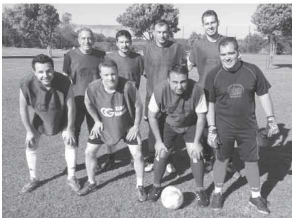
Torneio reuniu 70 jogadores. Times foram divididos pela cor de fardamento dos atletas

O Clube Gaúcho realizou de 3 de setembro a 5 de novembro a 1ª Liga de Futebol do Clube Gaúcho. Durante o torneio foram disputados 30 jogos, durante 10 sábados. Segundo a diretoria do clube, a ideia de fazer um campeonato surgiu da conversa entre os componentes do Grupo do Futebol, onde pensavam em fazer algo diferente e que motivasse