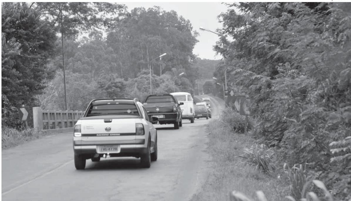
Motorista que cometer infrações a partir do próximo dia 1º pagará mais caro