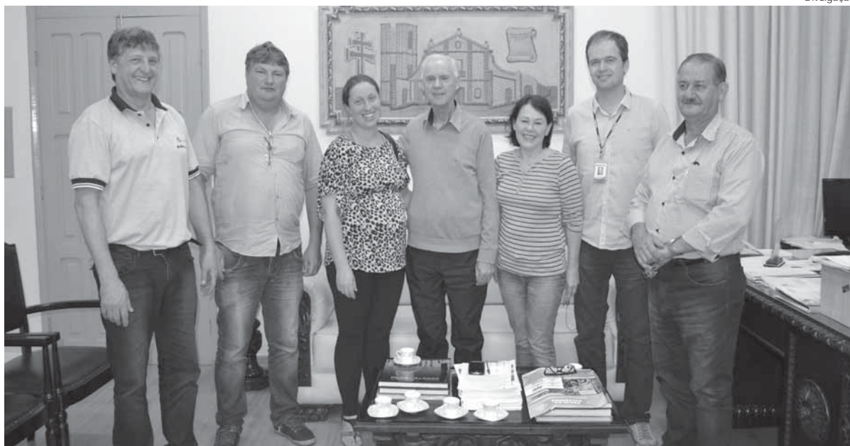
Reunião foi realizada no Centro Administrativo visando os preparativos para a feira

Evento busca evidenciar as potencialidades das agroindústrias e dos produtos oriundos da agricultura familiar do município