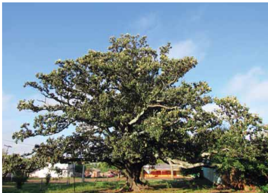
A magnólia está localizada na Rua Raul Pila, esquina com a Rua São Lourenço. É patrimônio natural de Santo Ângelo e possui 232 anos de idade

ESTAMOS COM MATRÍCULAS ABERTAS! Aproveite a oportunidade e venha estudar Inglês com a