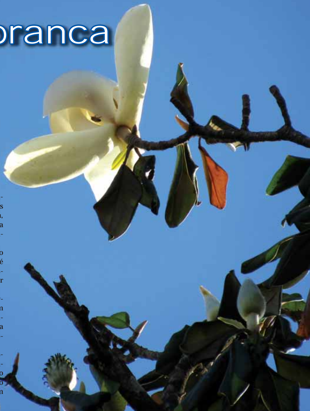
A flor da magnólia tem mais de 20 cm, é branca e exala suave perfume

A Magnólia consta em uma relação de elementos do patrimônio turístico cultural da região missioneira realizado no ano de 2006 pelo Instituto Andaluz Del Patrimônio Histórico, IPHAN – Instituto do Patrimônio Histórico e Artístico Nacional e URI Câmpus de Santo Ângelo. O referido estudo e inventário estão disponíveis em arquivo digital na internet com uma série de locais e prédios que fazem parte da história desta região.