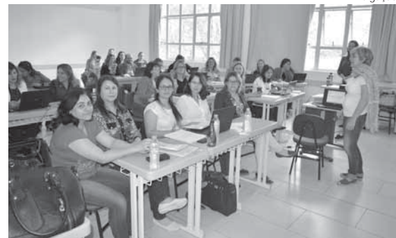
Segunda etapa da atividade ocorreu no Instituto Federal Farroupilha na sexta-feira

Os secretários de Educação dos municípios de abrangência da Associação dos Municípios das Missões (AMM), juntamente com assessores técnicos, participaram nesta semana da segunda etapa da Formação para Adequação dos Planos de Carreira e Remuneração do Magistério. A atividade ocorreu na quinta-feira, dia 20, e sexta-feira, dia 21, no campus Santo Ângelo do Instituto Federal Farroupilha (IFF).