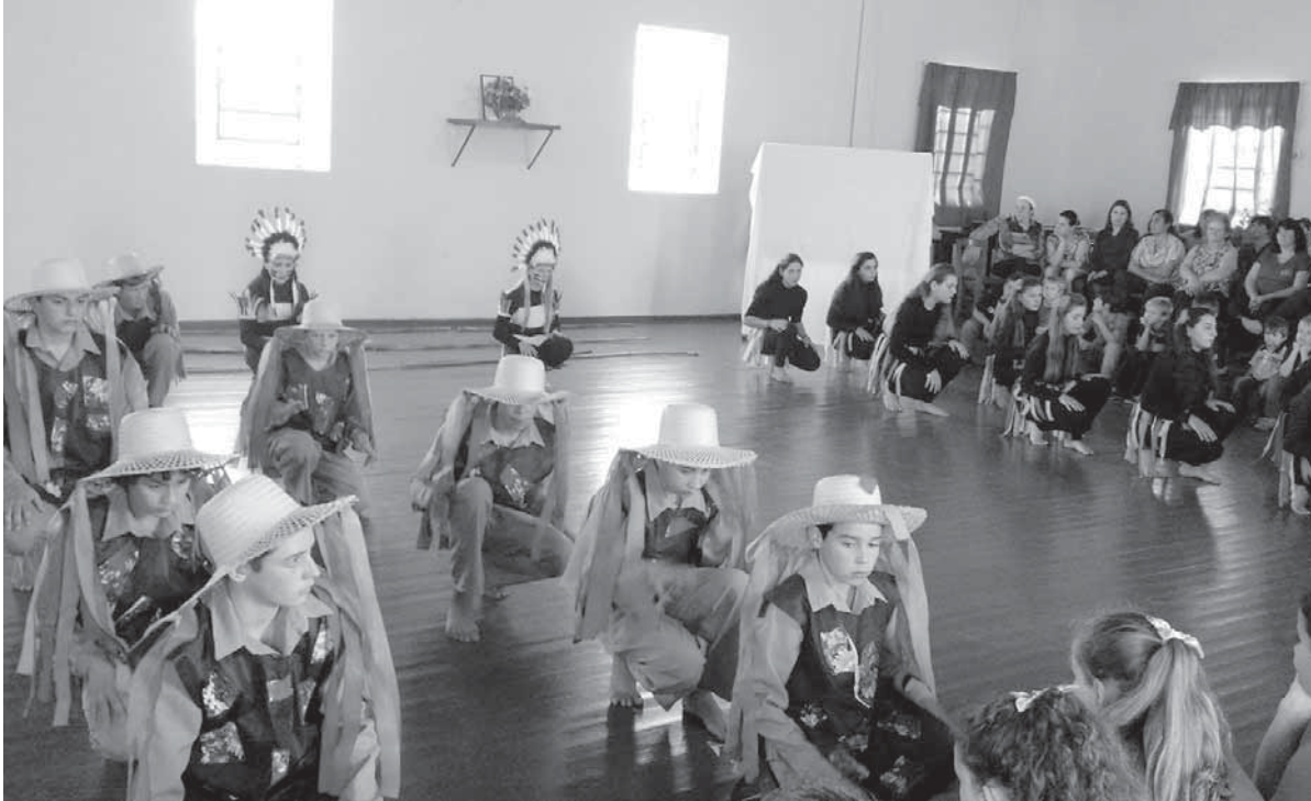
Apresentação de alunos da Escola Estadual de Ensino Fundamental Sagrada Família realizada para esta edição dos jogos

De 24 a 29 de outubro será realizado no Teatro Antônio Sepp as apresentações finais da terceira edição dos Jogos Culturais da OAB. A final do concurso de oratória, uma das provas mais esperadas e importantes da competição, será na tarde de quarta-feira, dia 26, e o encerramento festivo com entrega das premiações será na noite de sexta-feira, dia 29.