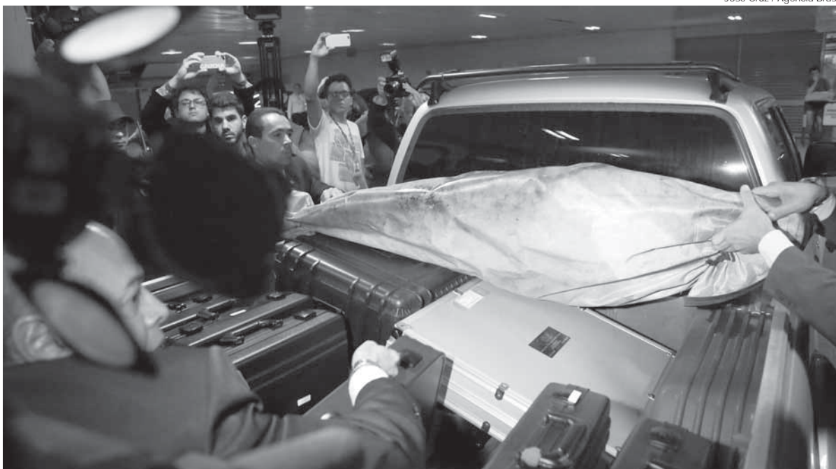
Agentes da Polícia Federal foram até o Senado na manhã de ontem para realizar as prisões

A Polícia Federal prendeu, na manhã de ontem, pelo menos quatro policiais legislativos suspeitos de prestar serviço de contra inteligência para ajudar senadores investigados na Lava Jato e em outras operações. A suspeita é que esses policiais faziam varreduras nas casas dos políticos para, por exemplo, identificar e eliminar escutas instaladas com autorização judicial.