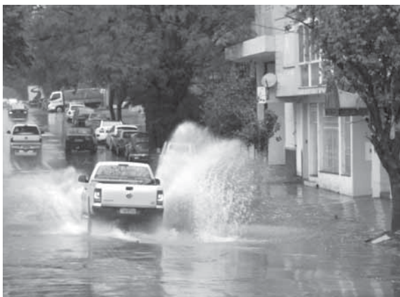
Av. Venâncio Aires esq. 25 de Julho (sentido norte/sul)

Desde o último sábado, dia 15, todas as regiões do RS foram atingidas e diversas localidades registraram fortes ventos, incidência de raios e queda de granizo. Segundo a Defesa Civil que ainda contabiliza os danos no Estado, a chuva intensa tem aumentando os pontos de alagamento e já são mais de 40 municípios gaúchos com algum tipo de registro em função da precipitação. A Defesa Civil segue monitorando os alertas, os níveis dos rios e acompanhando de perto os municípios afetados.