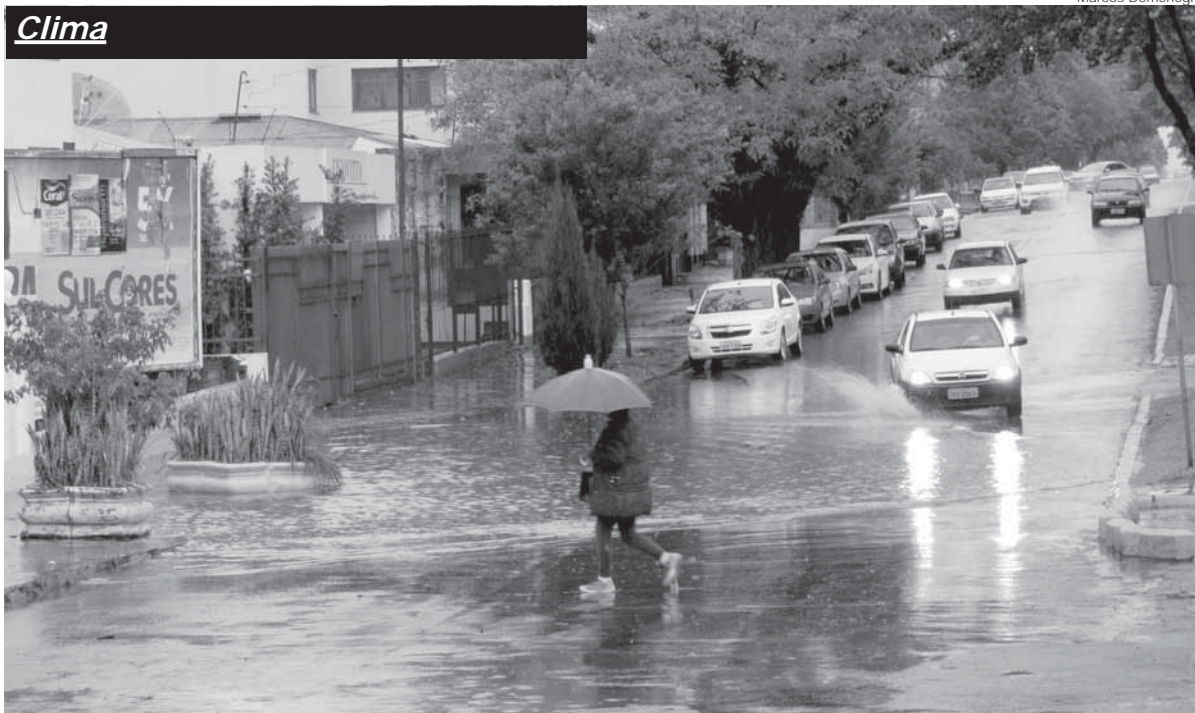
Bueiro entupido na Av. Venâncio Aires esquina com a 25 de Julho (sentido sul/norte)