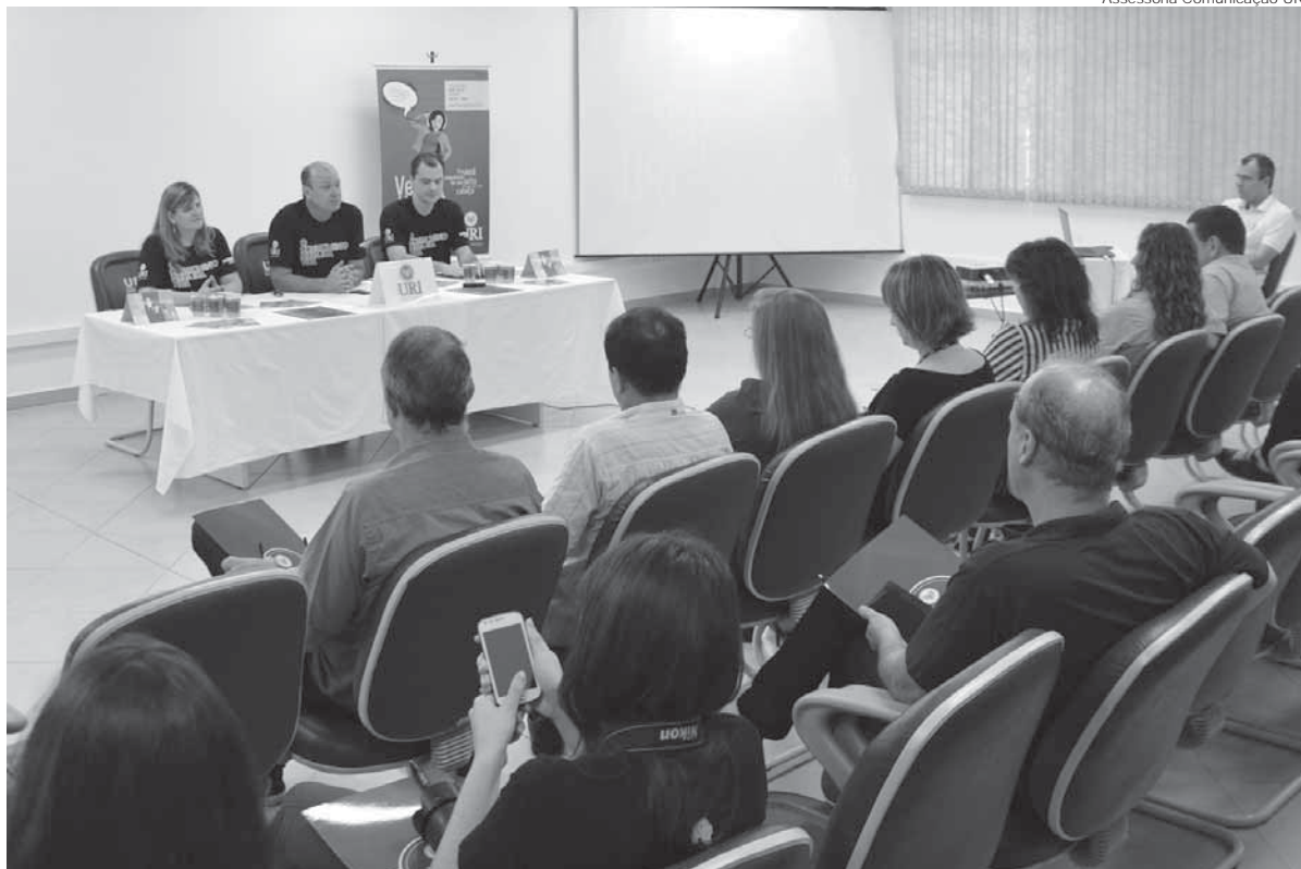
Lançamento do vestibular de verão aconteceu na última segunda-feira, dia 17 e reuniu a imprensa e coordenadores da URI

Foi lançado nesta segunda-feira (17), o Vestibular de Verão 2017 da URI Santo Ângelo. O processo seletivo oferece um total de 4050 vagas nas seis unidades da Instituição, das quais 1095 são para Santo Ângelo. As inscrições devem ser feitas até 21 de novembro no site vestibular.uri.br ou presencialmente nos câmpus. A prova será aplicada no dia 27 de novembro, às 14h.