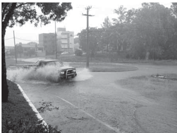
Rótula da Av. Getúlio Vargas e Perimetral Norte