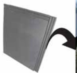
Telha Plana - Grafite Mate

Aqui você encontra o que há de melhor e mais moderno em telhas para sua construção!