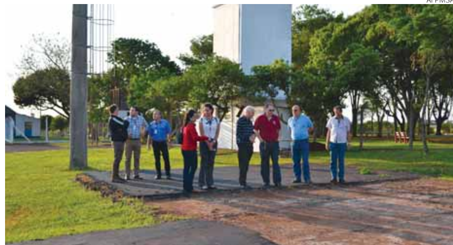
Representantes da Azul estiveram vistoriando o Aeroporto na última segunda-feira, dia 17

Está previsto para 5 de dezembro o início da operação da Azul em Santo Ângelo com um voo diário para Porto Alegre.