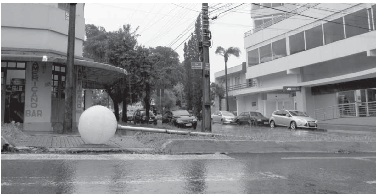
Luminária caída na esquina da Rua 15 de Novembro com a Rua 7 de Setembro