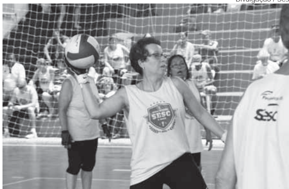
A competição voltada a pessoas acima dos 50 anos teve fases municipais em todo o RS

O Campeonato Municipal de Várzea é promovido pela Prefeitura de Santo Ângelo, através da Secretaria de Turismo, Esporte, Lazer e Juventude, com o apoio do Ministério do Esporte, por intermédio do Programa Futebol Para Todos.