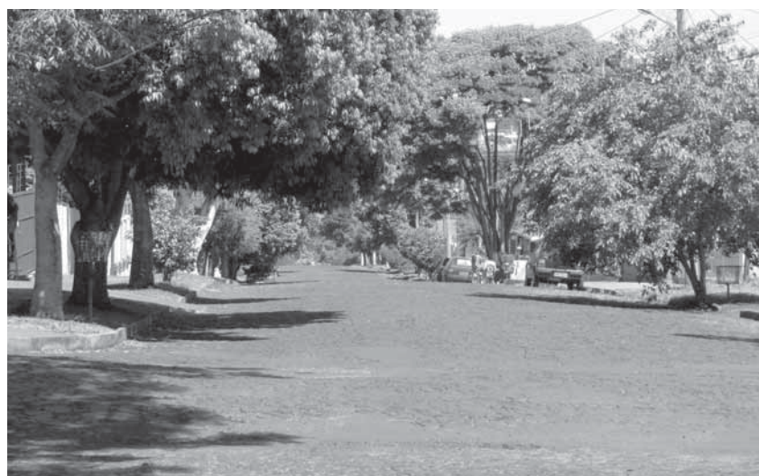
Rua José Bonifácio 2 (entre a Rua Imigrantes e a Avenida Rio Grande do Sul)