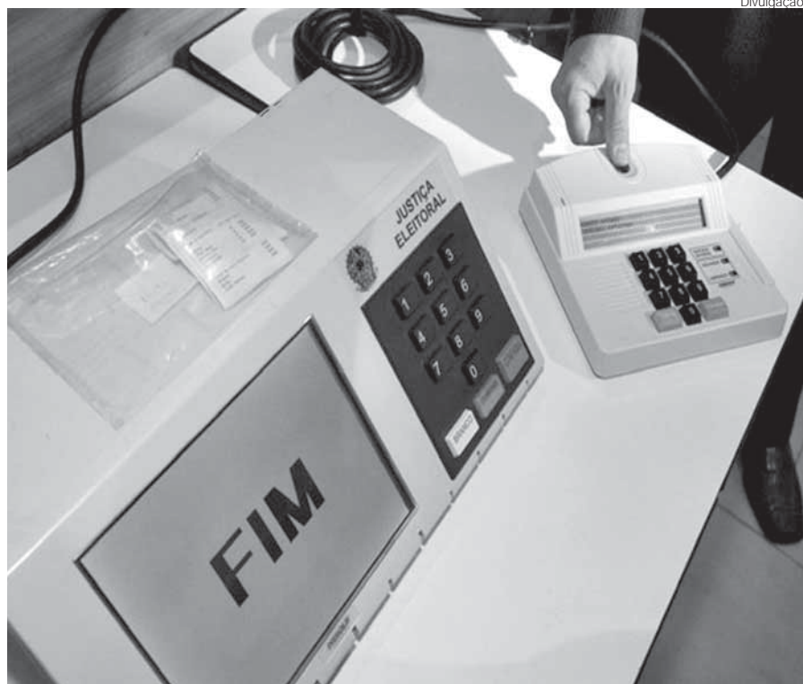
As urnas do município estão aptas a realizar identificação biométrica

No final de agosto e no início de setembro o presidente e o primeiro mesário de cada seção receberam treinamentos para atuar durante a votação.