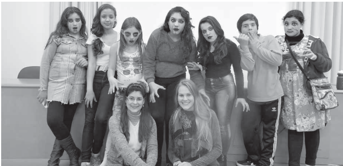
O trabalho também teve o objetivo de contemplar a Lei 13006/14 de 26 junho de 2014, a qual ressalva que: “a exibição de filmes de produção nacional constituirá componente curricular complementar integrado à proposta pedagógica da escola, sendo a sua exibição obrigatória por, no mínimo, 2 (duas) horas mensais.”

Informamos que no dia 22 de setembro, foi efetuado pagamento referente à manutenção e alimentação das Escolas de Tempo Integral do mês de agosto/2016.