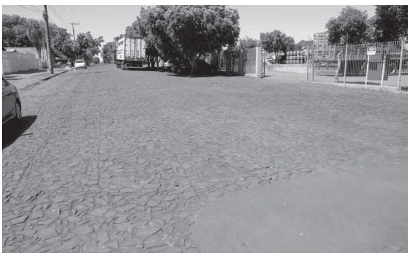
Rua Marques de Tamandaré (entre a Rua Souza Lobo e a Rua Ernesto Bratz)

Rua Marques de Tamandaré (entre a Rua Souza Lobo e a Rua Ernesto Bratz) Rua Osvaldo Cruz (entre a Rua Duque de Caxias e a Av. Brasil) Rua Independência (entre a Av. Brasil e a Rua Tiradentes) Rua Monte Castelo (entre a Rua Aniceto Gomes Castanho e a Rua Osvaldo Cruz) Rua Abelardo Ferraz (entre a Rua Daltro Filho e a Rua Osvaldo Cruz) Rua José Bonifácio 1 (entre a Rua Sete Povos das Missões e a Avenida São João) Rua José Bonifácio 2 (entre a Rua Imigrantes e a Av. Rio Grande do Sul) Travessa Gaspar Martins (entre a Rua Miguel Couto e a Rua São Lourenço) Rua da Bandeira (entre a Rua Jakob Vontobel e a Rua Afonso Penna) Rua Jakob Vontobel (entre a Rua da Bandeira e a Av. Ipiranga) Rua Germano Mousquer (entre a Av. Ipiranga e a Rua Coronel Eurico de Moraes) Rua Eduardo Maerkli (entre Av. Ipiranga e Rua Pedro Casarotto) Rua Pedro Casarotto (entre a Rua Eduardo Maerkli e o asfalto existente) Rua Padre Afonso Rodrigues (entre a Rua Roberto Frey e o entroncamento Largo São Francisco) Rua Roberto Frey (entre a Rua Padre Afonso Rodrigues e a Rua do Carmo) Rua do Carmo (entre a Rua Marechal Floriano e a Rua São Carlos) Rua São Carlos (entre a Rua do Carmo e a Avenida Rio Grande do Sul)