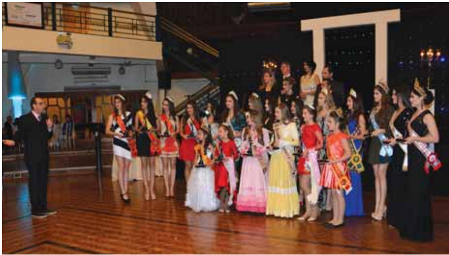
“Troféu Cabeças Coroadas” foi entregue para 20 beldades de diferentes partes do Estado

Na noite do último sábado, o Salão Principal do Clube Gaúcho foi palco da 3ª Edição da Noite das Debutantes e Soberanas do Clube Gaúcho, com o Lançamento da 43ª Revista O Mensageiro e entrega do Troféu Cabeças Coroadas