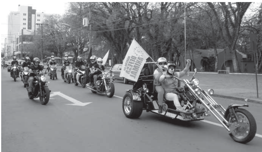
Motociclistas se uniram a marcha e seguiram motorizados para chamar a atenção da marcha

A Marcha da Defesa Animal teve uma manifestação em Santo Ângelo no último domingo, dia 18. Simpatizantes da causa reuniram-se na Praça Ricardo Leônidas Ribas, vestiram camisetas personalizadas e seguiram em uma passeata pelas ruas do município. O mesmo tipo de mobilização ocorreu em 52 cidades brasileiras. Em Santo Ângelo foi liderada e organizada pela Adasa - Associação Defensora dos Animais e ganhou a adesão de voluntários e de motoqueiros do Motogrupo Macanudos de Entre-Ijuís e Motoclube Route 344, entre outras pessoas.