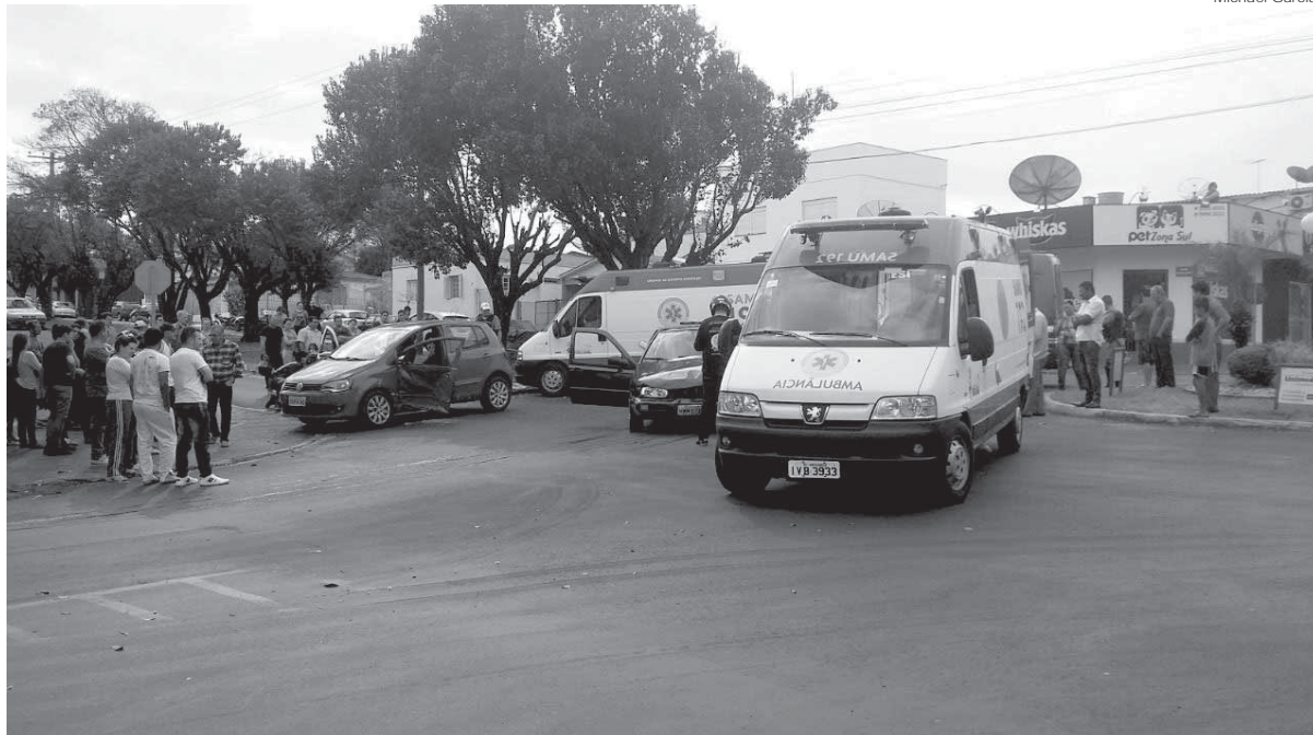
Ambulâncias do SAMU e do Corpo de Bombeiros, assim como a Brigada Militar estiveram no local atendendo a ocorrência

Um acidente de trânsito deixou feridos na tarde do último domingo, dia 18, na Zona Sul de Santo Ângelo.