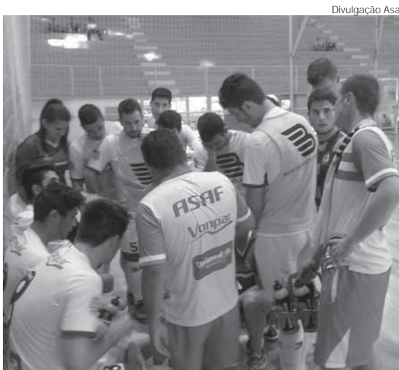
Empate em 2 a 2 com o MGA aconteceu no último domingo, no Ginásio Marcelo Mioso

A Asaf segue agora na disputa do Campeonato Estadual com as categorias de base Sub-15, a qual já está classificada para as semifinais e também com a categoria Sub-17, que se classificou para as quartas de finais. O próximo confronto será com a categoria Sub-17 que enfrentará a equipe do UJR em Novo Hamburgo no sábado, dia 24, em sua primeira partida pelas quartas de finais e o jogo de volta já está marcado para o dia 8 de outubro em Santo Ângelo.