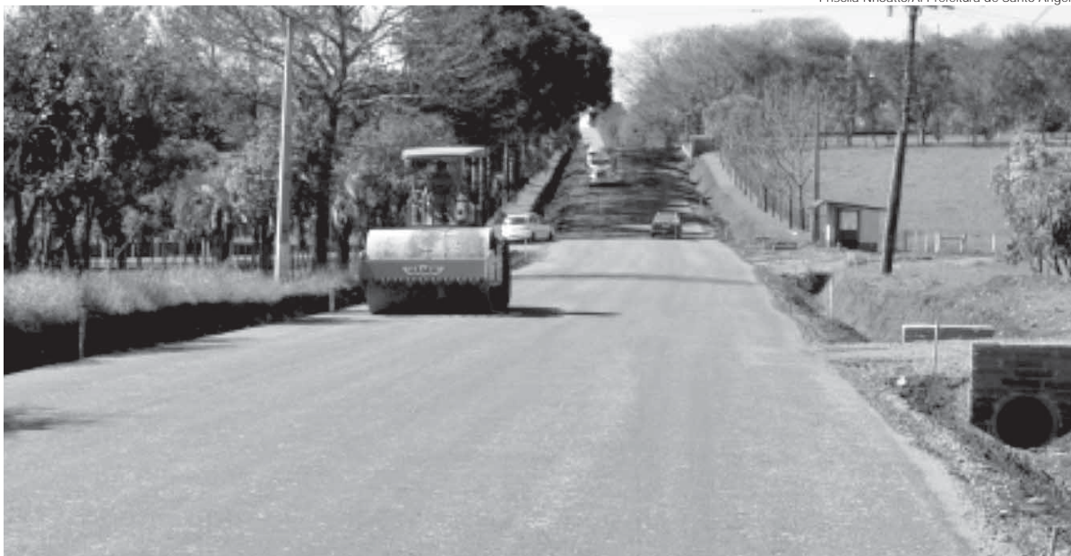
A pavimentação do Acesso ao Distrito de Buriti é uma antiga reivindicação da comunidade local