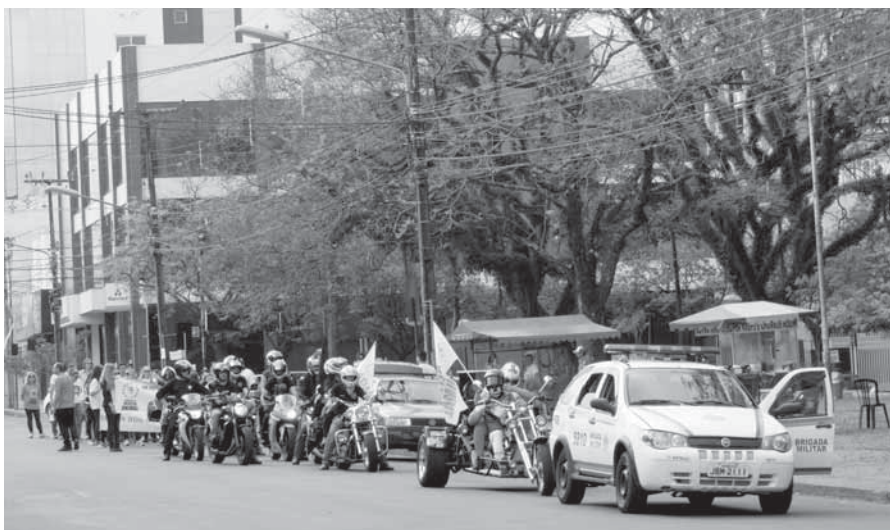
A Brigada Militar disponibilizou uma viatura para acompanhar a manifestação