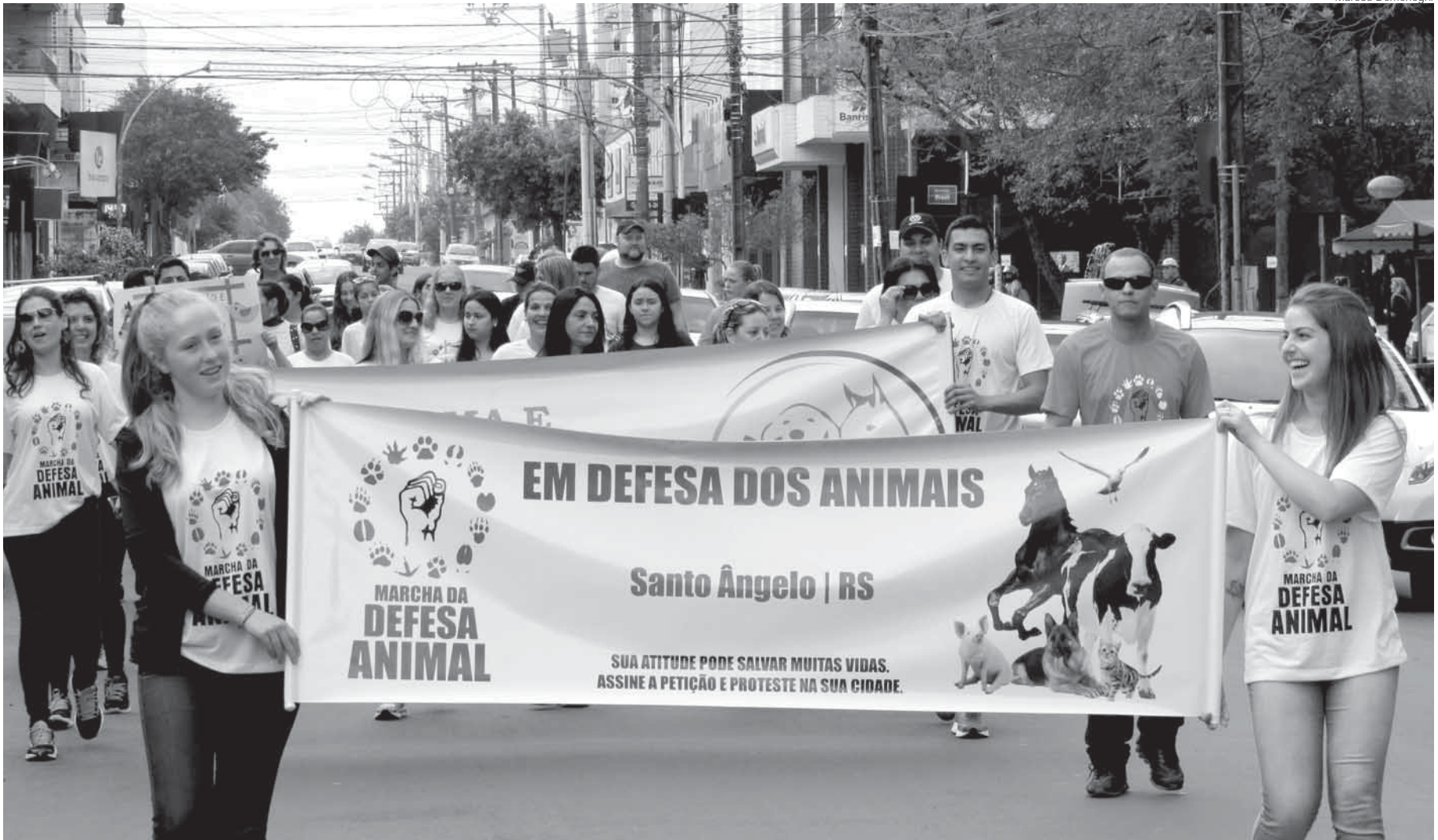
Os ativistas partiram da Praça Ricardo Leônidas Ribas passaram pelo Centro Histórico e retornaram pela Marquês do Herval ao mesmo ponto de partida