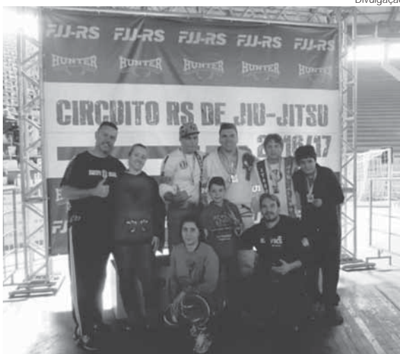
Atletas fazem parte do Grupo N1 Jiu Jitsu, de Santo Ângelo