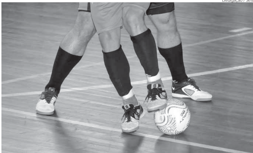
Próximas rodadas de cada modalidade ocorrem nos dias 22 e 25 de setembro

As etapas de Futsal e Futebol Sete na categoria adulto masculino dos 36º Jogos Comerciais já estão em andamento, na cidade de Santo Ângelo. As próximas rodadas estão programadas para o dia 22, às 20h e às 21h (futsal), no Ginásio Municipal Marcelo Mioso, e 25, às 9h, 10h e 11h (futebol sete), na Arena Piaia. A final de cada etapa estão previstas para o dia 2 de outubro (futsal) e 12 de outubro (futebol sete). Mais informações podem ser obtidas no Sesc Santo Ângelo (Rua 15 de Novembro, 1500), pelo telefone (55) 3312-4411, no site www.sesc-rs.com.br/santo_angelo e na página www.facebook.com/sescsantoangelo .