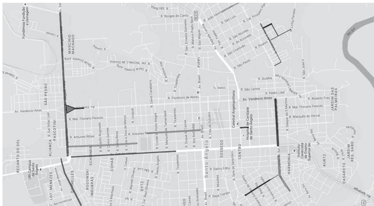
Mapa das ruas que receberão obras nesta fase do programa Pró-transporte PAC2

A Corsan, na Rua Antunes Ribas também realiza ramais da rede até terrenos e residências e na Av. Salgado Filho também trabalha em redes de esgoto.