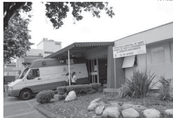
Consultas médicas podem ser realizadas nesta terça-feira, 20

O Posto de Saúde Doutor Ernesto Nascimento Sobrinho (o Posto da 22 de Março) realizará Plantão de Atendimento nesta terça-feira, dia 20, Feriado de Dia do Gaúcho e quando se comemora o Dia da Revolução Farroupilha.