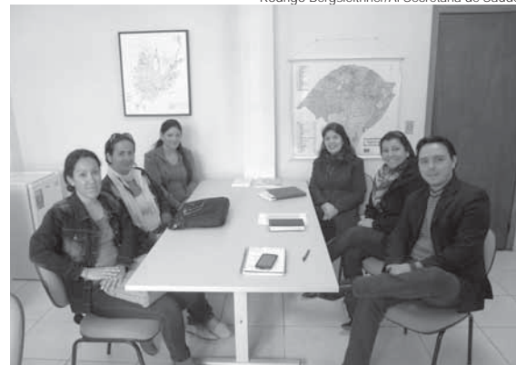
Profissionais atuarão na Atenção Básica