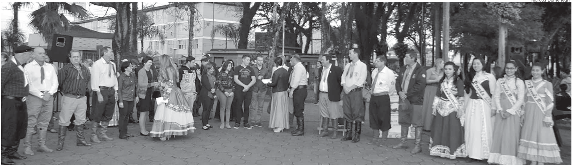
A entrega da premiação foi realizada durante a abertura oficial da Semana Farroupilha no Centro Histórico de Santo Ângelo

O Sindilijas Missões com o apoio do Comitê de Combate ao Comércio Ilegal e Entidades Tradicionalistas efetuou a entrega da premiação do Concurso de Vitrines, realizado entre os dias 05 e 12 de setembro. A premiação foi entregue durante a abertura oficial da Semana Farroupilha ocorrida na terça-feira, dia 13.