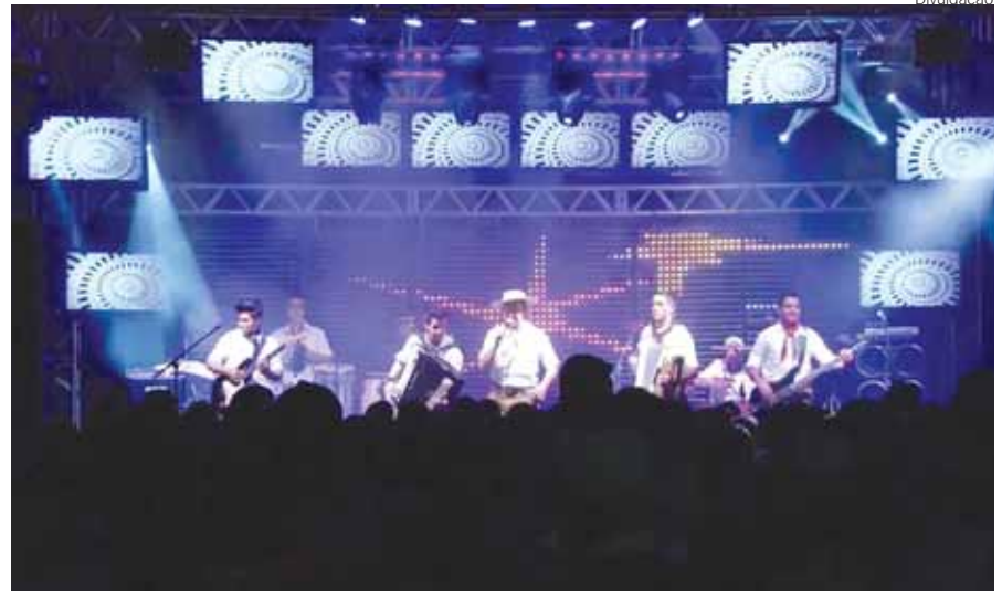
Grupo Gaitaço do Paraná se apresentará no CTG

O baile oficial do CTG Tio Bilia será neste domingo, dia 18. Animado pelo Grupo Gaitaço, do Paraná, compõe as atividades da Semana Farroupilha naquele Centro de Tradições e será o ponto alto da programação de domingo, sendo que, durante todo o dia acontecem atividades artísticas, culturais e gastronômicas. O CTG – Tio Bilia está localizado na rua Odão Felipe Pippi, na zona leste de Santo Ângelo.