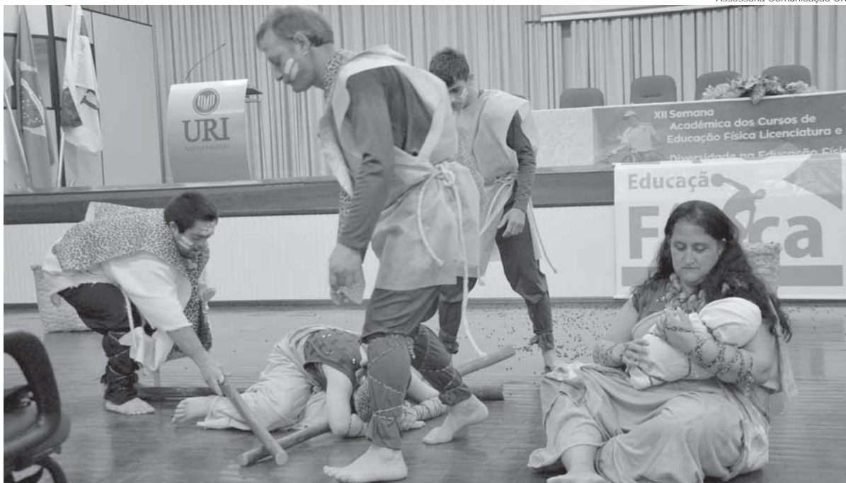
Semana Acadêmica iniciou na última segunda-feira, dia 12 e seguiu durante toda a semana na URI Santo Ângelo

Iniciou na segunda-feira, dia 12 a Semana Acadêmica Educação Física. A 12ª edição do evento é voltada para a atualização e reflexão dos profissionais da área, com palestras, minicursos e oficinas.