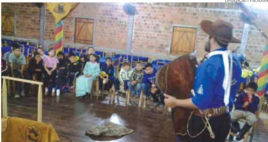
Na programação da Semana Farroupilha deste ano foram inseridas oficinas e amostras culturais, nas quais jovens e estudantes agendaram visitas para a participação