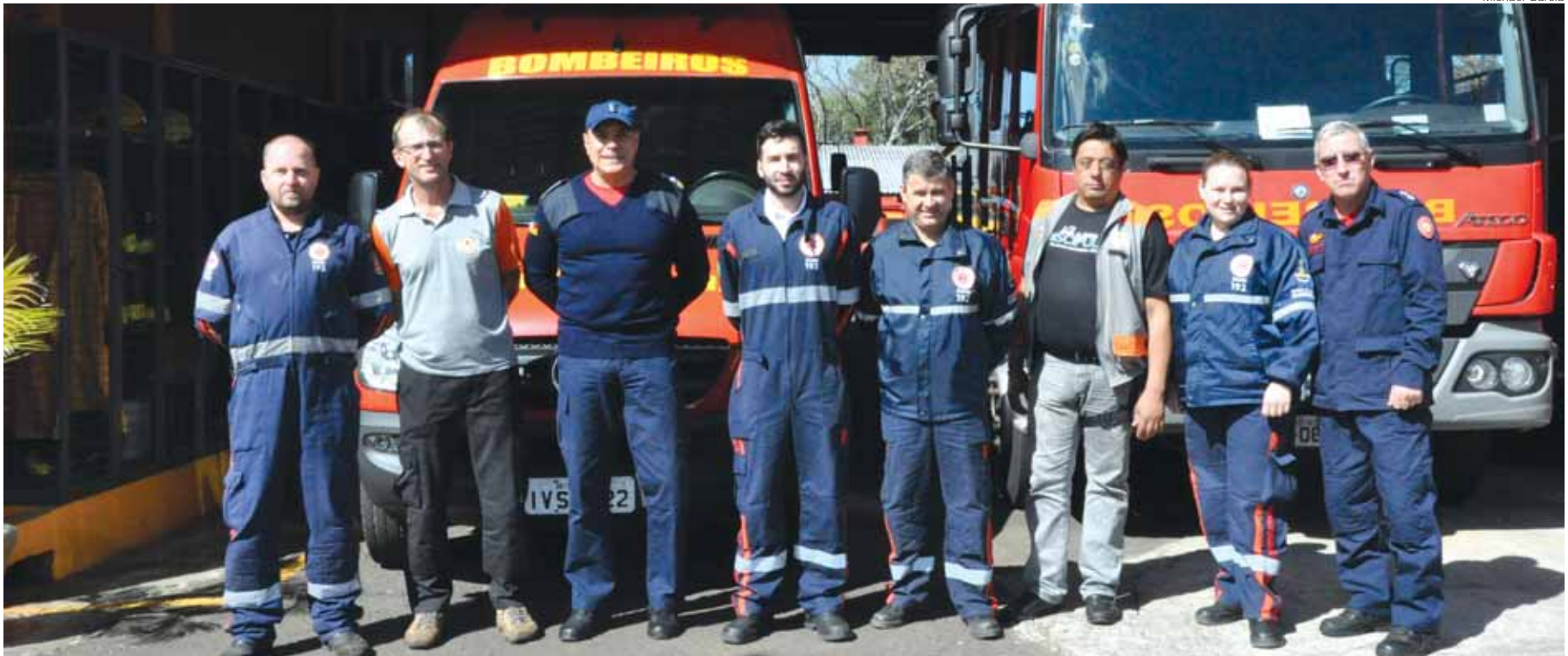
Na tarde da quarta-feira, dia 14, representantes da Defesa Civil, SAMU e Corpo de Bombeiros realizaram uma reunião para debater as tratativas finais do curso

Permanecem abertas até a próxima terça-feira, dia 20, as inscrições para o 2º Curso de voluntários da Defesa Civil em Santo Ângelo. O curso é gratuito e aberto a toda a comunidade, necessitando apenas ser maior de 16 anos. As inscrições podem ser feitas junto a Defesa Civil do Município e são disponibilizadas cerca de 50 vagas.