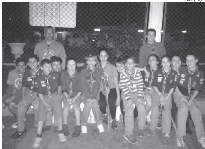
Grupo Escoteiro Medianeira Os escoteiros são jovens de 11 a 14 anos

Além da Tropa Escoteira, também participou a Tropa sênior (entre 15e 17 anos) e tiveram apoio do Clã Pionei-