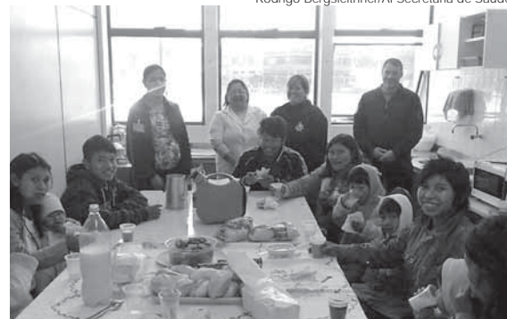
Desde setembro de 2015, Secretaria de Saúde atua na prevenção de doenças e na promoção de saúde dos indígenas