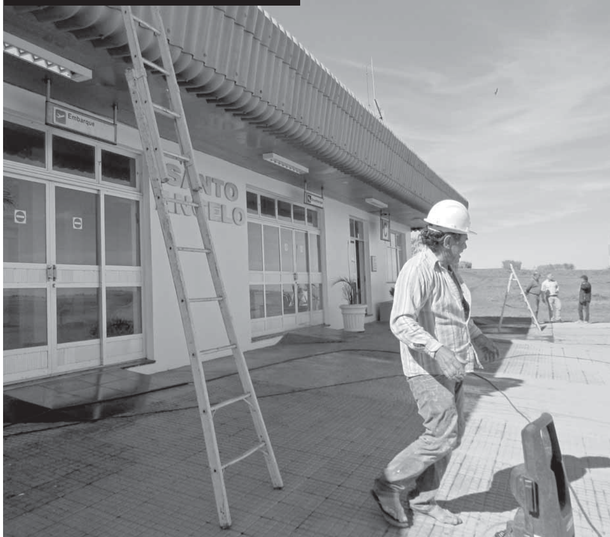
Empresa realiza os últimos detalhes da obra de adequação do terminal de embarque e desembarque