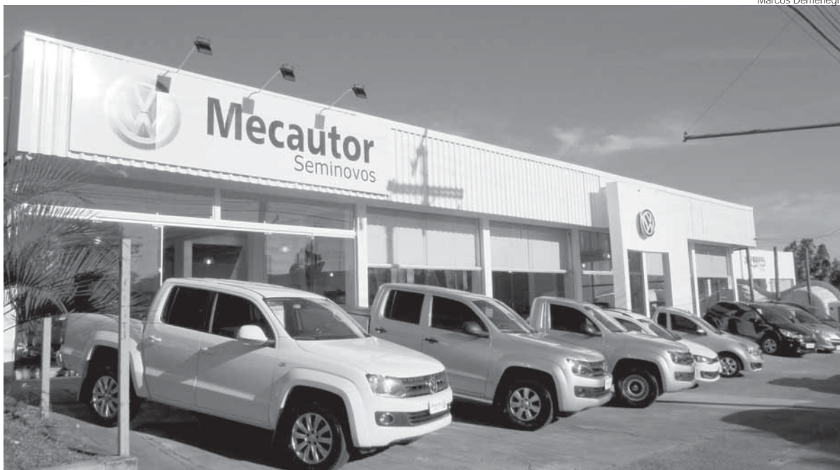
A nova loja está localizada na Av. Ipiranga número 845 - Telefone: 3312-0500

A Mecautor de Santo Ângelo inova e abre uma nova loja com foco na venda de seminovos. Há 43 anos no mercado automobilístico a Mecautor Seminovos será um ponto estratégico de vendas de automóveis multimarca da rede, em frente a tradicional loja da Av. Ipiranga, atende um público que gosta de carros com procedência confiável e melhor custo benefício, em relação ao carro Zero Quilômetro. A solenidade de abertura foi realizada na tarde da última sexta-feira, dia 16.