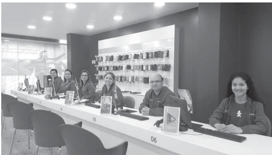
O ambiente da nova loja segue uma proposta estética minimalista e uma geometria espacial com formas retas