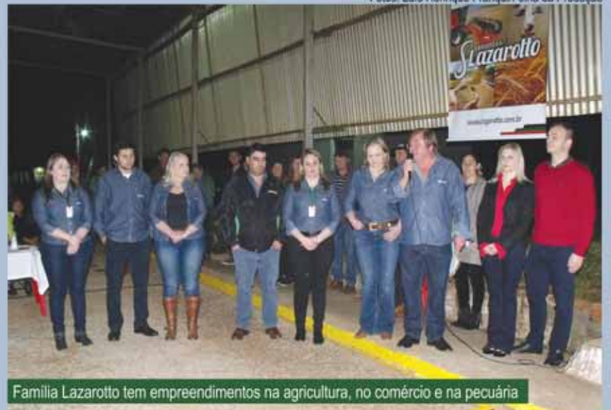
Família Lazarotto tem empreendimentos na agricultura, no comércio e na pecuária

Com a presença da direção, funcionários, clientes, autoridades e profissionais da área técnica, aconteceu na quarta-feira, dia 31 de agosto, a inauguração da unidade da Sementes Lazarotto em Roque Gonzales, nas antigas instalações da Cotrisa.