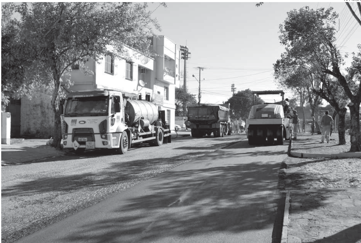
Avenida Rio Grande do Sul (trecho entre a Avenida Getúlio Vargas e a Avenida Venâncio Aires)

Trabalhos são executados nas avenidas Rio Grande do Sul, Apolinário Dornelles e na Rua João Henrique Licht