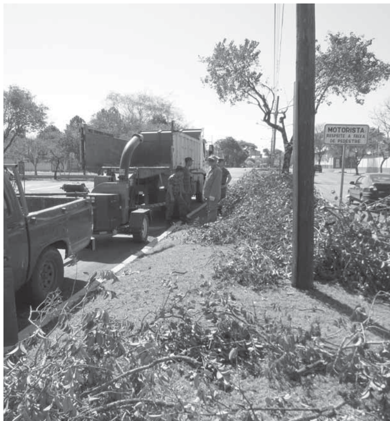
Picador adquirido em 2011 pela SEMA

Os trituradores de galhos são ferramentas que vem sendo adquiridas por prefeituras, condomínios, prestadoras de serviços de limpeza (terrenos e estradas), que utilizam o triturador para a produção de energias alternativas e limpas.