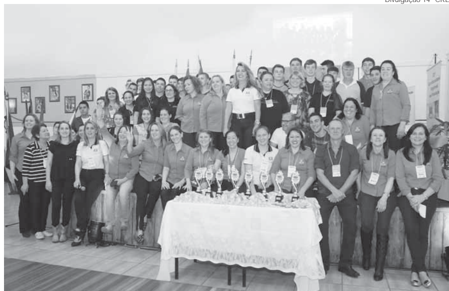
Equipe de coordenação

A MEP foi concluída na última sexta-feira, dia 26. De Santo Ângelo foram cinco projetos, considerando a regional da 14ª CRE, que envolve 11 municípios, foram apresentados 12 projetos. A comissão julgadora foi formada por profissionais de cada área temática.