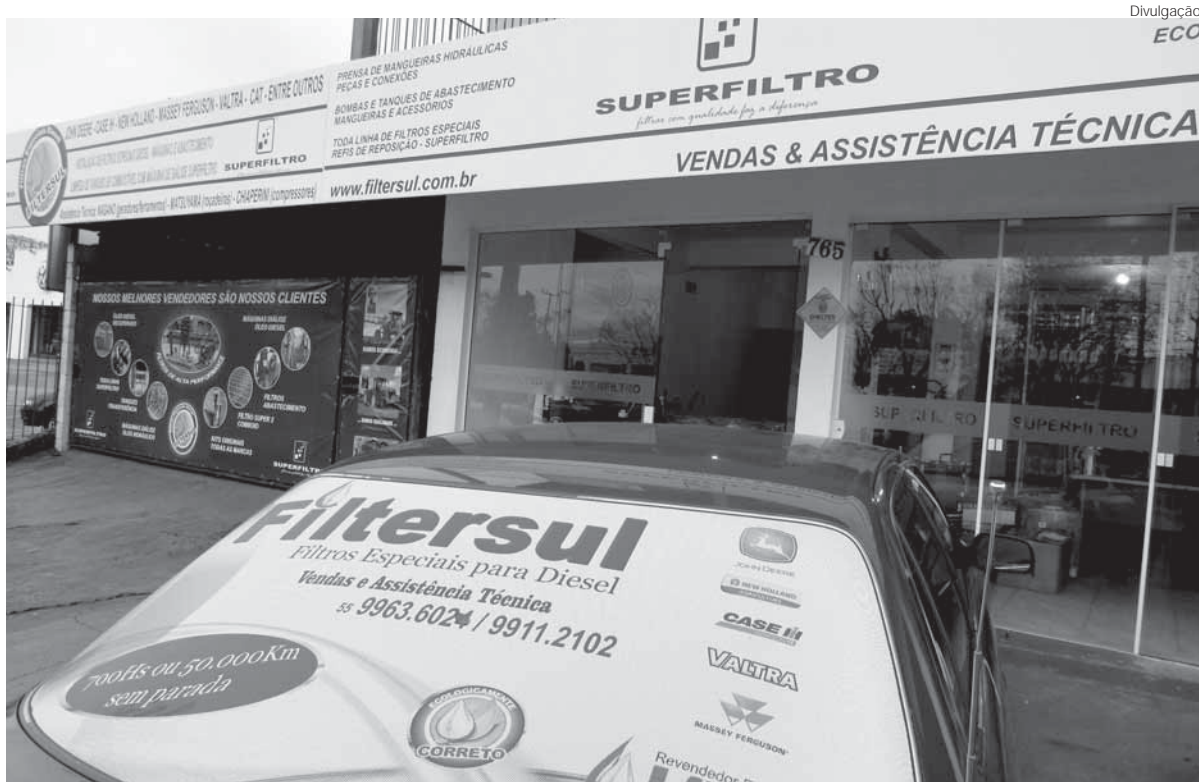
Superfiltro em Santo Ângelo na Av. Ipiranga, 765, Bairro Kurtz

A Superfiltro comercializa filtros para diesel e para óleo hidráulico. Venda no varejo para frotas de veículos e motores agrícolas, rodoviários e industriais