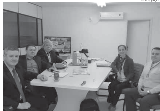
Sede da Cotrisa em Santo Ângelo

As cooperativas Unimed Missões/RS e Cotrisa realizaram renovaram contrato de prestação de serviços de Planos de Assistência à Saúde. A relação de parceria entre as cooperativas data de mais de 40 anos fortalecendo o movimento cooperativo.