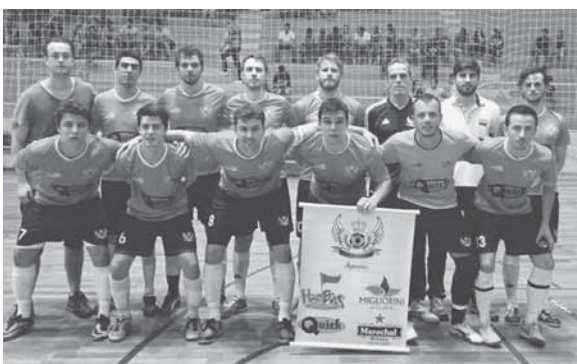
Atletas de Champagnat - Campeão 2015 - 2ª Divisão

Em congresso técnico promovido pela Secretaria de Turismo, Esporte, Lazer e Juventude, na última terça-feira, 23, foram definidas as chaves da 1ª Divisão do Campeonato Municipal de Futsal – Edição 2016. A reunião contou com os representantes das 12 equipes que participam da categoria.