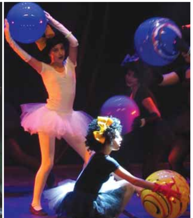
Grupos de dança que realizaram apresentações na primeira noite do evento, quinta-feira, dia 25