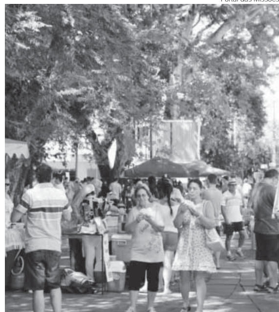
O Brique da Praça acontece todos os domingos pela manhã na praça Ricardo Leônidas Ribas em Santo Ângelo