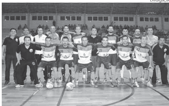
Kangibrina - Campeão 2015 - 1ª Divisão

As disputas da primeira 1ª Divisão começam na sexta-feira, 9 de setembro. Os jogos ocorrem no Ginásio Municipal Marcelo Mioso. Às 20 horas, o Kangibrina enfrenta o Decoration. Após, às 21 horas, a Auto Elétrica Ávila joga contra o Ajax F.C./Lavagem