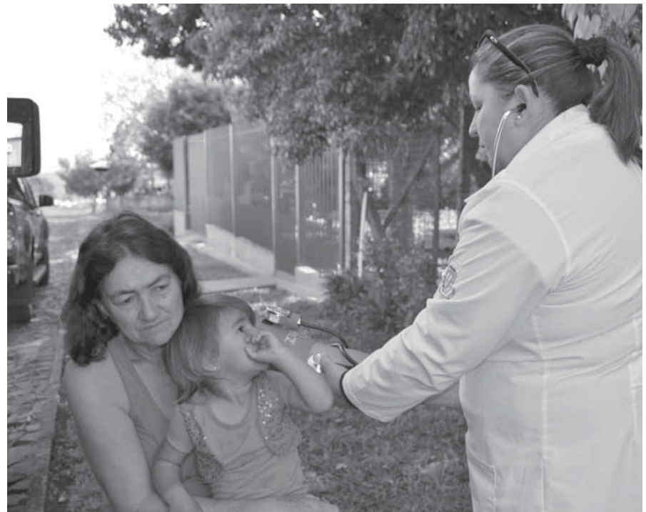
Foram realizadas no Bairro Rosenthal as tradicionais ações de cidadania, obras, promoção à saúde e mutirão de limpeza