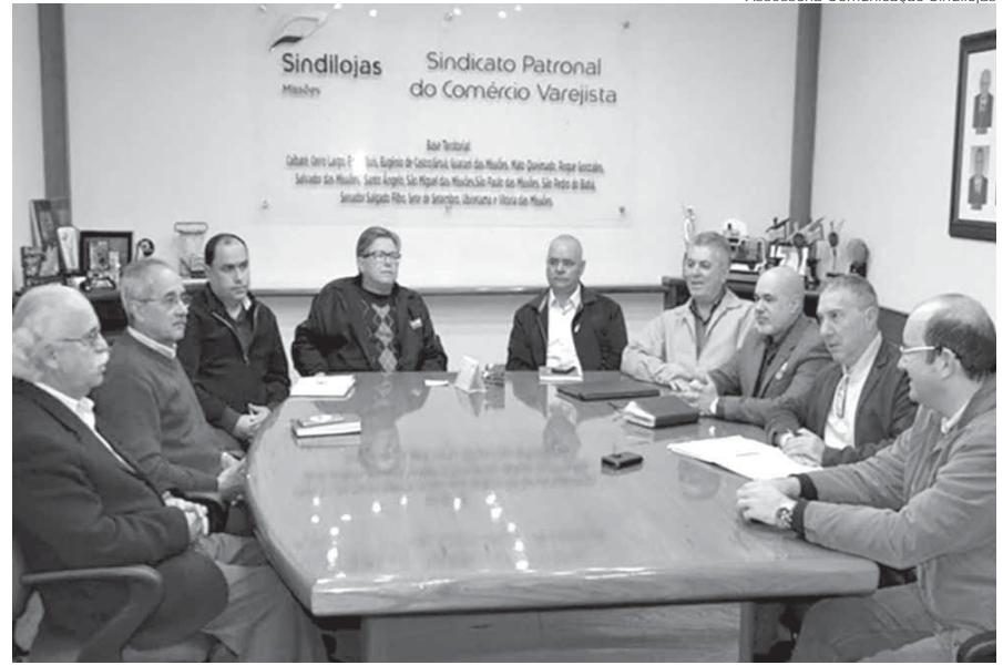
Reunião entre representantes de partidos, entidades empresariais e de ensino superior realizada no Sindilojas