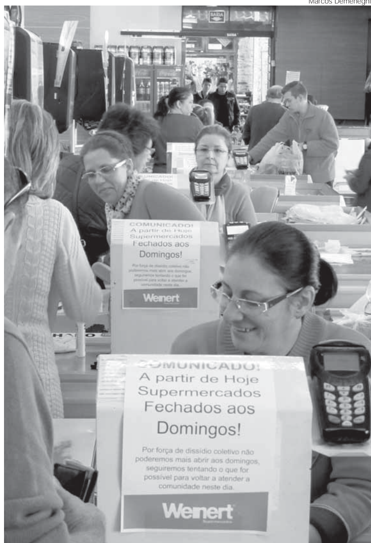
Comunicado fixado nos caixas confirma o fechamento dos supermercados aos domingos

Somente supermercados de economia familiar podem abrir aos domingos e a decisão contemplou uma antiga reivindicação dos Empregados no Comércio.