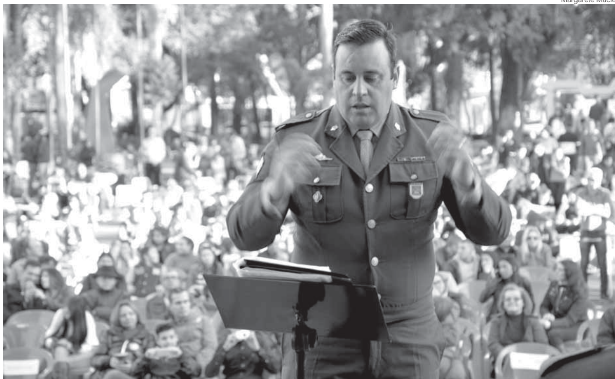
O evento foi realizado na Praça Pinheiro Machado, em frente à Catedral Angelopolitana

Um encontro musical e festivo celebrou os 71 anos do 1º BCom e a Semana do Soldado 2016. A "Banda toca com os Amigos" integrou músicos locais e a Banda do 1º BCom. A comunidade pôde conferir um espetáculo musical que reuniu músicas regionalistas, populares e clássicas.