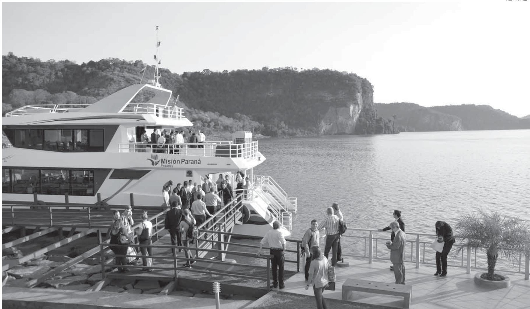
O encontro foi realizado em San Ignacio, na próncia de Misiones na Argentina