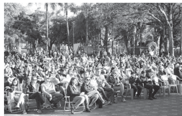
Músicos e interpretes locais se uniram a apresentação da banda realizada na Praça Pinheiro Machado