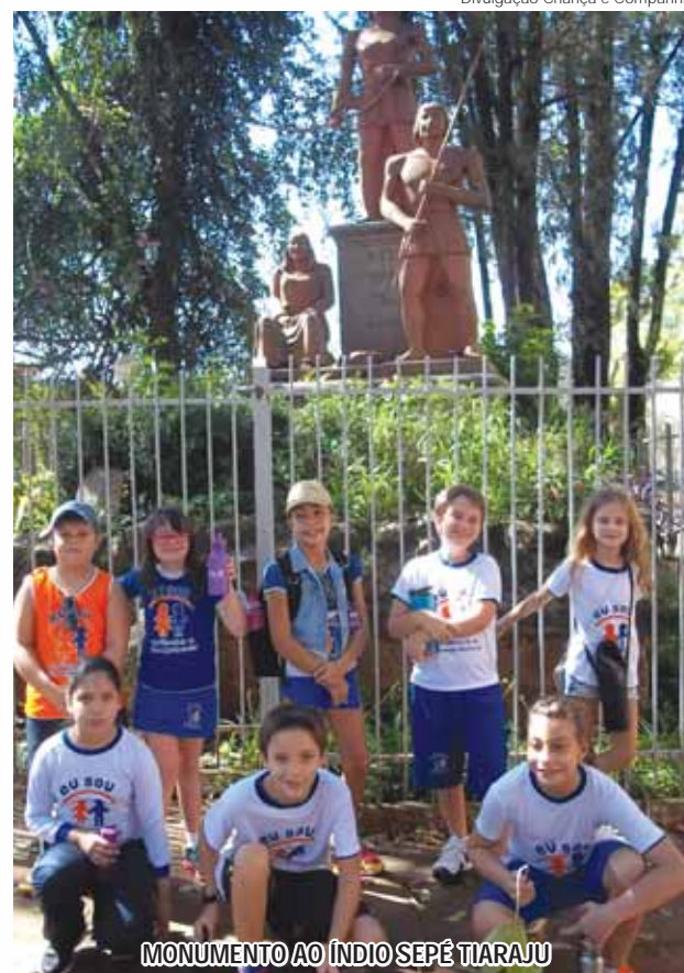
MONUMENTO AO ÍNDIO SEPÉ TIARAJU