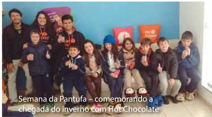
Semana da Pantufa – comemorando a chegada do inverno com Hot Chocolate