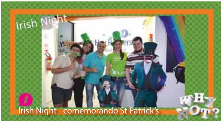
Irish Night - comemorando St Patrick's