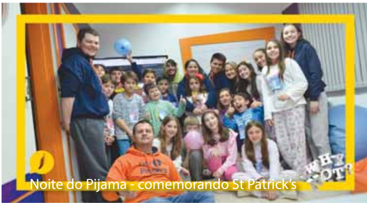
Noite do Pijama - comemorando St Patrick's