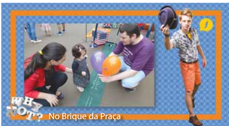
No Brique da Praça

As matrículas para o segundo semestre letivo já estão abertas! A Hey Peppers! está localizada na Rua Sete de Setembro, 1051.