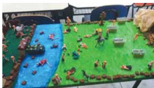
MAQUETE GUERRA GUARANÍTICA

A turma se destacou na construção da maquete sobre a Guerra Guaranítica, demonstrando interesse, envolvimento e sensibilidade com os acontecimentos. A disputa pelas terras entre Portugueses e Espanhóis, gerou revolta por parte dos índios, “Gente Nossa, raiz da terra e da pampa dos Sete Povos Gaúcho”.