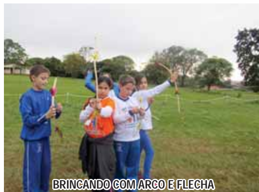
BRINCANDO COM ARCO E FLECHA