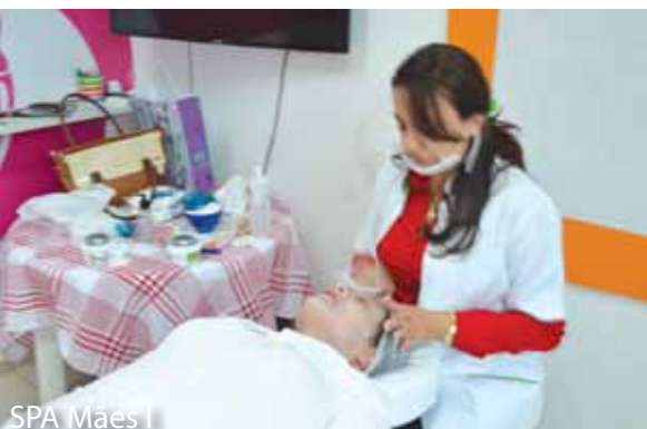
SPA Mães I