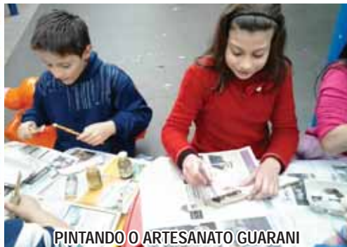
PINTANDO O ARTESANATO GUARANI