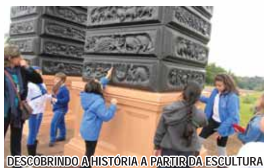
DESCOBRINDO A HISTÓRIA A PARTIR DA ESCULTURA