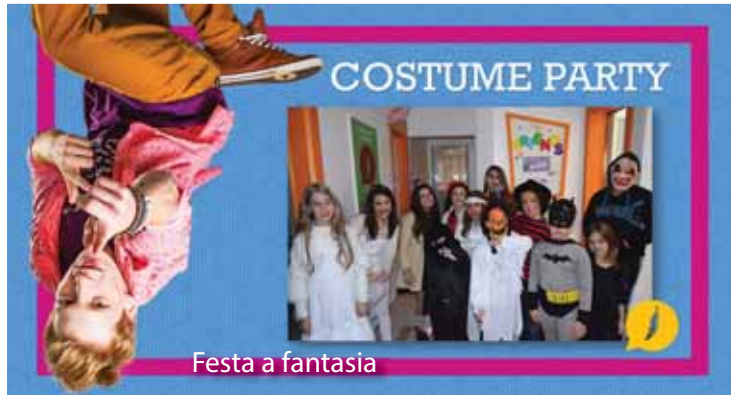
Festa a fantasia