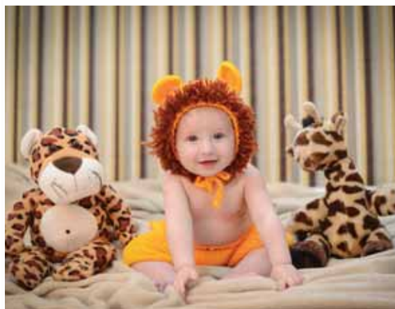
Benício Pizzolato Corim - 6º mês