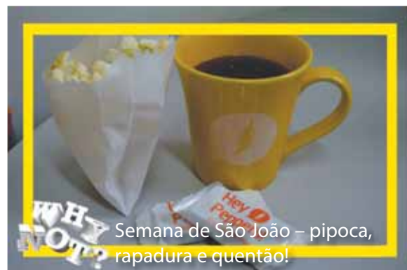
Semana de São João – pipoca, rapadura e quentão!