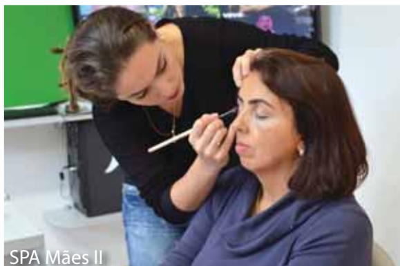
SPA Mães II