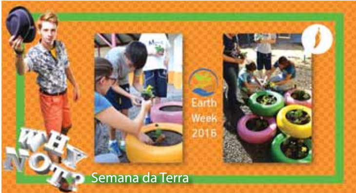
Semana da Terra