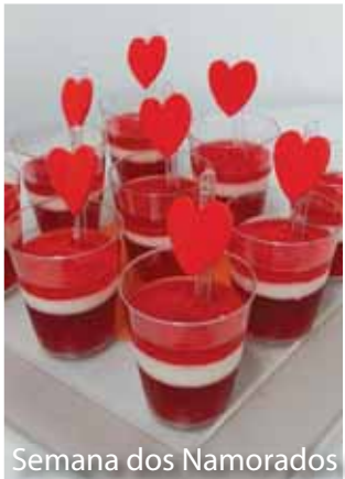
Semana dos Namorados