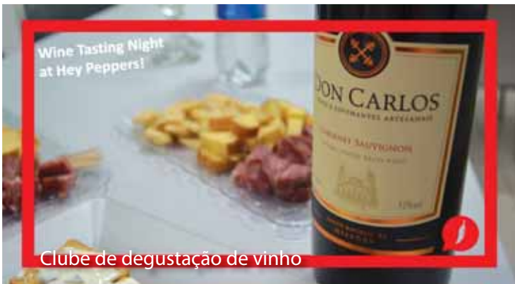
Clube de degustação de vinho