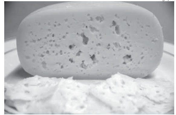
Queijo colonial (imagem meramente ilustrativa)

Estão abertas as inscrições para o 2º Seminário Queijo Colonial Gaúcho, que será realizado no dia 30 de agosto, no Auditório da Sede Administrativa do Parque Estadual de Exposições Assis Brasil, em Esteio, durante a Expointer 2016. O objetivo é discutir sobre a produção e a regulamentação do queijo colonial. Para participar, as inscrições são gratuitas e podem ser feitas no site da Secretaria Estadual de Agricultura, Pecuária e Irrigação (Seapi).