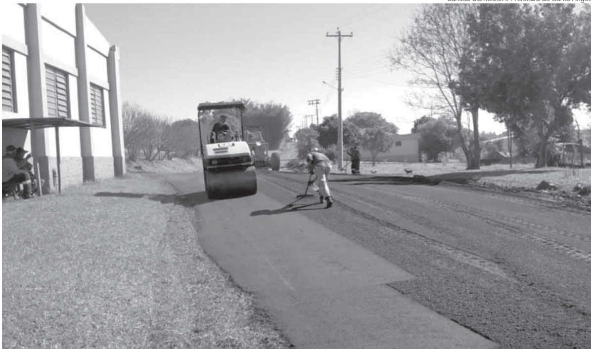
Serviços estão sendo realizados pela Secretaria de Obras e Serviços Urbanos do Município