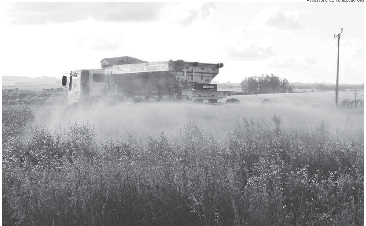
Ações de correção do solo: distribuição de três toneladas de calcário na área

O plantio do milho será realizado em setembro e utilizado para dois estudos: o primeiro, um projeto de Modelagem Matemática desenvolvido por uma estudante do Mestrado em Ensino Científico e Tecnológico, vai calcular o número de parcelas - espaços entre uma planta e outra - e o número de tratamentos pelo qual cada planta terá de passar; no segundo serão testados diferentes tratamentos para a mesma cultivar, com aplicação de nitrogênio, mi-