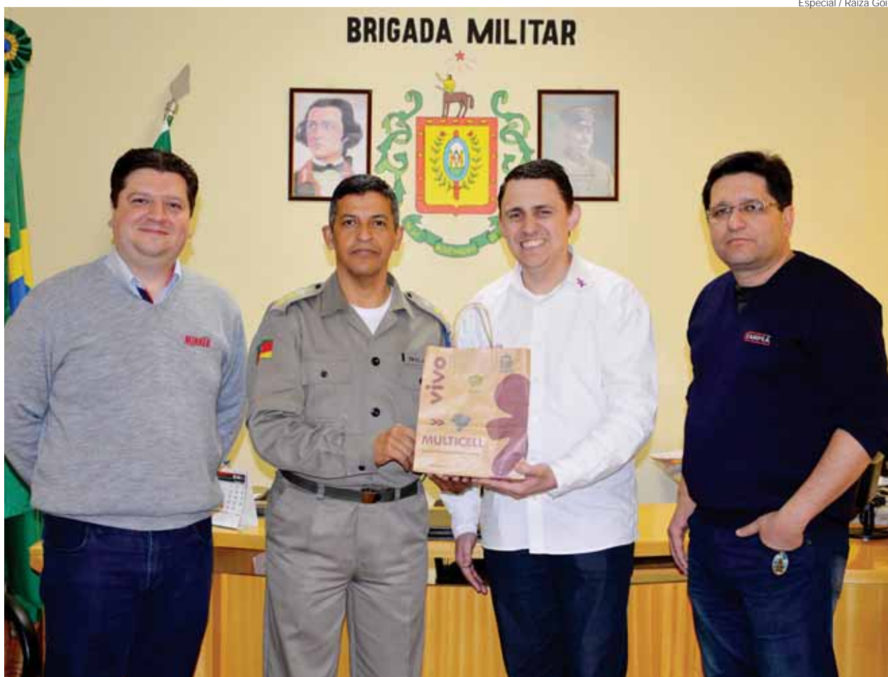
Representantes da ACISA, CDL, SINDILOJAS e MULTICELL realizam entrega ao Ten. Cel. Jornada do equipamento para o serviço de Whatsapp

Porém, o telefone 190 continua como o principal meio de comunicação com a BM.