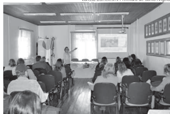
Atividades aconteceram na quarta-feira, dia 10. Ferramenta apoia a gestão das secretarias municipais de Educação