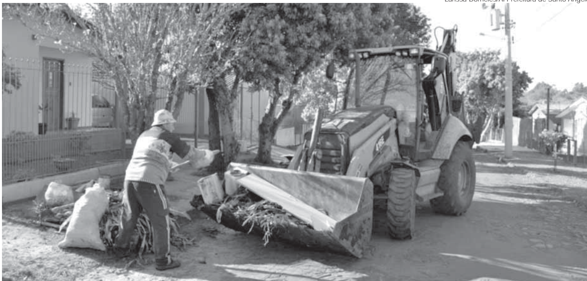
Programa promovido pela Prefeitura Municipal está na 21ª edição