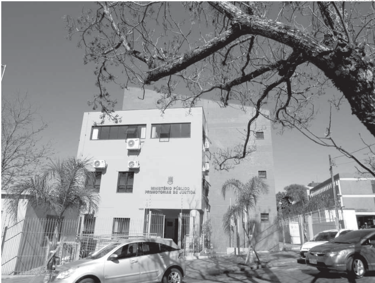
O Cartório da Promotoria de Justiça Cível de Santo Ângelo está localizada na Av. Brasil, 1421, 3º andar e o atendimento é entre às 9h e 11h e das 14h às 17h30min

Estudantes de Direito podem se inscrever para estágio junto ao Ministério Público do Estado. A carga horária é de 30 horas semanais e as inscrições podem ser feitas até o dia 19 de agosto. Os universitários atuarão junto à Promotoria de Justiça Cível de Santo Ângelo e deverão possuir no mínimo 16 anos de idade e estar entre o 4º e 8º semestre do curso.