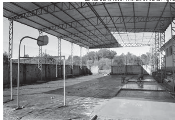
Entre as obras está a cobertura da quadra de esportes