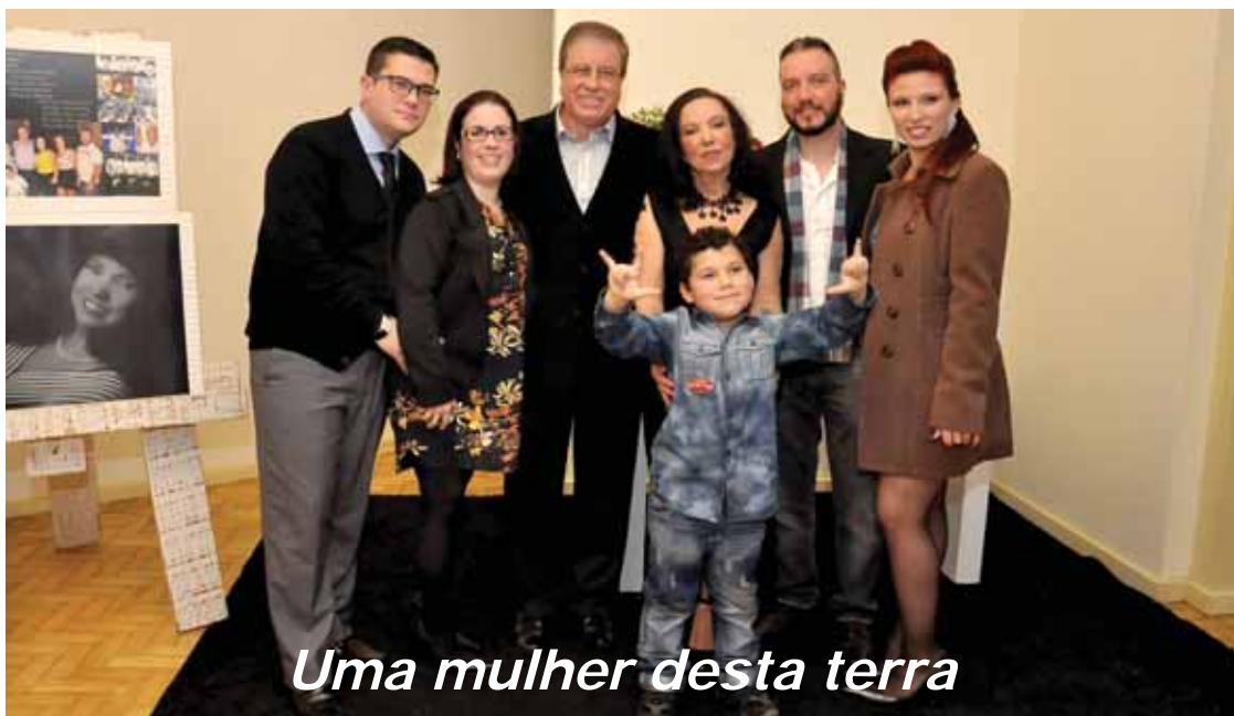
Uma mulher desta terra

O livro e a leitura estão vinculados a uma questão de ordem cultural. Devido à história do Brasil, a partir do processo de descobrimento e colonização, a leitura sempre esteve atrelada a uma elite social e cultural. Em visto disso, o livro por muito tempo foi considerado um bem elitizado, sobre o qual poucos tinham direito, estabelecendo-se, a partir daí, uma larga distância entre o livro e o acesso ao livro pela grande massa populacional. Uma feira de livro tem, antes de qualquer outro objetivo, justamente o de popularizar o livro, permitindo o acesso a todas as pessoas, independentemente de suas condições sociais. Uma feira de livro nada mais é do que um chamamento coletivo, no sentido de fazer com que as pessoas olhem para a leitura, vendo-a e interpretando-a como um bem cultural e reconhecendo-a como um dos principais meios de inserção e interação social. A legitimidade da feira do livro não depende, em vista disso, dos expositores ou unicamente dos autores. Depende essencialmente da participação do povo, da presença das pessoas, do valor que cada um e todos atribuem ao livro e aos escritores. Por essas razões, é de suma importância a realização de uma feira do livro, não só como forma de incentivar a leitura mas, e principalmente, como um evento da comunidade e que deve, por isso, ser prestigiado por todos.