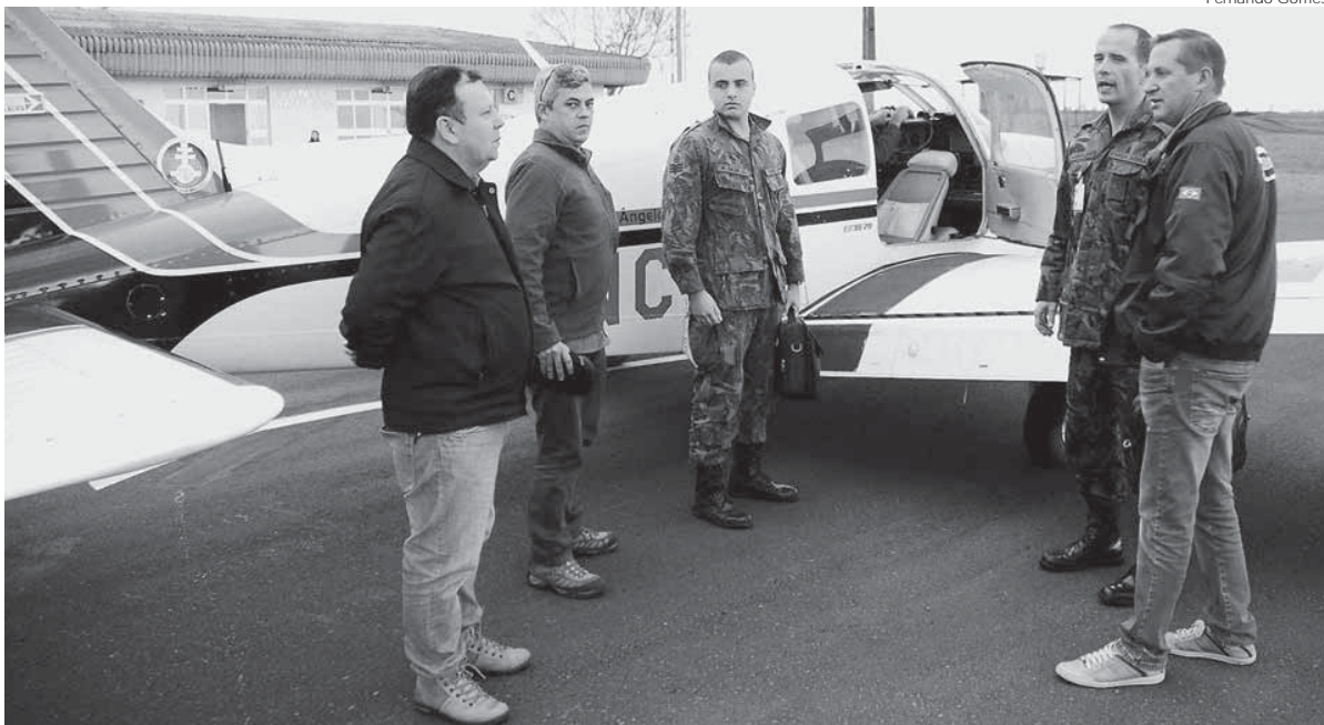
Representantes do Centro Integrado de Defesa Aérea e Controle de Tráfego Aéreo - CINDACTA II chegaram em Santo Ângelo na última terça-feira, dia 2

Trabalho está voltado à averiguação de não conformidades apontadas por vistoria realizada em junho