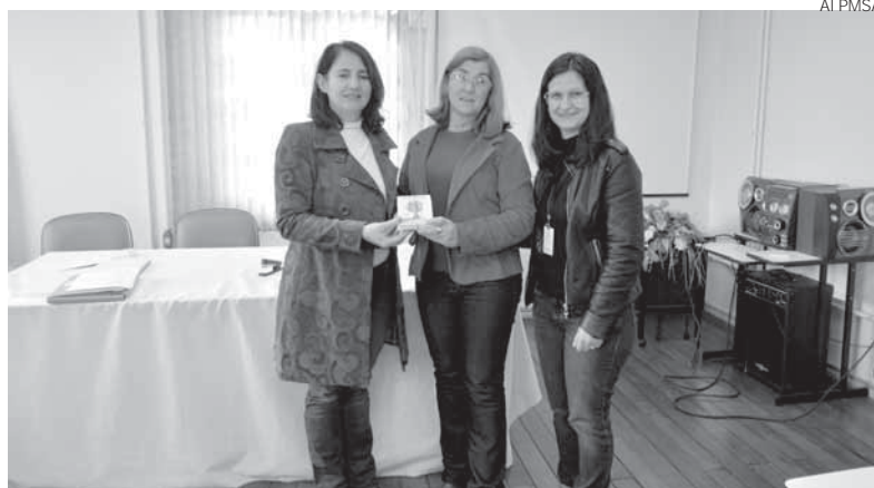
Entrega simbólica aconteceu na última quarta-feira, dia 3

Desde 2013, 4.750 estudantes já foram beneficiados com o vale-