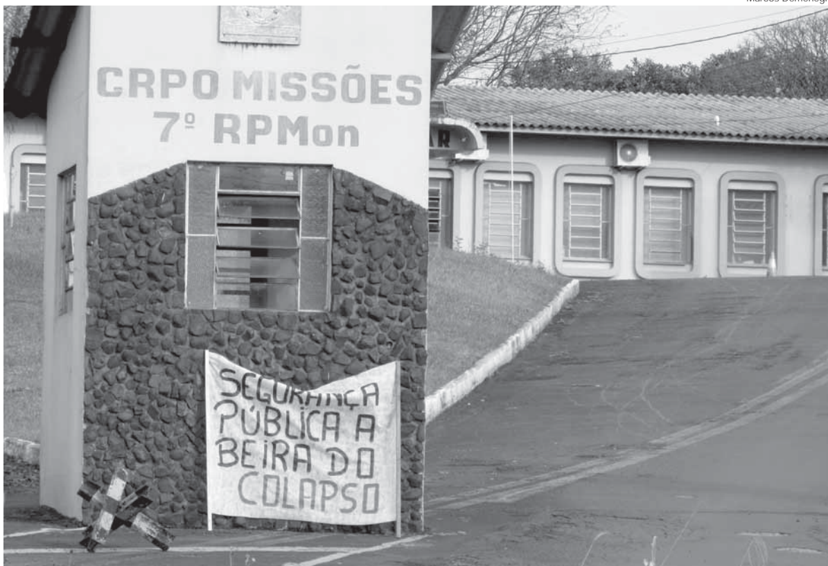
Faixas com manifestações foram colocadas na entrada do 7º RPMon e CRPO Missões

A semana foi marcada de protesto e paralizações em todo o Estado em função do parcelamento de salários dos servidores públicos estaduais. Na quinta-feira, o quartel da Brigada Militar de Santo Ângelo teve a entrada obstruída, além de faixas que mostravam o descontentamento.