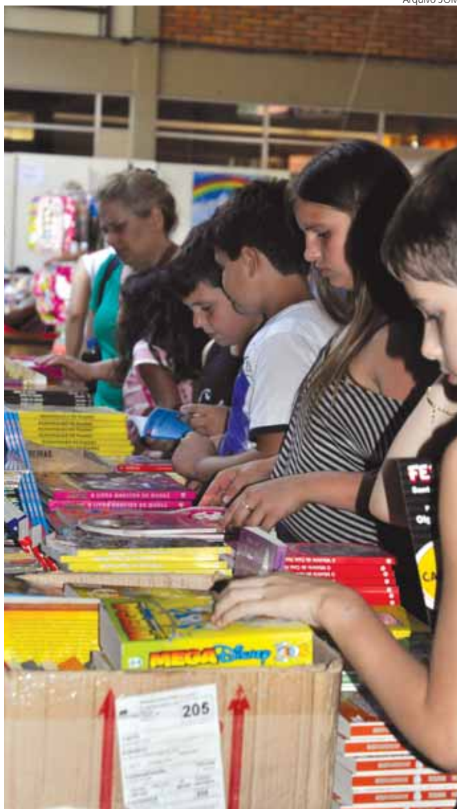
Diversas atividades serão realizadas durante a feira, promovendo a leitura e a literatura

Implantado em 2013, pela atual administração, através da Lei 3.919, de 19 de novembro de 2014, o Vale-Livro terá reedição em 2016. A Feira do Livro é promovida pela Prefeitura de Santo Ângelo através das secretarias de Cultura e Secretaria de Educação.