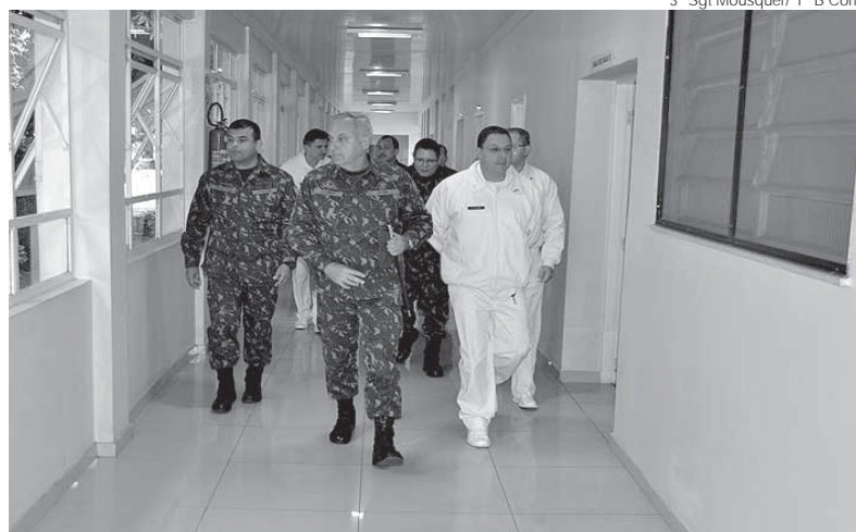
General Valério Stumpf Trindade esteve visitando as instalações do Posto Médico e conhecendo a infraestrutura do local

Dentro do contexto da visita de orientação técnica, os oficiais da 3ª Região Militar veri-