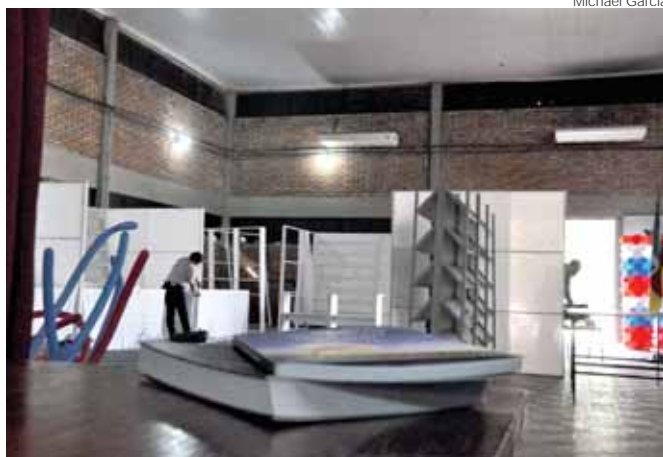
Na tarde de sexta-feira eram realizados os últimos preparativos para o evento que acontece no Centro Municipal de Cultura