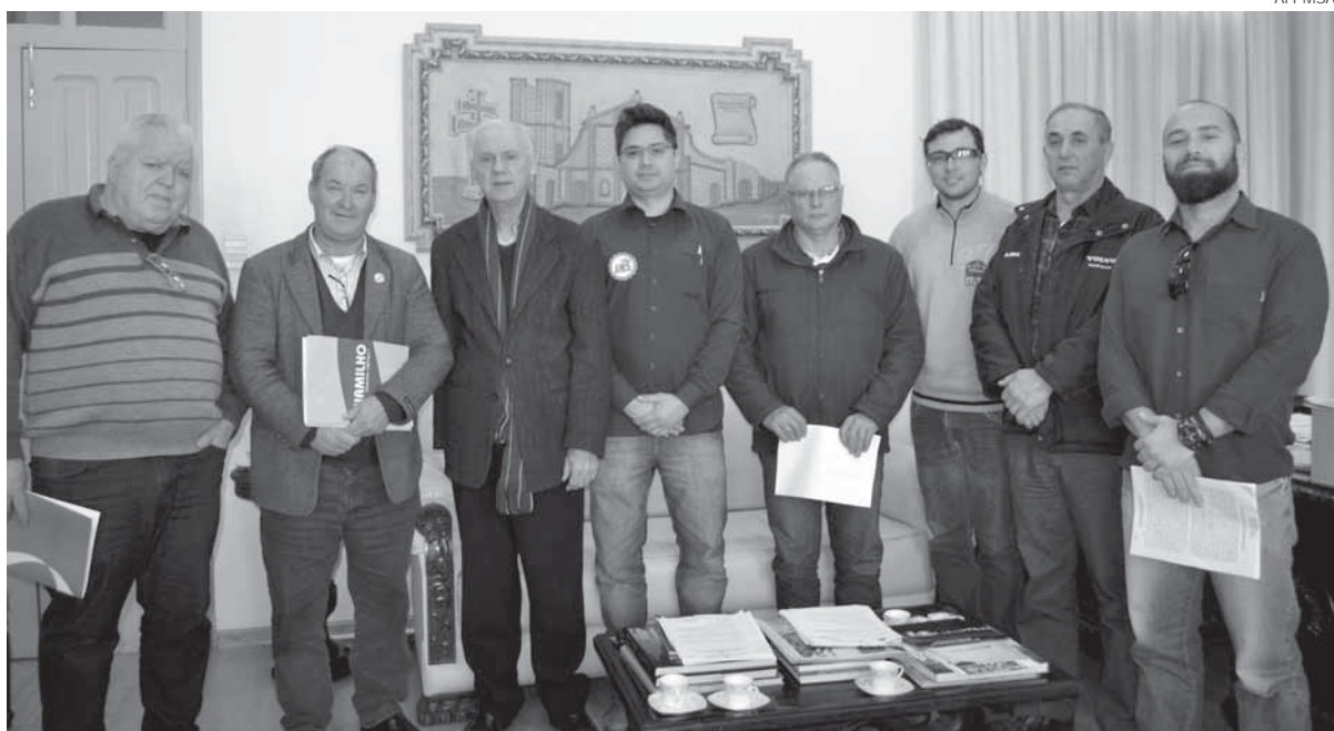
Assinatura de compra e venda de imóveis onde serão instaladas as empresas aconteceu na última quinta-feira, dia 28

Empreendimentos funcionarão no Distrito Industrial Onésimo Belmonte de Araújo