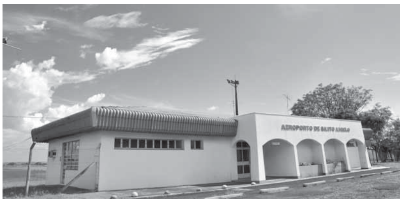
Além das obras de melhorias, Aeroporto está recebendo durante esta semana uma vistoria do CINDACTA II