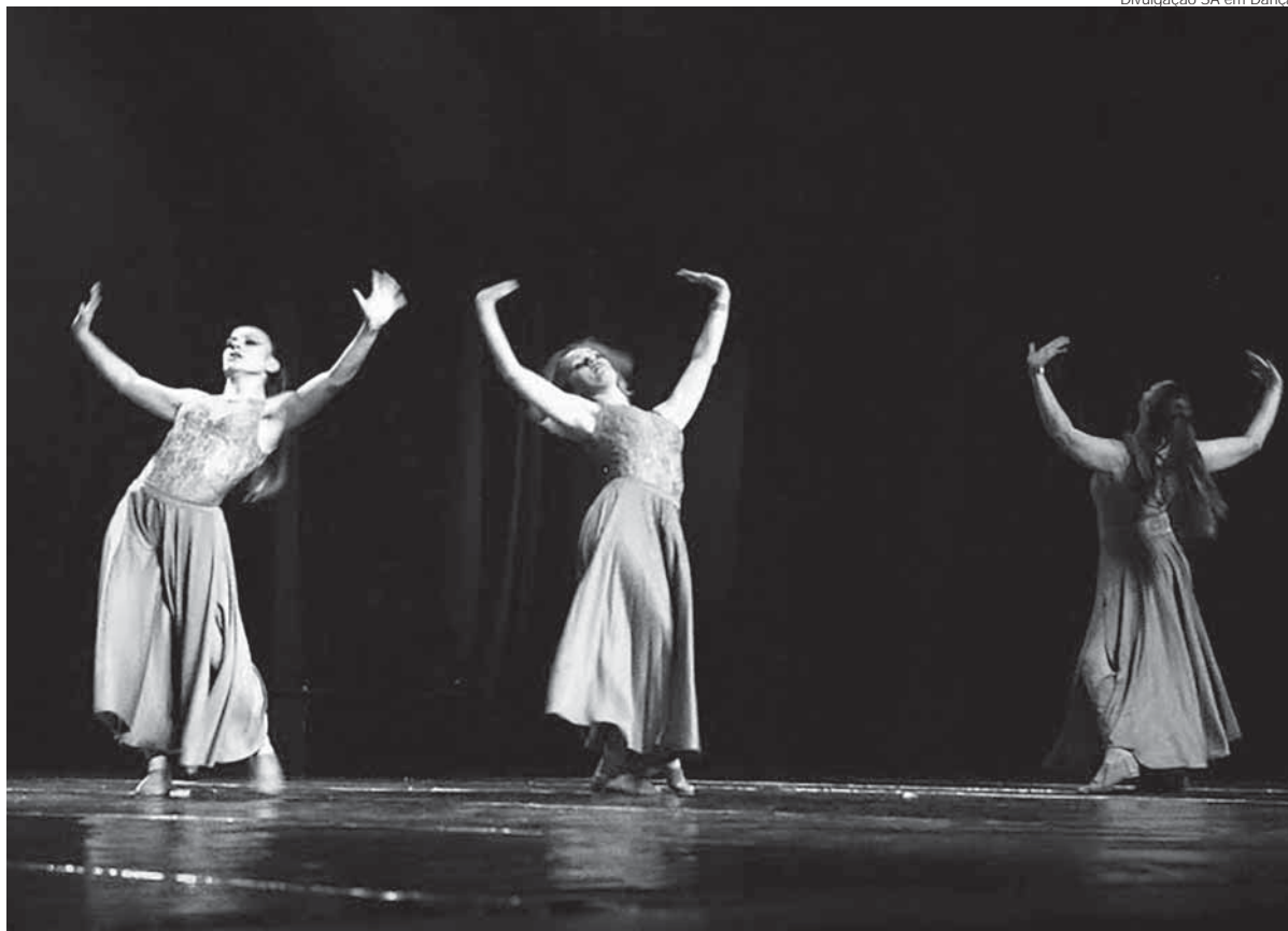
Para esta edição, o evento bateu o recorde de inscrições com mais de 235 coreografias escritas

O maior festival de dança da região das Missões completa 10 anos. Atraindo bailarinos de todo o país, o Santo Ângelo em Dança teve a primeira edição realizada em 16 de agosto de 2006 e desde então movimentou a rede hoteleira e gastronômica da cidade, pois, durante quatro dias, Santo Ângelo se torna a capital da dança no Rio Grande do Sul.