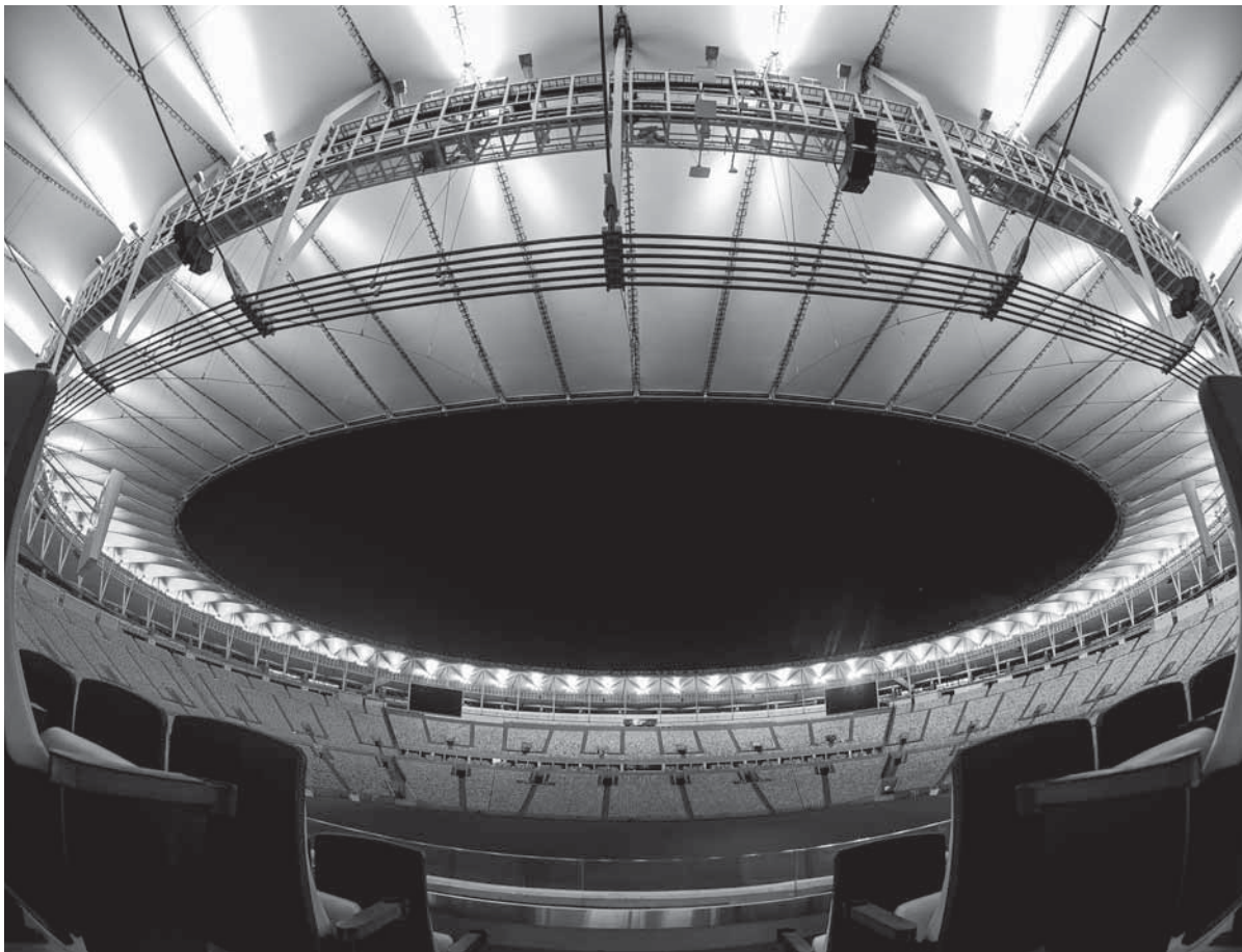
A cerimônia de abertura será realizada na sexta-feira, às 20h no Estádio Maracanã. Pela primeira vez na história o Brasil e a América do Sul recebem uma Olimpíada

Inicia nesta semana o maior evento esportivo do mundo, as Olimpíadas, e o Brasil, assim como a América do Sul, recebe pela primeira vez o evento que reunirá mais de 10.500 atletas de 206 países, além de milhares de turistas de todas as partes do globo.