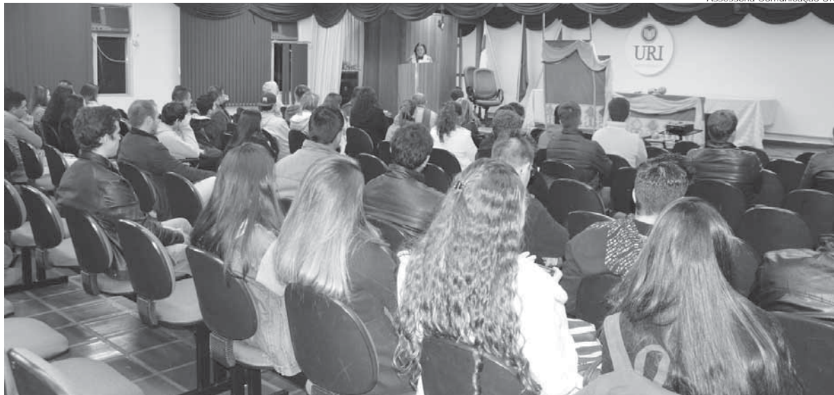
Apresentação teatral aconteceu nas dependências da URI e abordou o universo das lendas indígenas

Os calouros da URI Santo Ângelo participaram, na quinta-feira, dia 28, de uma recepção de volta às aulas. As novas turmas dos cursos de Direito, Engenharia 07a Civil e Engenharia Mecânica, além dos ingressantes nos cursos de Administração, Educação Física – Bacharelado e Licenciatura, Ciência da Computação e Sistemas de Informação assistiram à peça teatral “Cobra Grande”, apresentado pelo grupo A Turma do Dionísio.