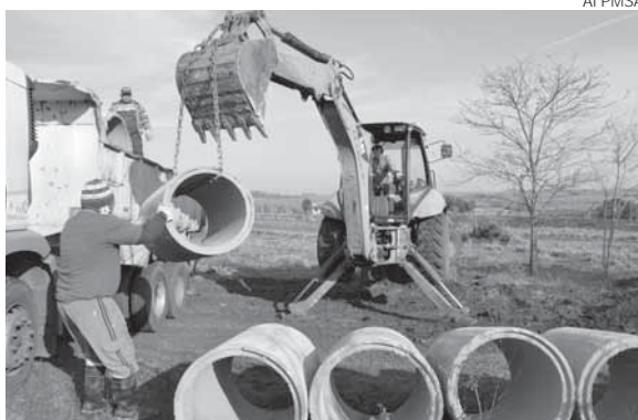
Melhorias no Bairro aconteceram na última sexta-feira, dia 29

Através de uma parceria entre as equipes das secretarias de Obras e Serviços Urbanos e de Meio Ambiente foi realizada a coleta de materiais e lixo descartado pelos moradores, poda de árvores e limpeza em geral. Já a Secretaria de Saúde proporcionou à comunidade do Bairro Indubras o serviço de verificação de pressão arterial e exame de glicose. As equipes da Vigilância Ambiental realizaram trabalho de orientação e visita aos pátios das residências para