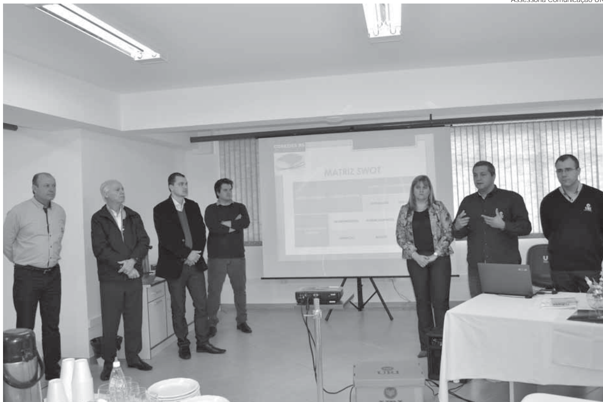
Promovido pela administração municipal, o encontro foi realizado na manhã de ontem, na URI

A Administração de Santo Ângelo realizou na terça-feira, dia 2, a 16ª reunião do Conselho de Desenvolvimento Econômico e Social de Santo Ângelo (CDES/SA) – o Conselhão. O encontro ocorreu na Universidade Regional Integrada (URI).