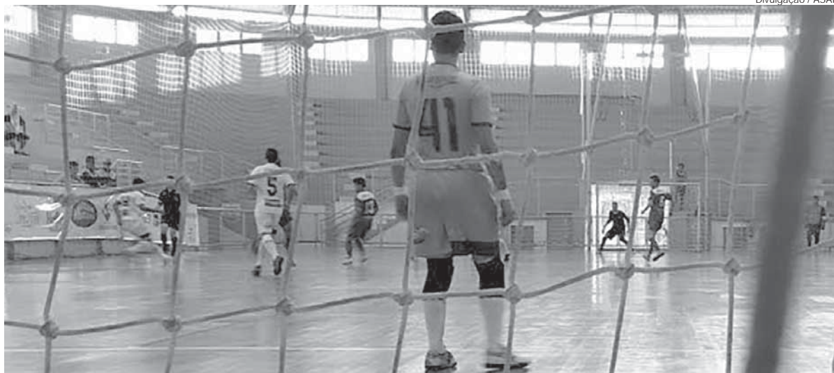
Equipes Sub15, Sub17 e Sub 20 jogam neste domingo no Ginásio Marcelo Mioso

As três categorias de base da Associação Santo Ângelo de Futebol (ASAF), que disputam o Campeonato Estadual, Sub-15, Sub-17 e Sub-20, terão rodada tripla a partir das 15h deste sábado, dia 23, no Ginásio Marcelo Mioso.