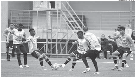
Tricolor treinou durante a semana visando o confronto

O tricolor volta a campo neste domingo, às 16h, contra o São Paulo, na Arena. Visando o duelo, durante treinamento na quinta-feira, o técnico Roger Machado dividiu o trabalho em duas partes distintas.