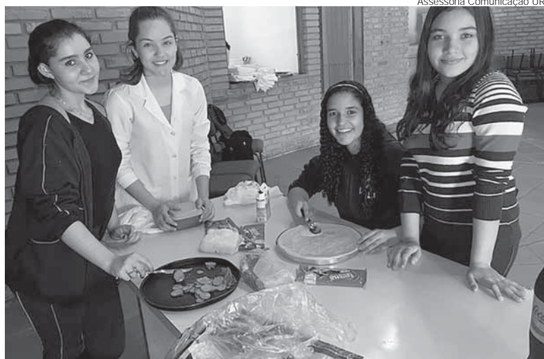
Assessoria Comunicação URI

Durante as atividades, estudantes selecionaram e organizaram receitas com alimentos que seriam descartados, como cascas de frutas e talos de legumes