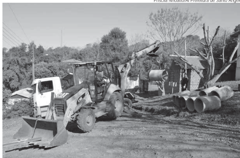
Ações foram realizadas na última quinta-feira, dia 21

Além disso, outra equipe da Secretaria de Obras e Serviços Urbanos realizou uma força tarefa para a melhoria da infraestrutura do bairro, executando a tradicional operação tapa-buracos e reparos na iluminação pública. Também foram instalados