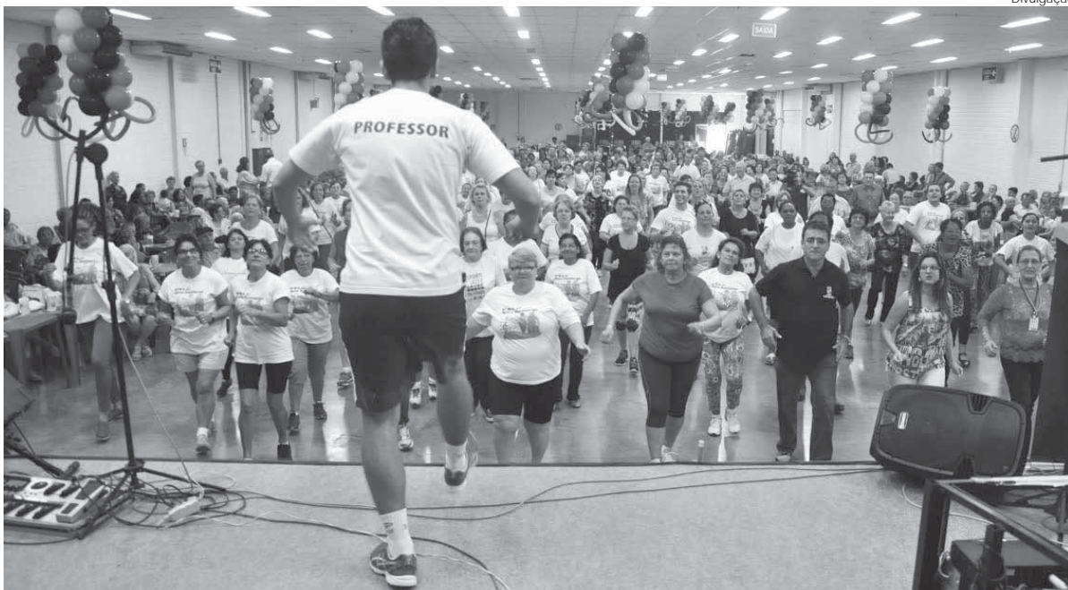
Atividades físicas do programa são orientadas por profissionais e acontecem três vezes por semana

O ministro do Esporte, Leonardo Carneiro Monteiro Picciani confirmou a destinação de recursos para a implantação de seis núcleos do Programa Esporte e Lazer da Cidade (PELC) em Santo Ângelo. A confirmação ocorreu durante audiência entre o prefeito de Santo Ângelo, Valdir Andres e o vereador Marcos Mattos com o ministro.