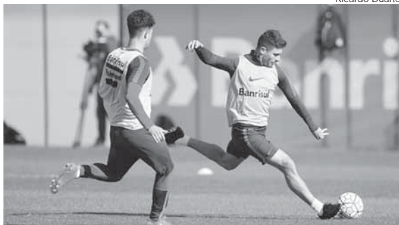
Inter busca fora de casa a reabilitação no Brasileiro

Com sete rodadas sem vitória o Internacional volta a campo às 11h de amanhã, contra a Ponte Preta, no Moisés Lucarelli, buscando a reabilitação no Campeonato Brasileiro.