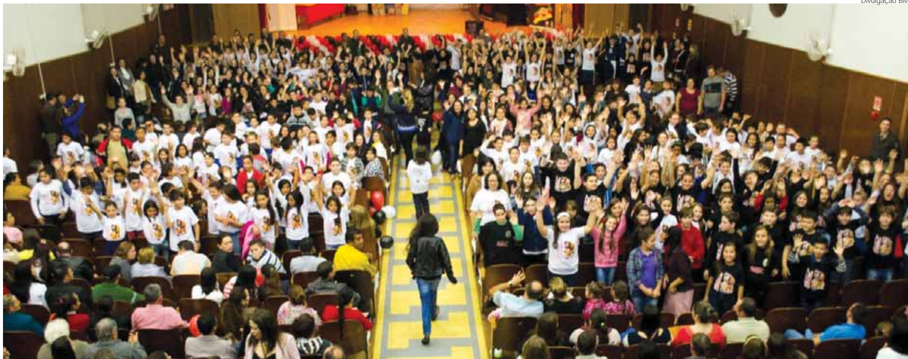
Solenidade de formatura ocorreu no Auditório do Colégio Tereza Verzeri

Um total de 648 alunos dos 5 a e 7 a ano de Escolas da Rede Municipal, Estadual e Particular de ensino do município de Santo Ângelo se formaram no 1 o Semestre do Programa de Resistência às Drogas e a Violência - Proerd. A formatura ocorreu na noite da última quarta-feira, dia 13, no Auditório do Colégio Tereza Verzeri em Santo Ângelo.