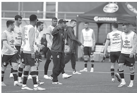
Tricolor treinou na última quinta-feira

O Grêmio enfrenta o Sport, em Recife, neste domingo, às 18h30min. No treinamento ocorrido na tarde da última sexta-feira, o técnico Roger Machado encaminhou o time que deve ir a campo contra os pernambucanos na Ilha do Retiro.