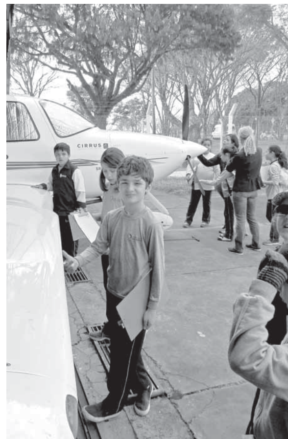
Aberto a visitação da comunidade, o Aeroclub de Santo Ângelo cumpre a função de entidade de utilidade pública federal