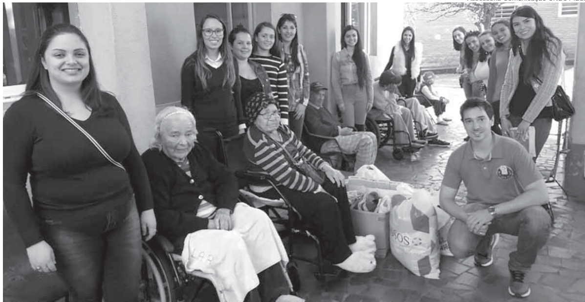
Lar da Velhice Suzana Wesley, Centro de Acolhimento Martinho Lutero e o Lar da Velhice Izabel Oliveira Rodrigues receberam doações

Os acadêmicos e professores do curso de Ciências Contábeis da CNEC/IESA realizaram a entrega das roupas, cobertores e calçados que foram arrecadados através do Brechó Solidário. Três entidades receberam as doações: Lar da Velhice Suzana Wesley, o Centro de Acolhimento Martinho Lutero e o Lar da Velhice Izabel Oliveira Rodrigues.