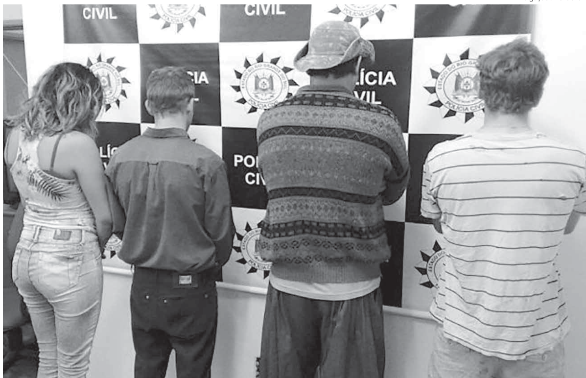
Criminosos foram presos pela Polícia Civil e conduzidos para o sistema prisional de Cerro Largo

Policiais da Delegacia de Polícia de Guarani das Missões executaram a fase final da Operação Abate em Cerro Largo, Santo Ângelo, São Pedro do Butiá e Rolador em cumprimento a dez mandados de busca e apreensão na manhã de ontem.