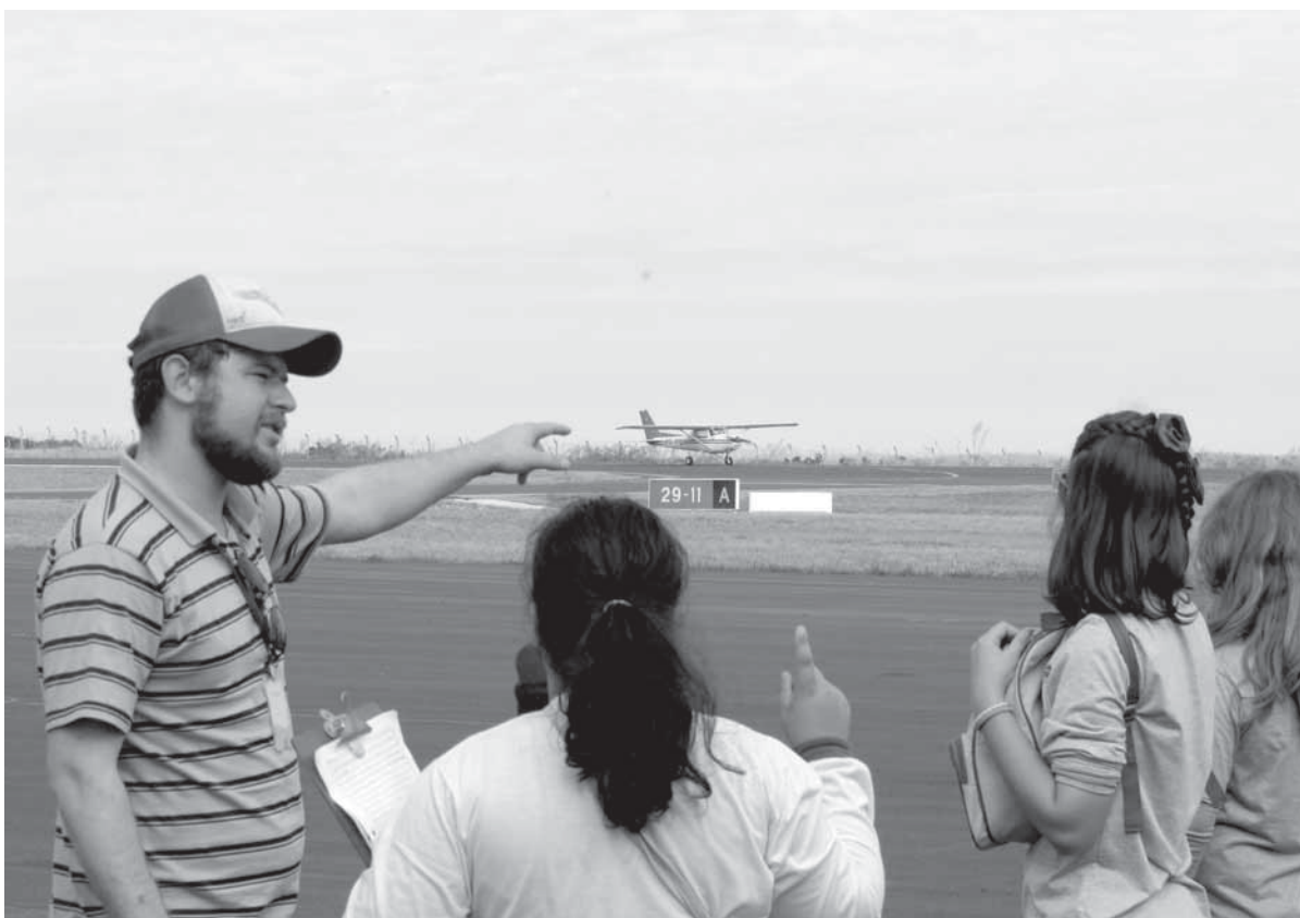
Alunos do Colegio Sepé observam o pouso de uma aeronave na pista do Aeroporto Sepé Tiaraju

Dalla Porta reafirmou que o aeroclube está aberto para a visita da comunidade e desde que o aeroporto voltou a operar, a entidade está recebendo intenso movimento aos finais de semana. Além disso, está com inscrições abertas para cursos de pilotagem.