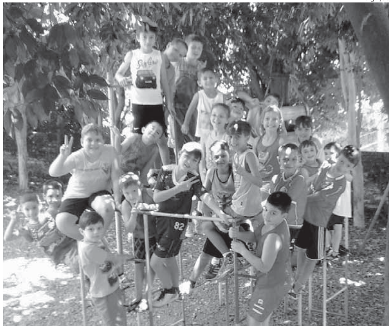
Colônia de Férias será oferecida para crianças dos 5 anos aos 11 anos

mento, em cada semana, será de R$ 80,00 com lanche incluso. As crianças serão divididas em dois grupos e a colônia é