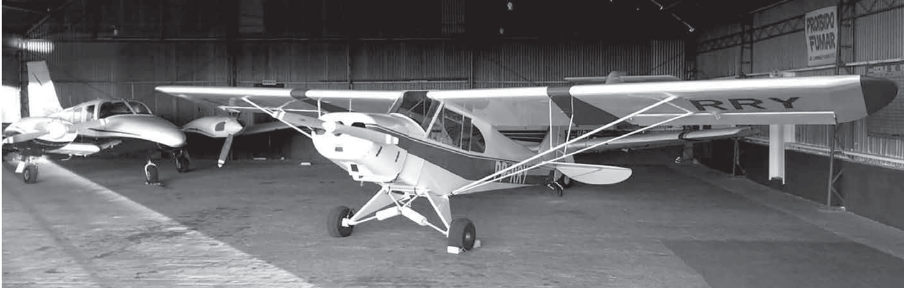
PP-RRY fabricado no ano de 1945 no hangar do Aeroclub de Santo Ângelo

A PP-RRY é a primeira aeronave do Aeroclub de Santo Ângelo, foi fabricada em 1945 e está totalmente recuperada. Este veículo é considerado uma ferramenta indispensável para o aprendizado de voo experimental