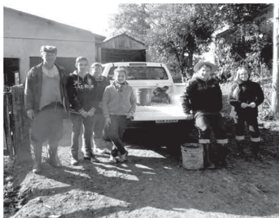
Bolsistas do projeto realizam visita técnica em propriedade de agricultor - coleta de esterco bovino e urina para biofertilizante

O projeto possui grande importância para o desenvolvimento regional, já que, segundo o Censo Agropecuário do IBGE de 2006, o município de Santo Ângelo possui um rebanho bovino de 25 mil cabeças de gado, tendo 4700 vacas ordenhadas, produzindo diariamente cerca de 45 mil litros de leite.