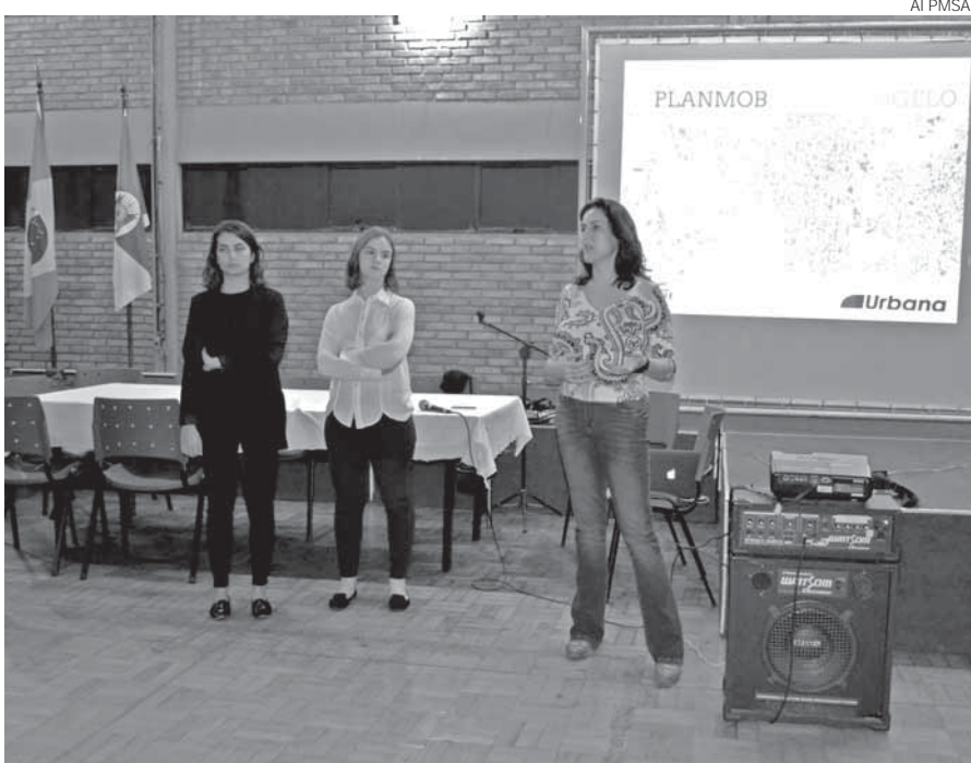
Reunião aconteceu no Centro Municipal de Cultura. Durante o evento foram apresentadas as propostas que integram o Plano Municipal de Mobilidade Urbana (PlanMob)

Na última segunda-feira foi realizada uma Audiência Pública para debater as propostas para o Plano de Mobilidade Urbana