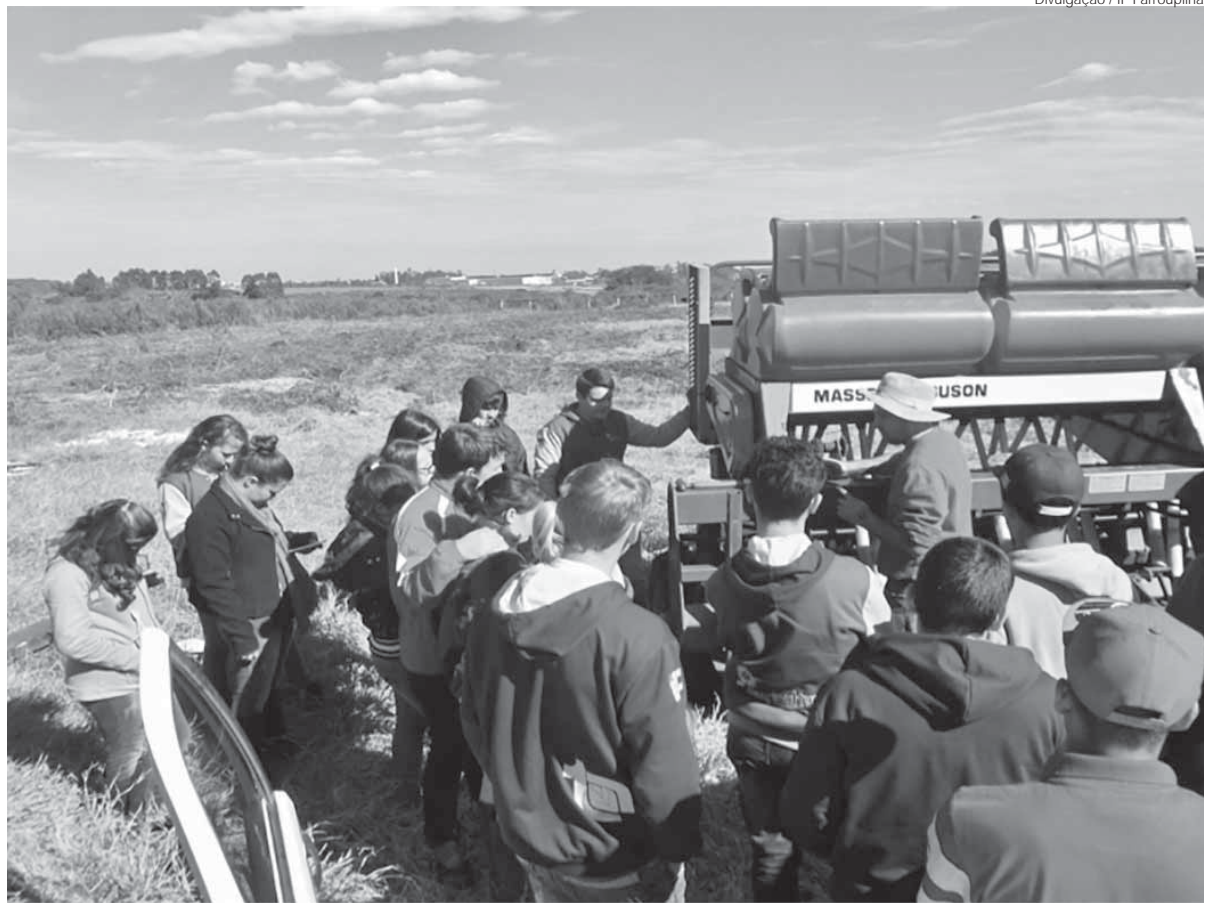
Acompanhamento prático da regulagem da semeadeira e plantio das gramíneas