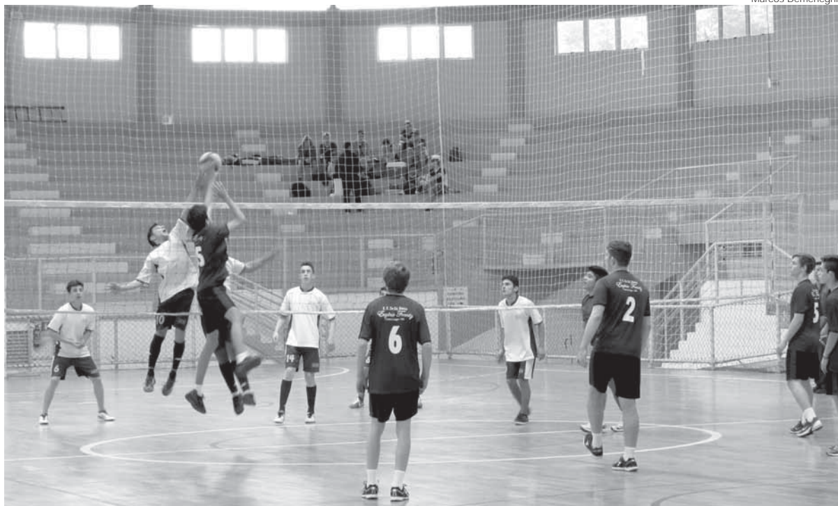
Equipe juvenil do Unirio Carreira Machado e Eugênio Frantz (Cerro Largo) disputaram partida de volei na quadra do Marcelo Mioso

Santo Ângelo é anfitriã da etapa de Coordenadoria dos JERGS - Jogos Escolares do Rio Grande do Sul. Iniciou ontem, dia 12 com as disputas de vôlei e continua até a próxima terça-feira, dia 19. Nesta fase, Santo Ângelo recebe cerca de 800 alunos da rede estadual de educação de toda a região. Enfrentam-se equipes que ganharam em cada um dos 11 municípios que compõem a 14ª CRE – Coordenadoria Regional de Educação. As modalidades esportivas são: Voleibol, xadrez, futsal, atletismo, basquetebol e handebol.