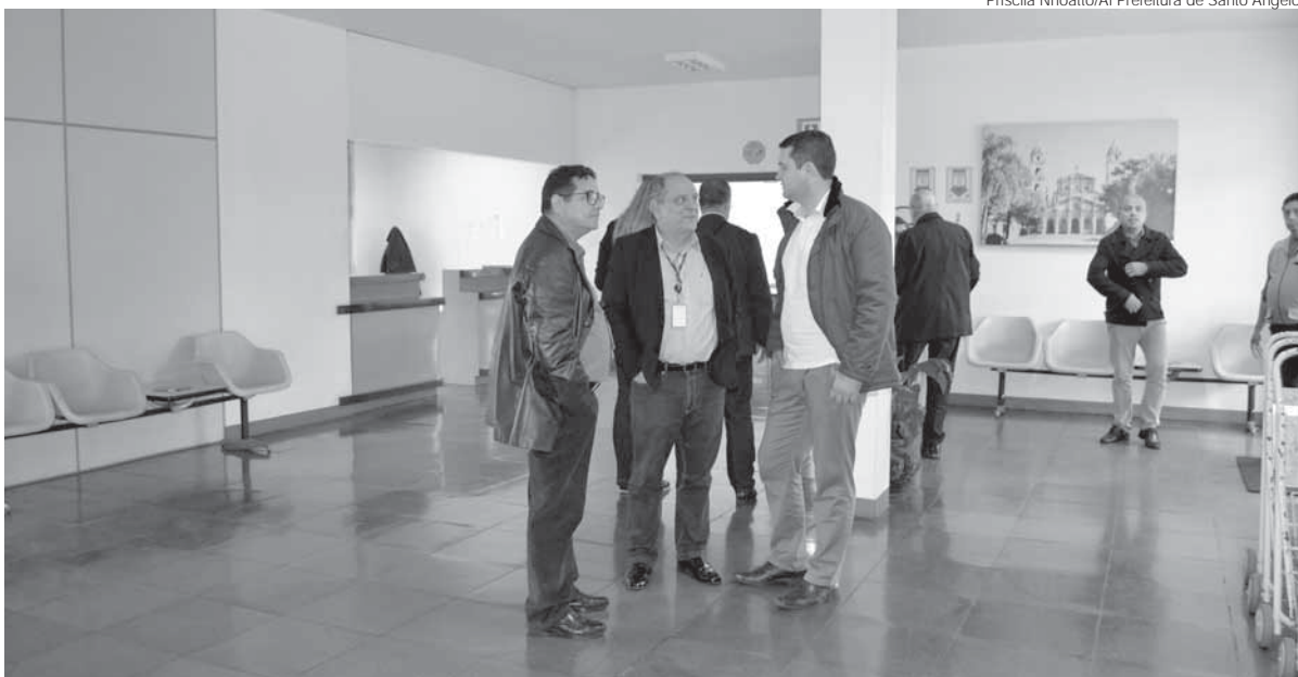
Visita técnica de representantes da azul linhas aéreas ocorreu na terça-feira, dia 12