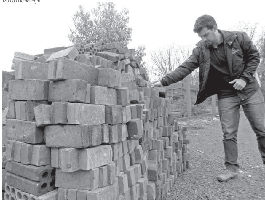
Tijolos antigos são revendidos para obras estilizadas