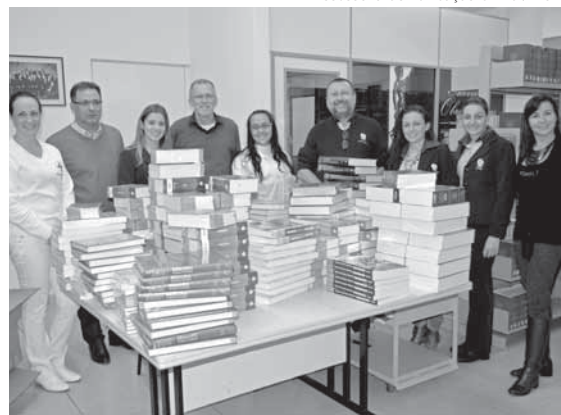
Biblioteca da CNEC/IESA também é aberta para a comunidade

A biblioteca Ministro Ulysses Rodrigues da CNEC/IESA Santo Ângelo, renovou seu acervo, recebendo importantes livros. Exemplares de várias áreas do conhecimento, abrangendo os cursos da saúde, tecnologia e Direito já estão disponíveis aos alunos da Instituição. No total, a biblioteca recebeu 460 novos livros, oferecendo assim uma ampla variedade de materiais para suprir as necessidades dos alunos nas pesquisas acadêmicas.