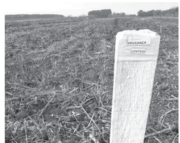
Parcela experimental com consórcio de Centeio/Ervilhaca