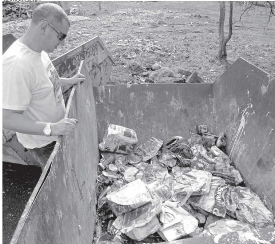
Latas de solvente e tinta a base de óleo geram custo aos prestadores de serviço

Diariamente são produzidos no município de Santo Ângelo quase 80 m 3 de resíduos de construção. A classificação e o reaproveitamento foram às únicas saídas para o setor continuar ativo no município, pois desde que a nova Política Nacional de Resíduos Sólidos foi publicada no ano de 2012, não é possível depositar este tipo de material nos aterros sanitários da região.