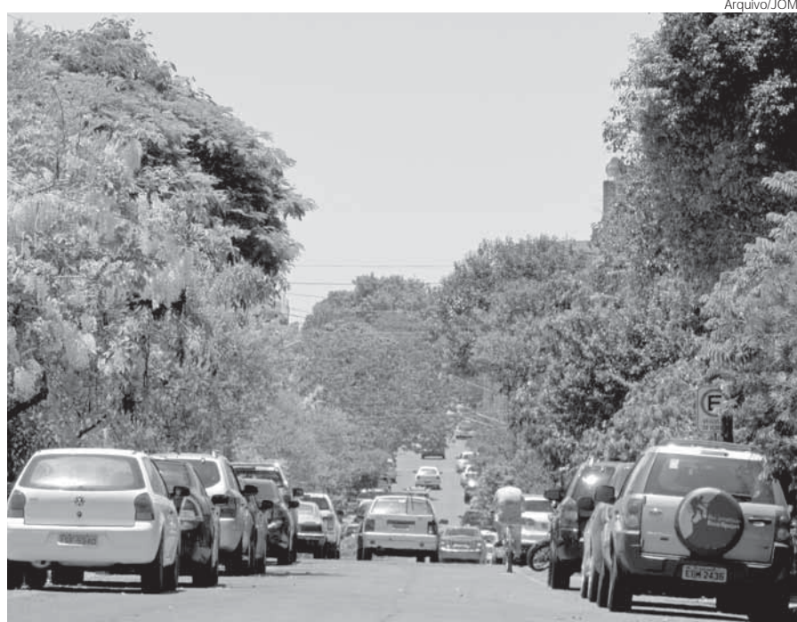
O Plano Municipal de Mobilidade Urbana é um dos requisitos exigidos aos municípios que desejam obter verbas governamentais para a mobilidade

O Plano Municipal de Mobilidade Urbana é um dos requisitos exigidos pela Secretaria Nacional de Transporte e Mobilidade aos municípios que desejam obter verbas governamentais para a mobilidade. Além disso, o PlanMob está estabe-