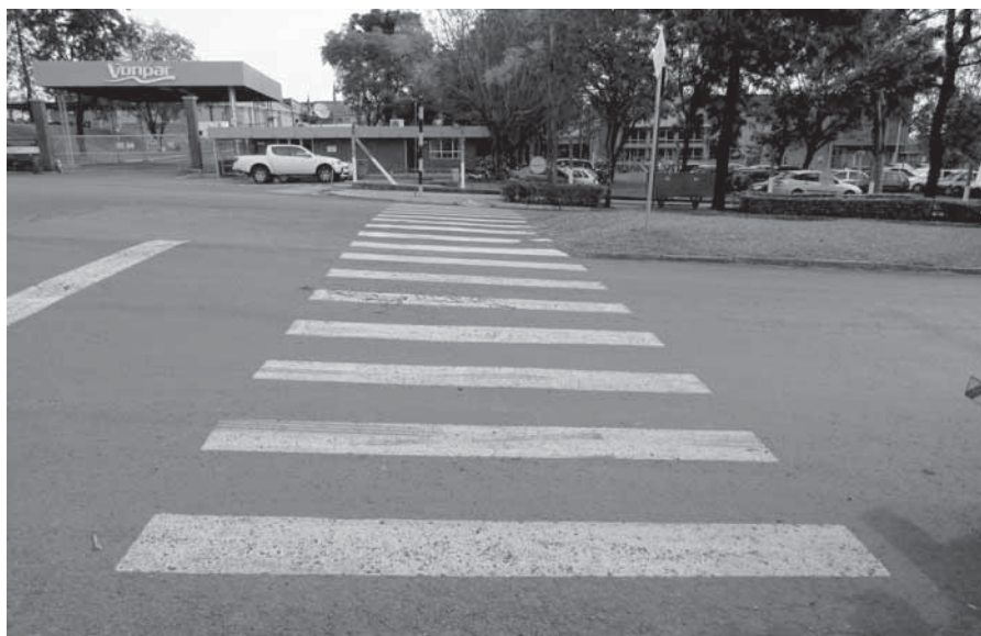
Ponto de partida da Tocha Olímpica em Santo Ângelo será em frente da Vonpar

Durante o trajeto, as ruas percorridas serão fechadas. É solicitado a população evitar estacionar os veículos nas vias onde haverá o revezamento, a partir das 11 horas. Após esse horário, os veículos estacionados deverão permanecer no local até o encerramento das atividades.