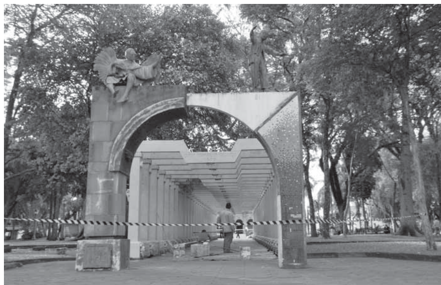
Chegada será na Praça Pinheiro Machado