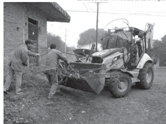
Atividades foram nos Bairros Aurora, Dido 2, Ditz e Tesche