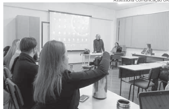
Seminário aconteceu na última terça-feira, dia 21 e foi realizado pelo doutorado e mestrado em direito da URI