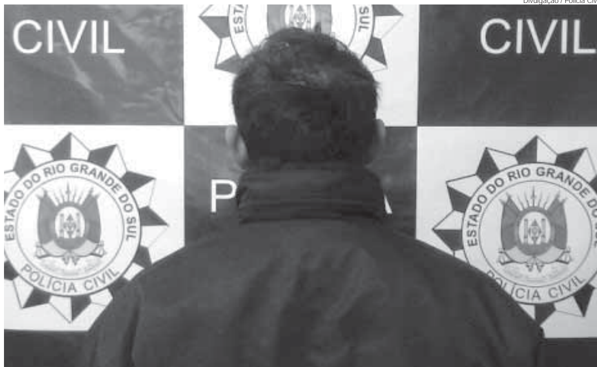
Homem foi preso pela Polícia Civil no Bairro Parque Industrial

Um homem de 39 anos foi preso na manhã da última quinta-feira, dia 23, pela Polícia Civil em Santo Ângelo. A prisão aconteceu no Bairro Parque Industrial, na zona leste de Santo Ângelo e foi feita por policiais civis da Delegacia Especializada no Atendimento à Mulher (DEAM). A ação foi coordena-