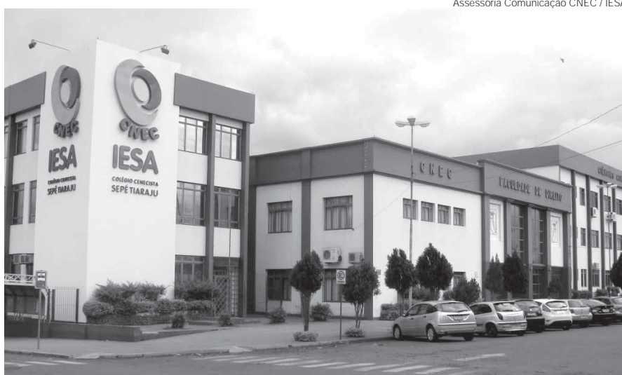
No total, 63 vagas foram disponibilizadas para a Instituição

As inscrições para o processo seletivo FIES devem ser realizadas no período de 24 a 29 de junho, exclusivamente pela internet, através do endereço http://fiesselecao.mec.gov.br . A inscrição é gratuita.