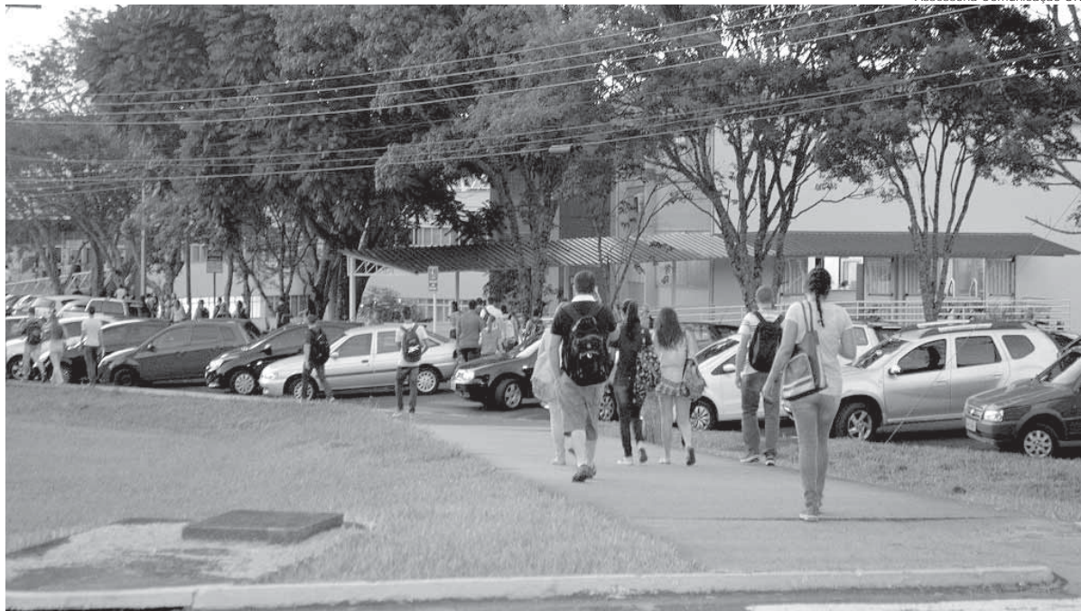
Matrículas devem ser feitas no prédio 20 da URI Santo Ângelo

Até dia 5 do próximo mês, permanece aberto o prazo para a realização de matrícula com uso da nota do Enem na URI Santo Ângelo. A universidade conta com vagas disponíveis nos cursos de Direito, Engenharia Civil, Engenharia Mecânica, Ciência da Computação, Sistemas de Informação e Administração. Além de ter concluído o Ensino Médio, as exigências incluem ter registrado no mínimo 20% de aprovei-