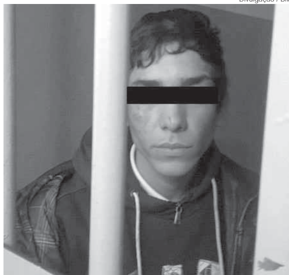
Acusado foi preso e foi conduzido para a Delegacia de Polícia

Diante dos fatos a vítima foi até o ponto de táxi no qual trabalha e pediu ajuda. O acusado foi dominado pela vítima e alguns colegas de trabalho, momento em que os policiais militares chegaram ao local, revista-ram e encontraram um Revólver Calibre 38, com seis munições intactas, o revólver era produto de furto da cidade de Tiradentes do Sul. O indivíduo de iniciais C.R.O foi preso em flagrante e encaminhado à Delegacia de Polícia para os procedimentos legais.