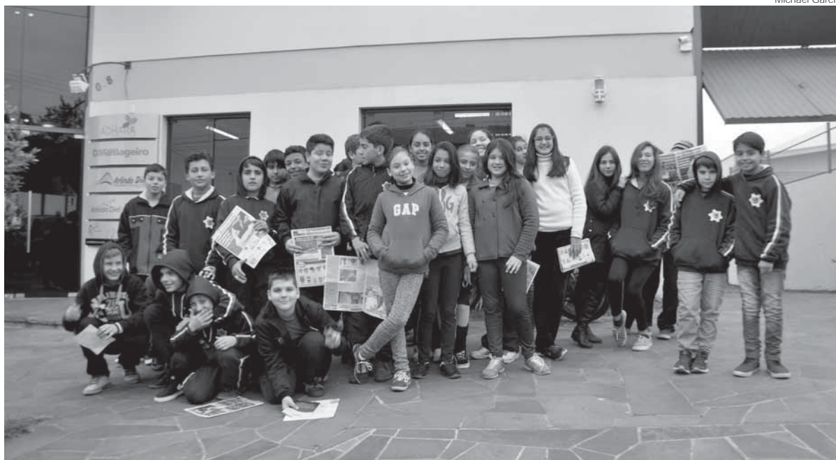
Turma 72, do 7º ano da E.T.E. Presidente Getúlio Vargas

Visita dos Alunos da Escola Técnica Estadual Presidente Getúlio Vargas aconteceu na manhã da última quarta-feira, dia 22