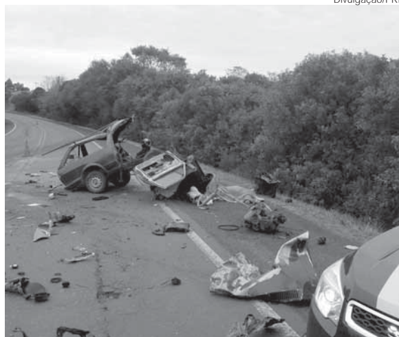
Com o impacto o automóvel partiu-se ao meio

Com a força do impacto o automóvel partiu-se ao meio. O motorista de 44 anos e único ocupante do VW/Parati faleceu no local. Já o motorista de 26 anos da carreta não se feriu. A Polícia Rodoviária Federal realizou o levantamento do local e o fato será apurado pela Delegacia de Polícia Civil de Entre-Ijuís.