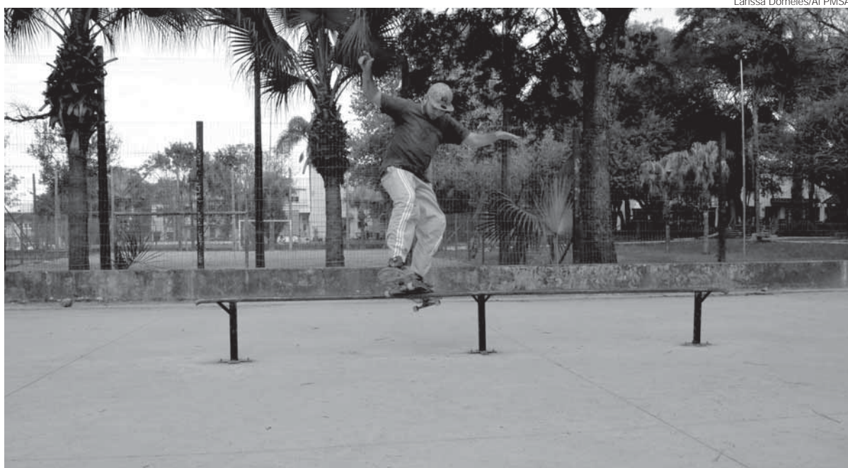
Espaço foi totalmente remodelado e entrega das melhorias ocorre neste sábado, às 16 horas

Será entregue neste sábado, dia 4, as obras de remodelação da Pista de Skate da Praça Ricardo Leônidas Ribas, a Praça do Brique.