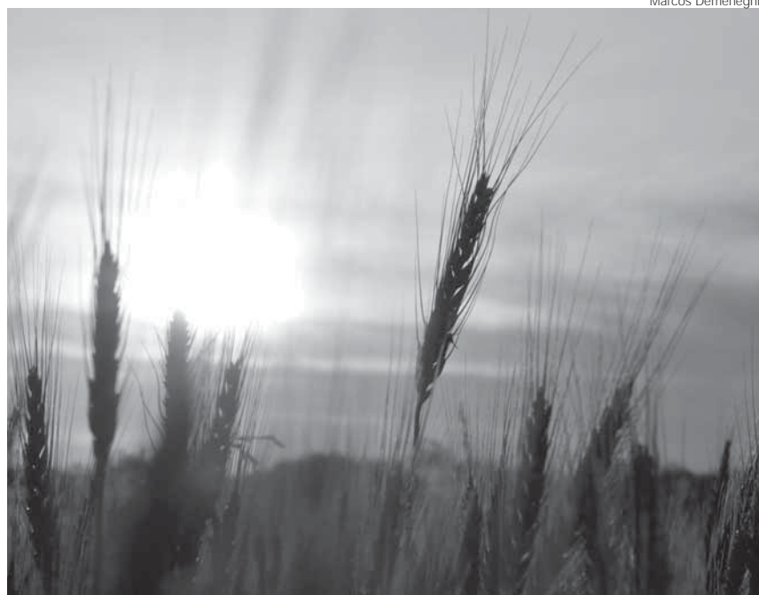
Em Santo Ângelo a área do plantio tem perspectiva de uma redução de 28% na área cultivada