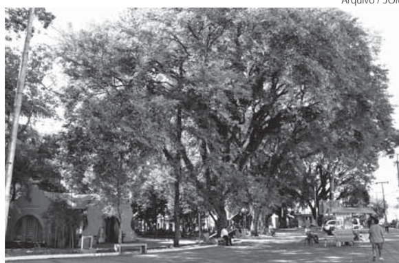
Brique da Praça é tradicionalmente realizado na Praça Leônidas Ribas