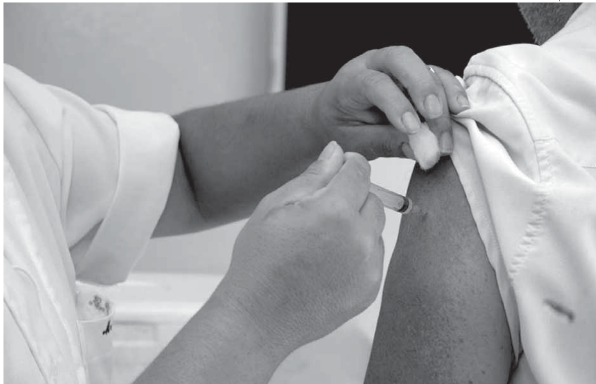
Atualmente Santo Ângelo tem sete casos confirmados de Gripe A

O Setor de Vigilância Epidemiológica e Imunizações da Secretaria de Saúde de Santo Ângelo prossegue aplicando a vacina contra a Gripe A em gestantes e puéperas (mulheres até 45 dias após o parto). Continua também a aplicação da segunda dose da vacina em crianças, na faixa etária entre 6 meses e 4 anos, 11 meses e 29 dias.