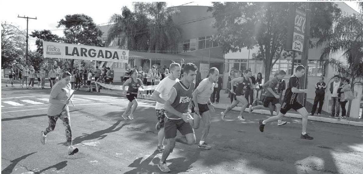
Corrida do Facho está na sua segunda edição e é promovido pelo curso de Educação Física da URI

Será realizada neste sábado, dia 4, com largada às 14h30min, a 2ª edição da Corrida do Facho URI. Chama. Promovido pelo curso de Educação Física da URI Santo Ângelo, o evento tem como objetivo fomentar a atividade física na cidade e é realizado em comemoração ao aniversário da URI Santo Ângelo.