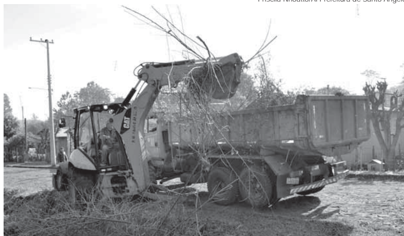
Entre os trabalhos realizado, está a limpeza em geral no bairro

Equipes da Vigilância Ambiental realizaram trabalho de orientação e visita aos pátios das residências para eliminação de possíveis criatórios do mosquito Aedes Aegypti – transmissor da dengue, chikungunya e zika vírus.