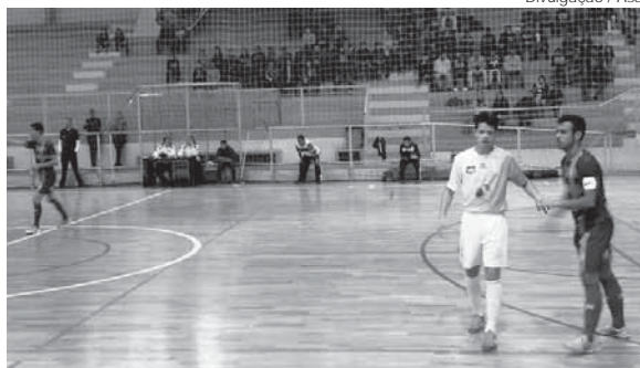
Partida contra o AFSJI tem início às 16 horas

As inscrições vão até o dia 30 de junho e são viabilizadas através de pulseiras-ingresso. A aquisição das pulseiras pode ser feita no site do evento ( www.fitnessmissoes.com.br ) ou na secretaria do curso de Educação Física, no subsolo do prédio 18 do câmpus Santo Ângelo. Acadêmicos de Educação Física da URI Santo Ângelo têm desconto. Mais informações sobre o evento estão disponíveis pelo telefone 3313-7975 ou no e-mail micheli@santoangelo.uri.br .