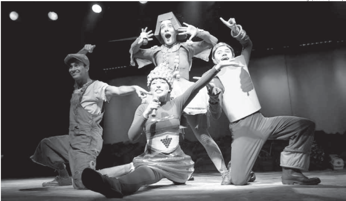
Espectáculo é apresentado pelo Grupo Arrepia e conta a história de um menino catador de lixo chamado Pitu

A Prefeitura de Santo Ângelo, através da Secretaria de Cultura, em parceria com a Saraiva e a Moimho Estrela trazem para a Capital das Missões a peça teatral "O Rei do Lixo". O espetáculo será apresentado neste sábado, 4 de junho, às 16 h no Teatro Municipal Antônio Sepp, em comemoração à Semana Nacional do Meio Ambiente.