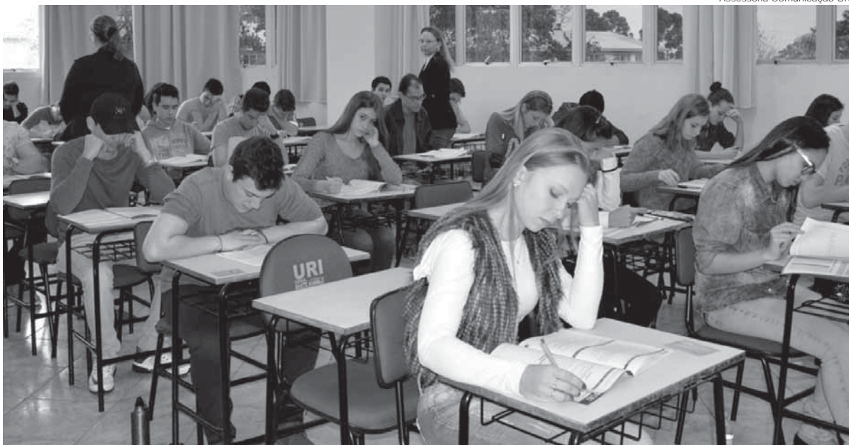
Provas serão realizadas no dia 12 de junho, com início às 14 horas

Até o dia 6 de junho, permanecem abertas as inscrições para o Vestibular de Inverno da URI, cuja prova do processo seletivo será aplicada dia 12 de junho, às 14h, com duração de quatro horas.