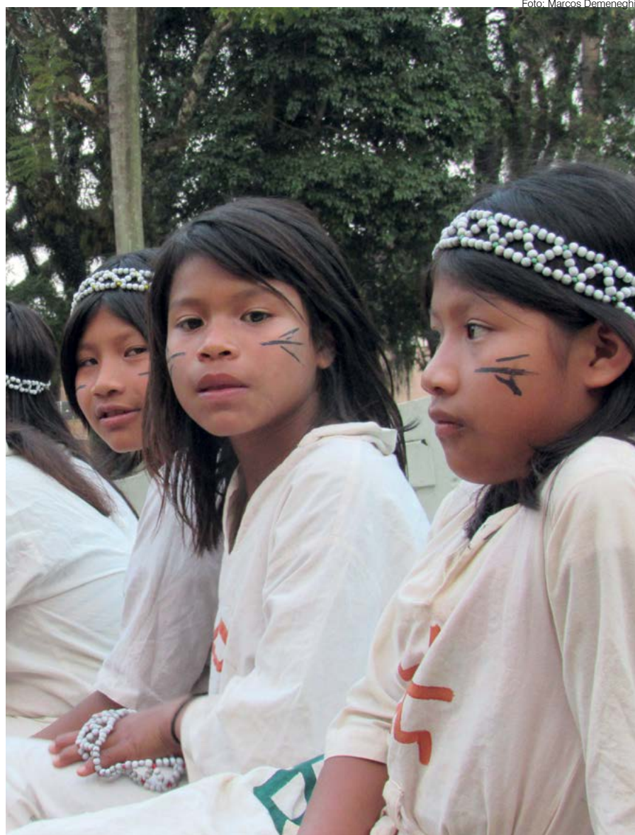
Indígenas que ainda vivem nas Missões (foto de 2019)