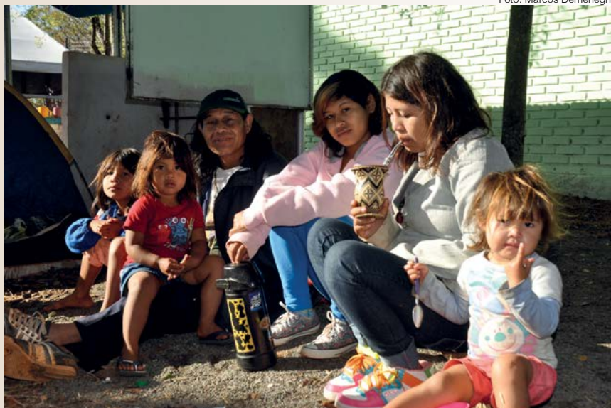
Família indígena da aldeia Guavirá Poty (foto de 2015 ilustrativa)